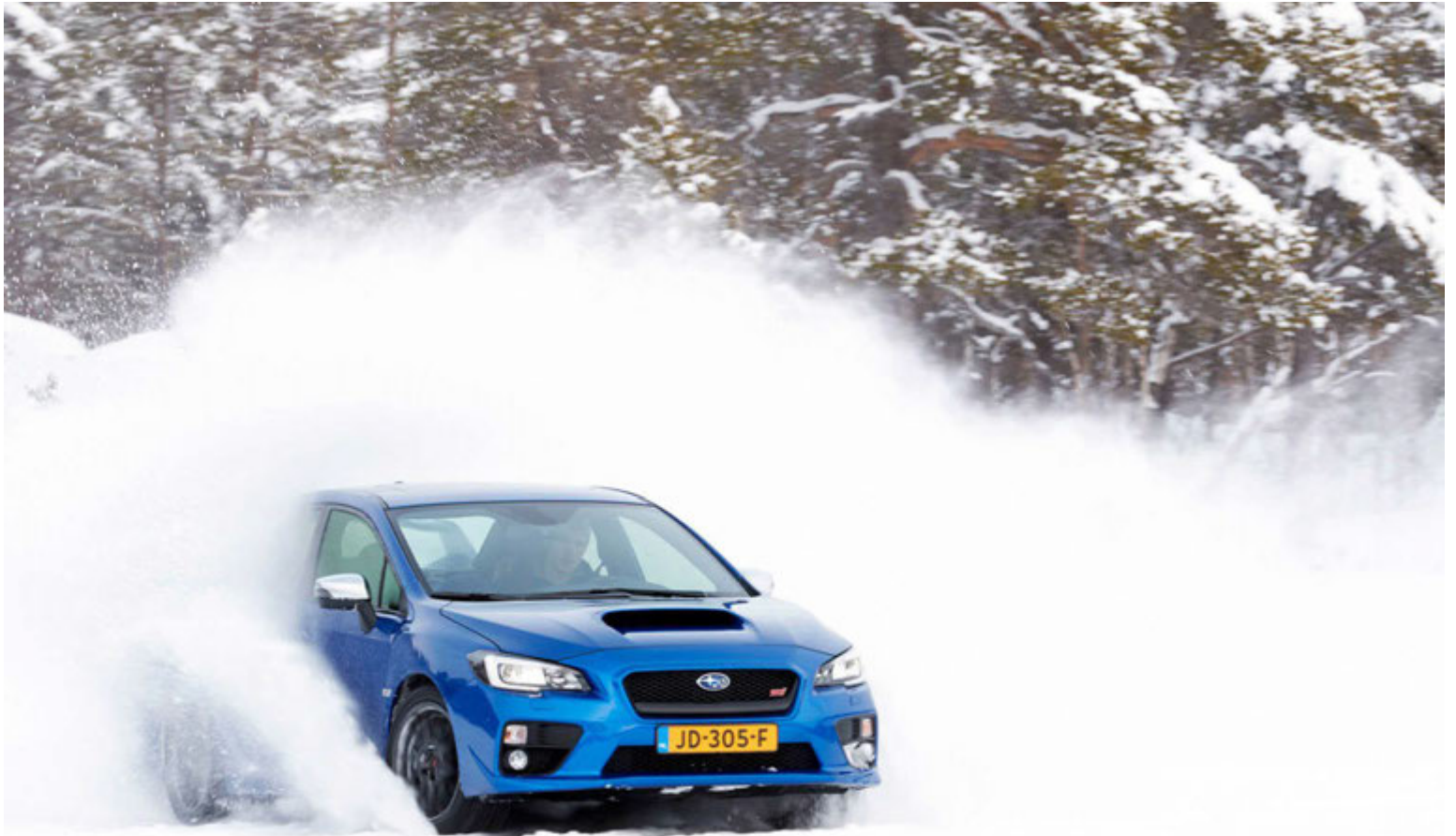
Subaru WRX STI er stórkostlegur bill til að reyna hæfileika sína á í driftinu í snjónum.

Akstursdagurinn var hreint ævin-týri og fjórskiptur að því leyti að um fjórar brautir var að ræða og í hverri þeirra mátti kynna hæfni bílanna við ólíkar aðstæður. Fyrst brautanna hjá okkur Íslendingum var driftbraut, hrikalega skemmtileg og ekki skemmdí bílaúrvalið. Fyrstan þarf að telja Subaru WRX STI bíl,