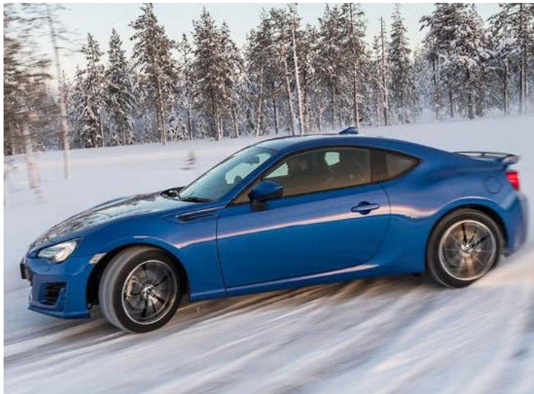
Subaru BRZ var alls ekki slæmt ökutæki heldur í snjónum í Rovaniemi.

300 öskrandi hestöfl og endalaust grip, því hann var á nettum nöglum. Til taks voru einnig Subaru BRZ, Subaru Levorg og Subaru XV. Vart þarf að taka það fram að skemmti-