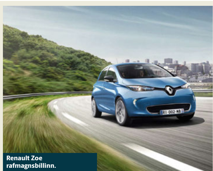
Renault Zoe rafmagnsbíllinn.