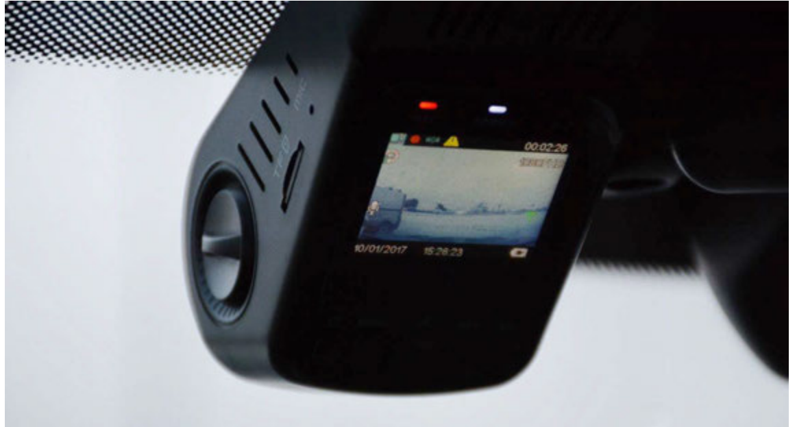
Bílamyndavél eins og títt er að rússneskir bílaeigendur nýti sér.

Street Guardian myndavélin sem prófuð var er áströlsk að uppruna. Vélin sem slík er ekki fyrirferðarmikil og lítið mál að koma henni fyrir, venjulega bak við baksýnisspegil þar sem hún heftir ekki útsýni öikumannsins. Einnig