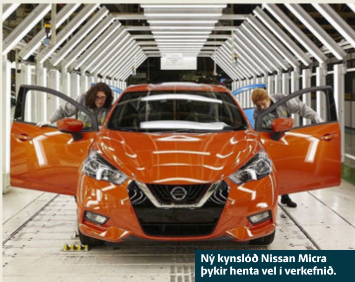
Ný kynslóð Nissan Micra þykir henta vel í verkefnið.