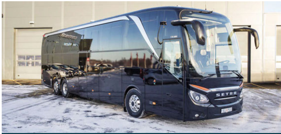
SETRA TOP CLASS Öll sæti rútunnar eru búin tveggja punkta öryggisbeltum. Aftast í bílnum er eins konar setustofa, þar eru sex sæti umhverfis borð.

Ghosn segir að Nissan sé með verkefninu að taka þátt í þeirri þróun sem sé að verða í heiminum þar sem hlutverk „einkabilsins“ í huga unga fólksins sé að breytast og verða sveigjanlegra. Billinn gegni félagslegu hlutverki í ríkari mæli og sífellt fleiri vilji deila eignarhaldi á bíl með öðrum sem hafa svipaðar þarfir. Því fylgi bæði aukid frelsi og minni kostnaður. Ghosn segir að hinn splunkunýi Micra (sjá annars staðar á síðunni) sé kjörinn bíl fyrir þetta hlutverk enda búinn þeim tækninýjungum sem unga fólk hafi mesta þörf fyrir. Nýr Nissan Micra er smíðaður í verksmiðju Renault í Flins skammt utan við París og er Micra fyrsti bíl Nissan sem smíðaður er hjá Renault. Fyrstu bílarnir fara á helstu lykilmarkaði í Evrópu um miðjan febrúar. BL fær fyrstu bílana í mars.