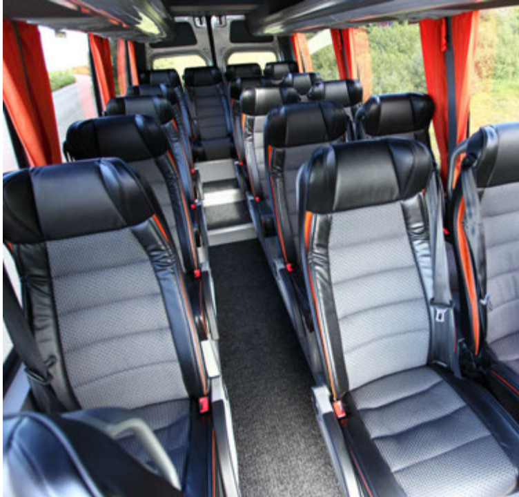
Rútan er mjög rúmgóð með stærstu mögulegum gluggum.