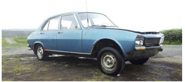
„Ég á þennan 504 árg 74 Peugeot. Hann var síðast á nr. Þ-2596. Hann er í hægri uppgerð hjá mér núna og að henni lokinni fær hann Þ-422 sem var númer í eigu móður minnar lengst af.“