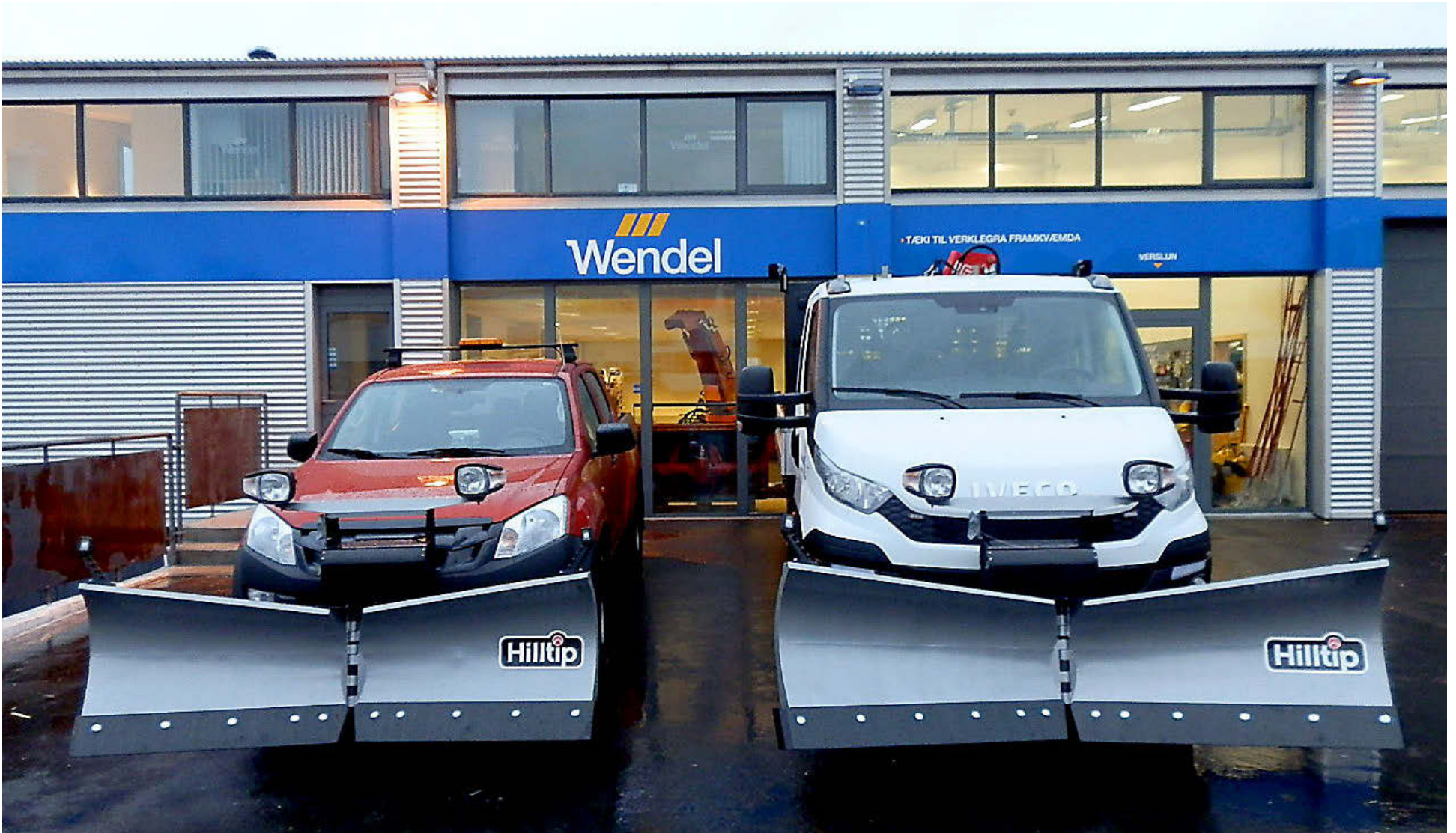
A. Wendel ehf. tók nýverið við einkaumboði á Íslandi fyrir Hilltip frá Finnlandi sem framleiðir búnað fyrir pickup bíla og minni vörubíla.