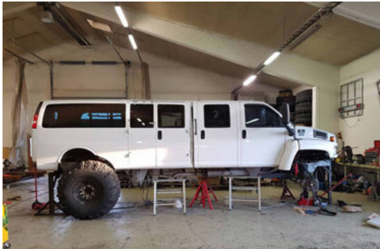
„Drifbúnaður undan Benz Unim hefur staðið fyrir sínu í gegnum árin og þá var ekki um neitt annað að ræða en 54 tommu dekk. Grjóthart dæmi.“

ig olúsíunni fyrir sjálfskiptinguna svo drifskafitið nartaði ekki í hana. Nýir olíutankar voru settir í bílinn og loftkútur. Bílarnir eru ansi háðir lofti verandi á loftþúðafjöðrun og 54 tommu dekkjum. Því voru keyptar snigilpressur frá Kanada sem afkasta 2.000 lítrum af lofti á mínútu. Óflugasta rafmagnsdæla sem ég hef séð í