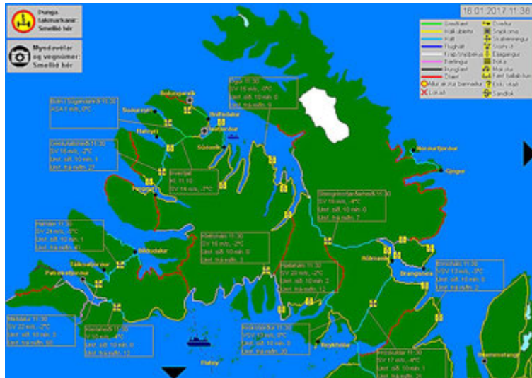
Kortið eins og það hefur litið út síðustu tuttugu árin.

myndir með línuritum eru nýju línurit teiknuð í vafra notandans á grundvelli gagna um veður og umferð síðustu sólarhringa. Nýju línurit hafa m.a. þann eiginleika að þau aðlaga sig að skjástærð notandans. Einnig birta þau benditexta með ítarupplýsingum þegar notandi fer með mús yfir línurit eða snertir þau á snjalltæki.