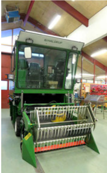
Tilraunasláttuvél leysir af hólmi verkfæri á borð við sláttuvél og hrífu.