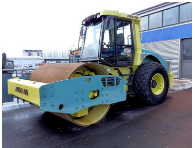
Ammann valtarar eru á meðal helstu vörumerkja Wendel.

Hilltip vöruúrvalið inniheldur m.a. dreifara, snjótennur, pækildreifara, sópa og háþrýsti-þvottabúnað. Dreifararnir eru rafdrifnir og geta dreift salti, sandi, áburði og eða vökva. Dreifararnir eru veghraðatengdir og geta því aukið eða minnkað magn eins og við á hverju sinni. Þeir eru jafnframt útbúnir fullkomnu stjórnborði sem búið er að íslenska.