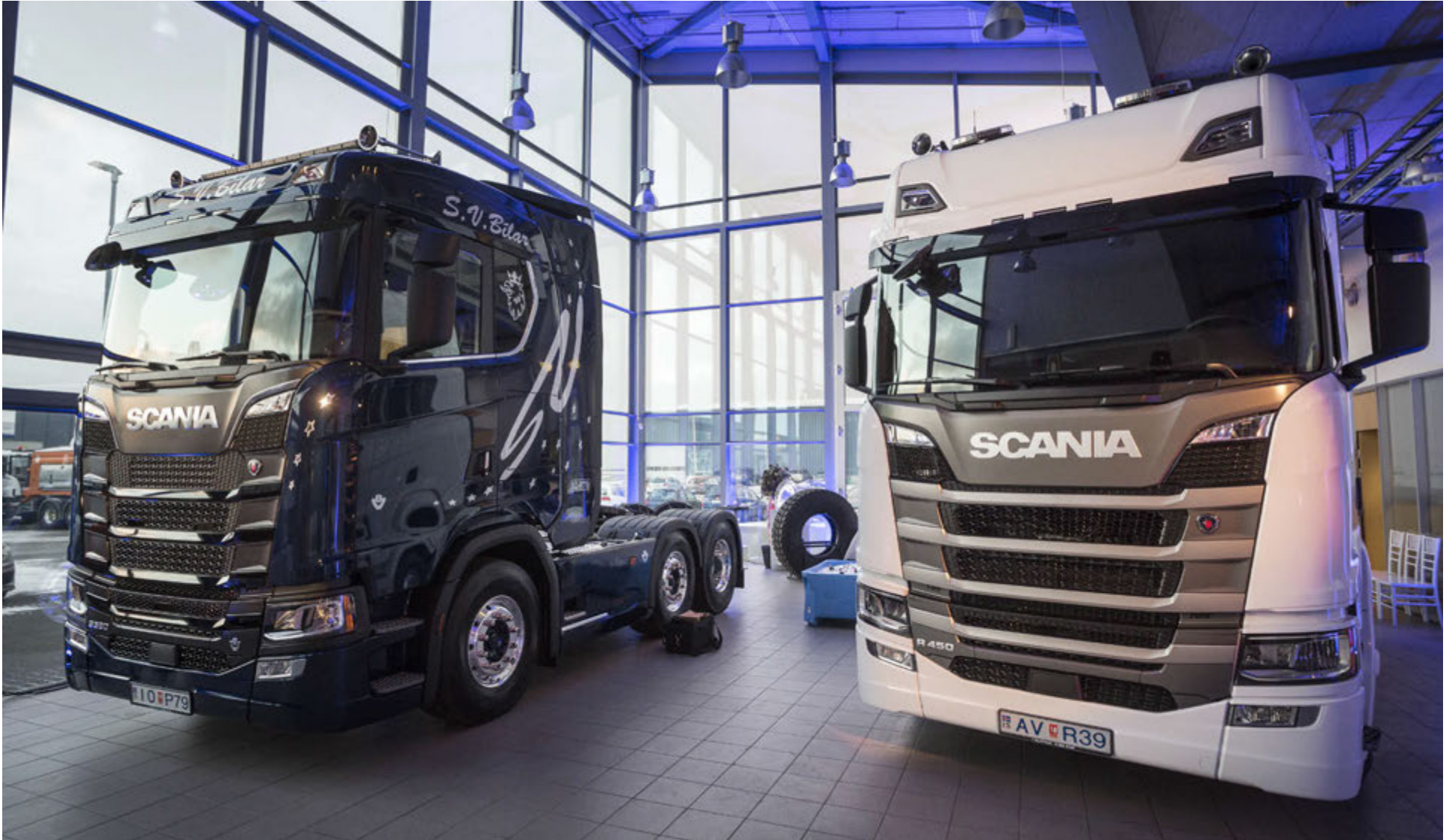
Tveir glænýir Scania vörubílar sem sýndir voru í glæsilegum sýningarsal Kletts í Klettagörðum 8-10.