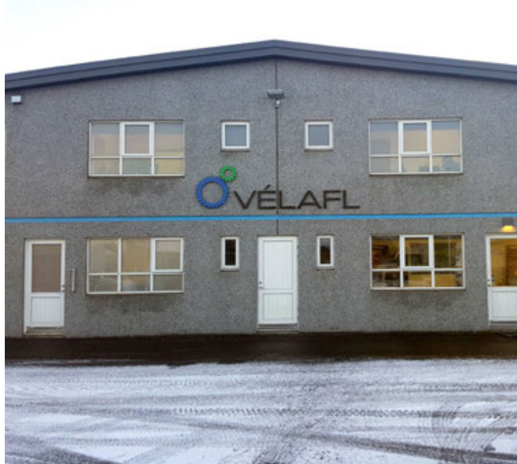
Vélafl er til húsa í nýlegu og rúmgóðu húsnæði að Rauðhelli 11 í Hafnarfirði sem inniheldur m.a. 1.380 m 2 verkstæði og lager.