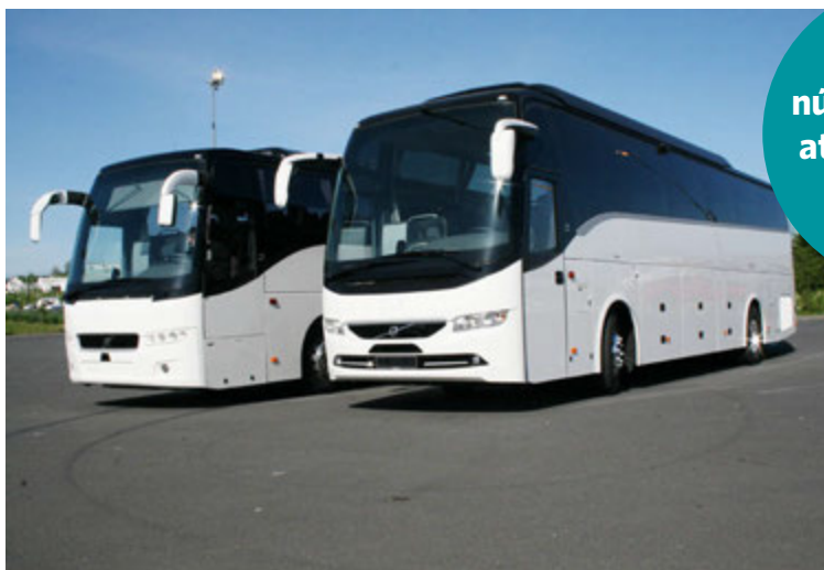
Glæsilegar Volvo 9500 og Volvo 9900 hópferðabifreiðar til á lager að Bildshöfða 6.

Markaðurinn er að færast í eðlilegt horf hvað varðar nýskráningartölur í vörubifreiðum og vinnuvélum en við vorum með allt að 27 prósentu markaðshlutdeild í vörubifreiðum yfir tíu tonn að þyngd á síðasta ári og gerum ráð fyrir að árið 2017 verði betra en síðasta ár.