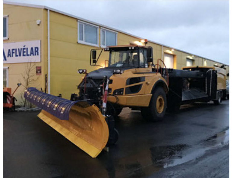
Aflvélar afhentu nýlega Reykjavíkurlflugvelli stærsta flugbrautarsóp landsins.

vegar sambyggt tæki með liðstýringu þannig að hausinn hreyfist til hliðanna svipað og hjólaskófla. Þá er tönnin fremst og sópurinn fylgir á eftir. Þannig fær ökuumaðurinn betra útsýni og á auðveldar með að stýra sópnunum enda er hann miklu líprari í vinnslu.“ Sópurinn er líka afkastameiri en aðrir hefðbundnir sópar. „Þetta breytir miklu fyrir Reykjavíkurlflugvöll. Sópurinn er það breiður að þeir geta sleppt heilli ferð á brautinni. Það sparar tíma og þar með peninga.“