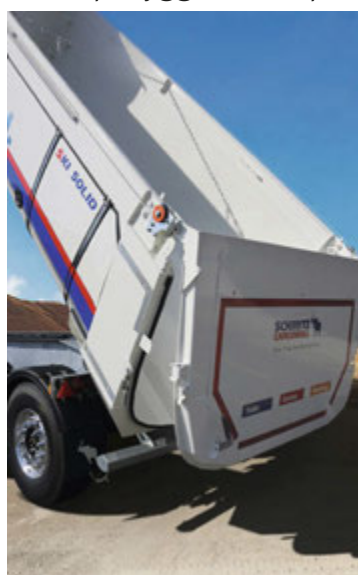
Schmitz býður uppá mismunandi útfærslur á lokun að aftan, bæði með vör og sléttri lokun.

Viðskiptavinir okkar eru oftast ekki kraftmiklir, stórskemmtilegir og duglegir framkvæmdamenn sem liggja ekki á skoðunum sínum.