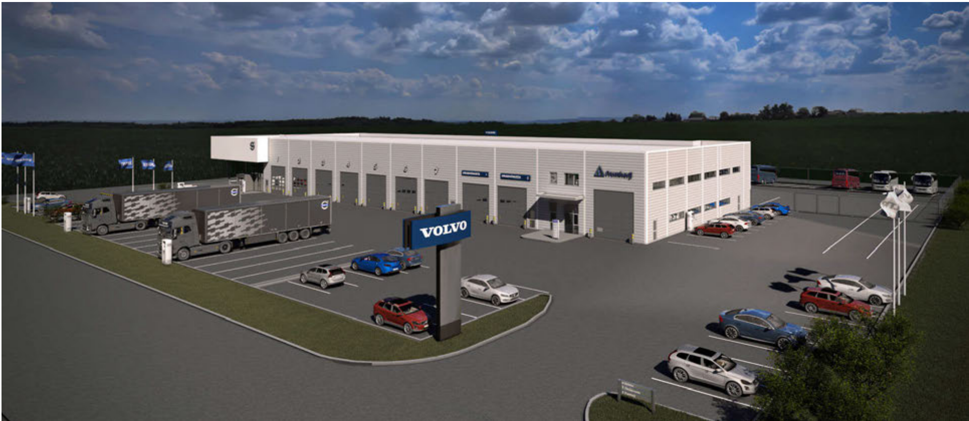
Framtíðarhúsnæði Volvo atvinnutækja að Hádegismóum 8.