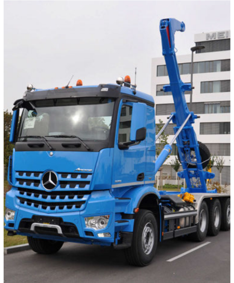
Bifreiðastöð PPP fékk nýverið afhentan Mercedes-Benz 4 öxla vörubíl með Meiller krókheysi.

» Eigendur Meiller búnaðar á Íslandi geta því héðan í frá leitað til bílaumboðsins Öskju með fyrirspurnir varðandi viðhald, viðgerðir og endurnýjun. Auk þess erum við með helstu varahluti á lager.