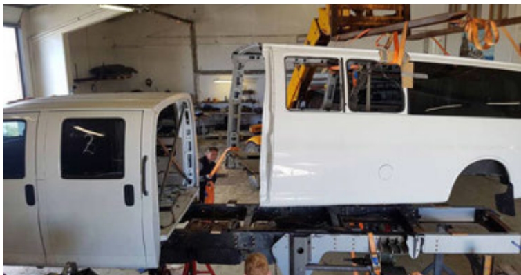
Hlutarnir settir saman.