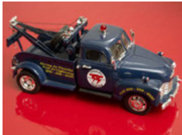
Fallegur dráttarbill sem vekur upp gamlar minningar.