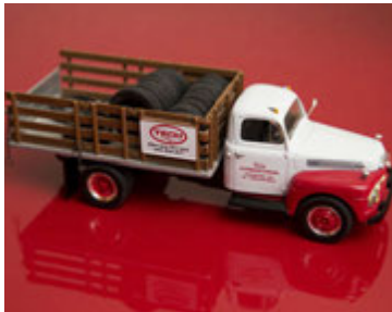
Það er hugsað fyrir öllum smáatriðum á bilunum.