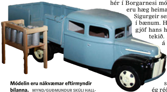
Módelin eru nákvæmar eftirmyndir bílanna.

Á safninu í Borgarnesi eru nokkur módel sem Sigurgeir smíðaði og á Samgöngumínjasafninu í Stóra-gerði í Skagafirði eru tvö. „Ég átti frumkvæðið að því að gefa safninu hér í Borgarnesi módelin en það eru hæg heimatökin,“ segir Sigurgeir sem sjálfur býr í bænum. Hann segir að gjöf hans hafi verið vel tekið. „Konan sem á safnið fyrir norðan sá módelin hér og lýsti áhuga á að fá módel á safnið sitt svo ég réðst í að smíða