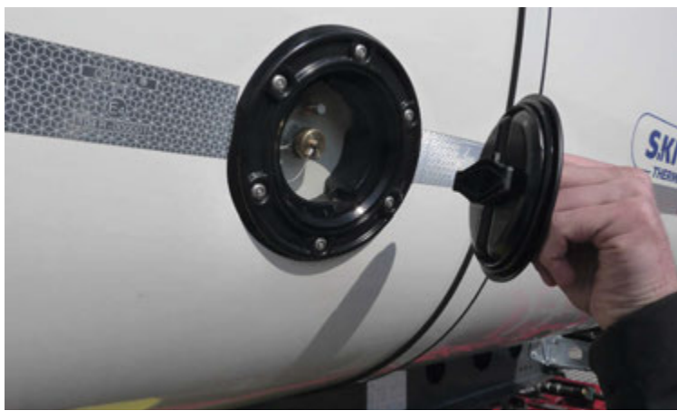
Tvö op eru á sitt hvorri hlið malbiksvagnanna þar sem hægt er að mæla og fylgjast með hitanum í malbikinu.

hefur þróað nýjungar sem stöðugt eru að koma fram. Á Íslandi eru í notkun fjöldi Schmitz malarvagna og reynslan af þeim vögnum er mjög góð segir Sigurður. „Nú á