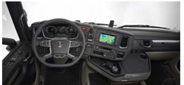
Mælaborðinu er haganlega fyrir komið og öll stjórnþæki við höndina.