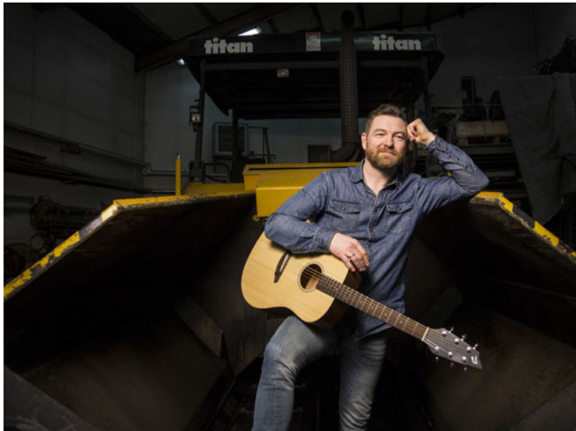
Sváfnir steig upp úr skrifstofustólnum og tók einn dag í malbiksvinnu fyrir nokkrum árum. „Ég datt strax í gamla girinn.“