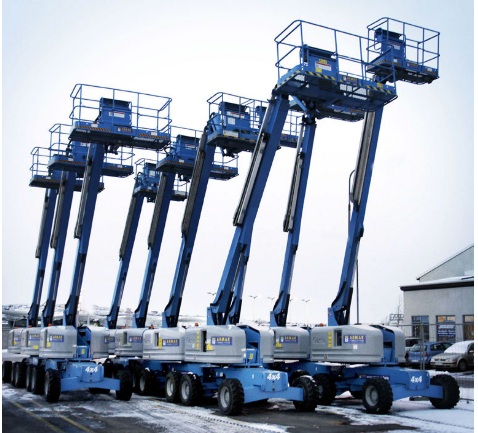
Genie er annar tveggja stærstu lyftuframleiðenda heims.

Armar Vinnulyftur eru til húsa að Kaplahrauni 2-4. Allar nánari upplýsingar er að finna á armar.is