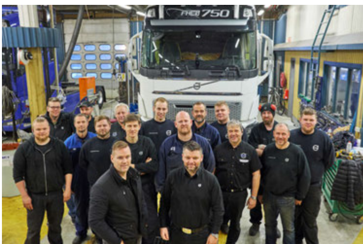
Hluti af starfsmönnum Volvo atvinnutækja inni á verkstæði.