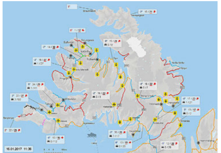
Í dag eru kortin mun aðgengilegri, sér í lagi í snjallsímum og spjaldtölvum.

fyrir vegfarendur til að átta sig á færð og aðstæðum á vegunum áður en lagt er í ferðalag. „Sjá má ástandið á veginum, hvort hált sé eða þæfingsfærð o.s.frv. Hvort unnið sé að snjómokstri eða hvort leiðin sé einfaldlega ófær. Á vef-