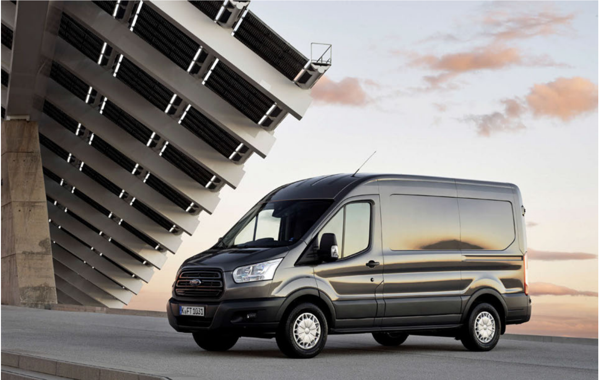
Transit Van fæst í þremur lengdum og er fánlegur með háum toppi sem eykur hæð hleðslurýmis verulega.