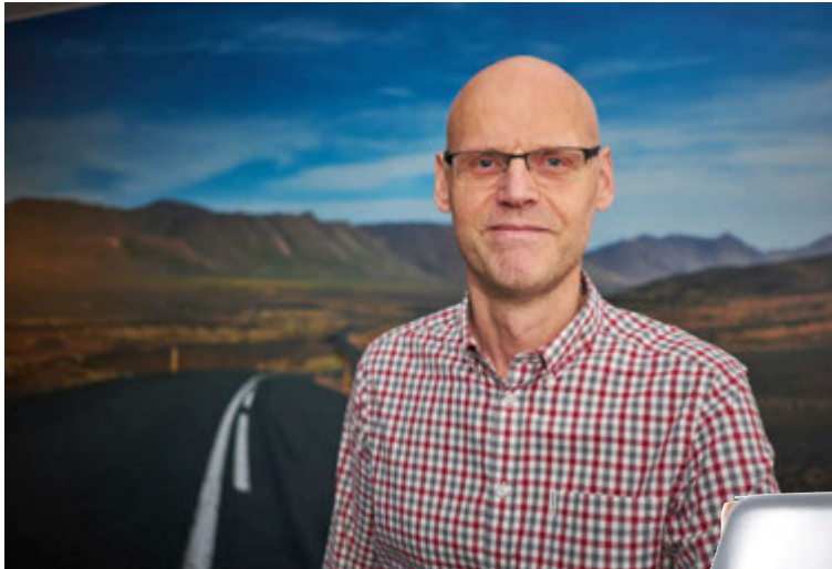
Að sögn Víðis er lögð mikil áhersla á þróun og prófanir hjá Exxon Mobil.

Hjá Exxon Mobil er að sögn Víðis mikill metnaður lagður í að framleiða hágæða smúrolíur og er því mikið lagt í þróun og prófanir á framleiðslunni. „Þróunarvinna er unnin hjá Exxon Mobil en ekki stuðst við aðkeyptar „uppskriftir“ eins og sum minni olúfélög gera gjarnan. Þá er mikil áhersla lögð á að vinna