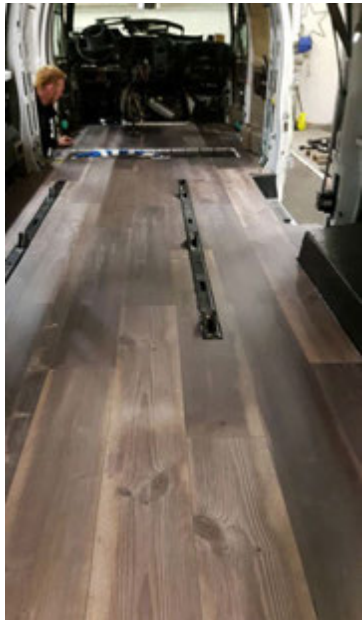
Gólfteppið var tekið úr og vínillparket sett í staðinn. Undir því er gólfhiti.

» Drifbúnaður undan Benz Unim hefur staðið fyrir sínu í gegnum árin