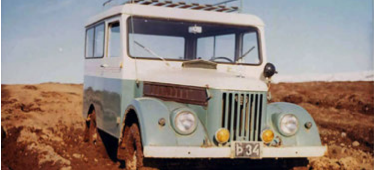
Þ-34 GAZ 69 Rússa jeppi sem var í eigu Björns Sigurðssonar. Bíllinn er nú verið að gera upp.