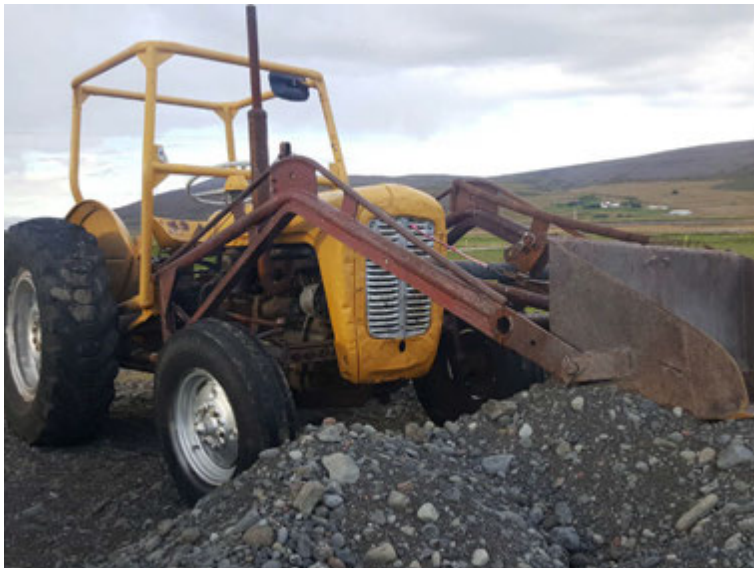
„Uppáhalds dráttarvélin mín er eldgömul Massey Ferguson 35, 58-módel sem afi keypti nýja á sínum tíma. Þá var hún víst rauð en einhvern tímann var hún máluð gul og ég þekki hana bara sem „Gulu vélina“.“

undir stýri við að moka út úr gömlu fjárhúsunum sem voru, en þá var stór skófla tengd aftan í Gulu vélina með vírum og vélin dró hana út. Svo bakkaði ég vélinni aftur og skóflan rann inn á vírunum. Þannig keyrði ég fram og aftur allan daginn. Þetta var fyrir afskaplega löngu síðan.“