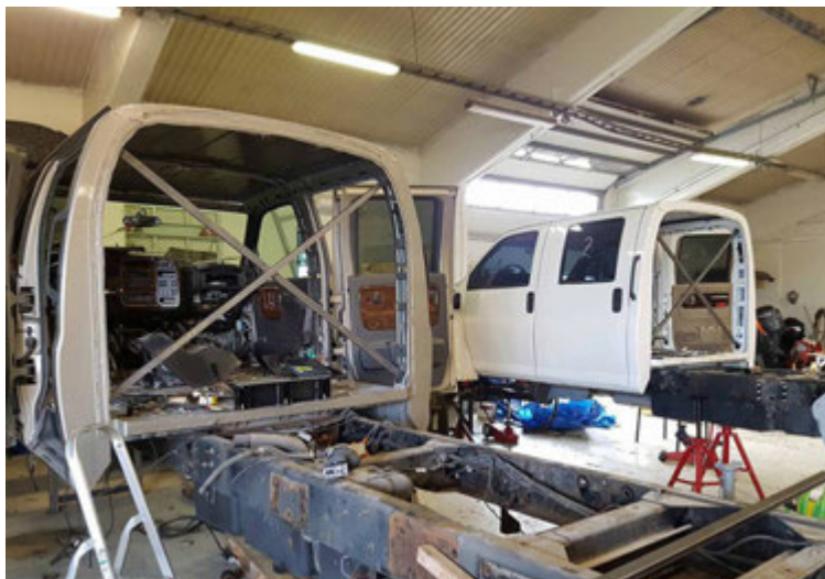
Framendi bílsins, grindin, vélin og sjálfskiptingin er Chevrolet Kodiak.

jeppa afkastar 500 lítrum á mínútu meðan það er til nóg rafmagn. Hásingarnar komu undan Benz Unim og í þeim eru driflæsingar. Svo eru tveir auka lágir millikassar auk venjulegs millikassa. Toppinn þurfti að hækka auk þess sem orginal teppið var tekið úr og vínillparket sett í staðinn. Undir því er gólfhiti. Olíumiðstöðin getur