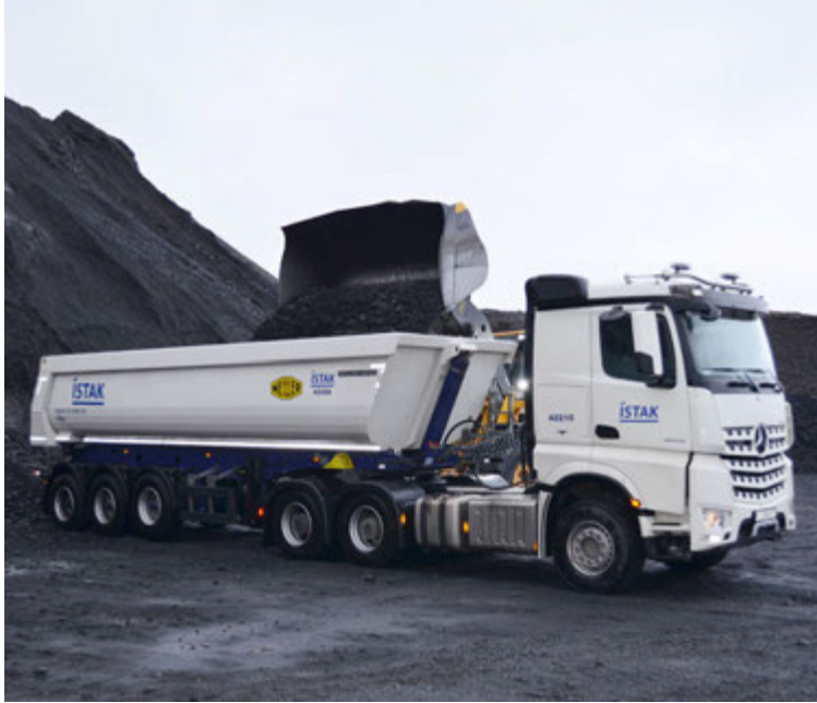
Askja afhenti nýverið verktafyrirtækinu Ístak þrjú nýja malarvagna frá Meiller.

Askja hefur verið umboðsaðili Mercedes-Benz frá árinu 2005. Starfsmenn Öskju eru yfir 100