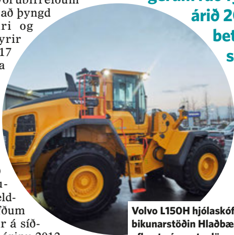
Volvo L150H hjólaskófla sem Malbikunarstöðin Hlaðbær Colas fær afhenta á næstu dögum.