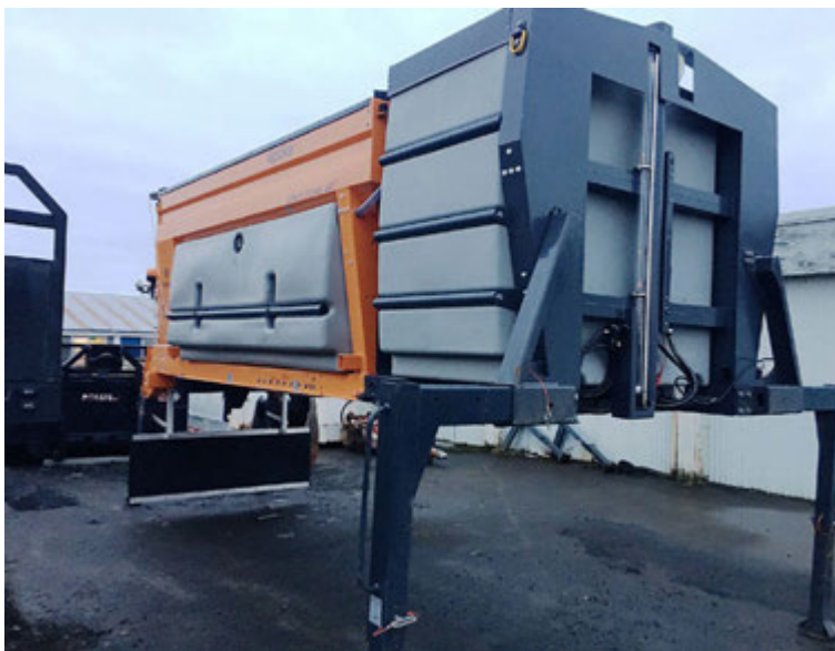
Á haustmánuðum afhenti Wendel talsvert af stórum salt- og sanddreifurum frá Epoke og fóru þeir til verktaka bæði á landsbyggðinni og á höfuðborgarsvæðinu.

„Á haustmánuðum afhentum við talsvert af stórum salt- og sanddreifurum frá Epoke og fóru þeir til verktaka bæði á landsbyggðinni og á höfuðborgarsvæðinu. Þessir dreifarar voru bæði í combi- og standard-útfærslum og nær allir með GPRS feril og aðgerðaskráningarbúnaði. Þá afhenti fyrirtækið nýjan Johnston 201C gatnasóp í nóvember síðastliðnum en hann er kominn í notkun í Hvalfjarðargöng-