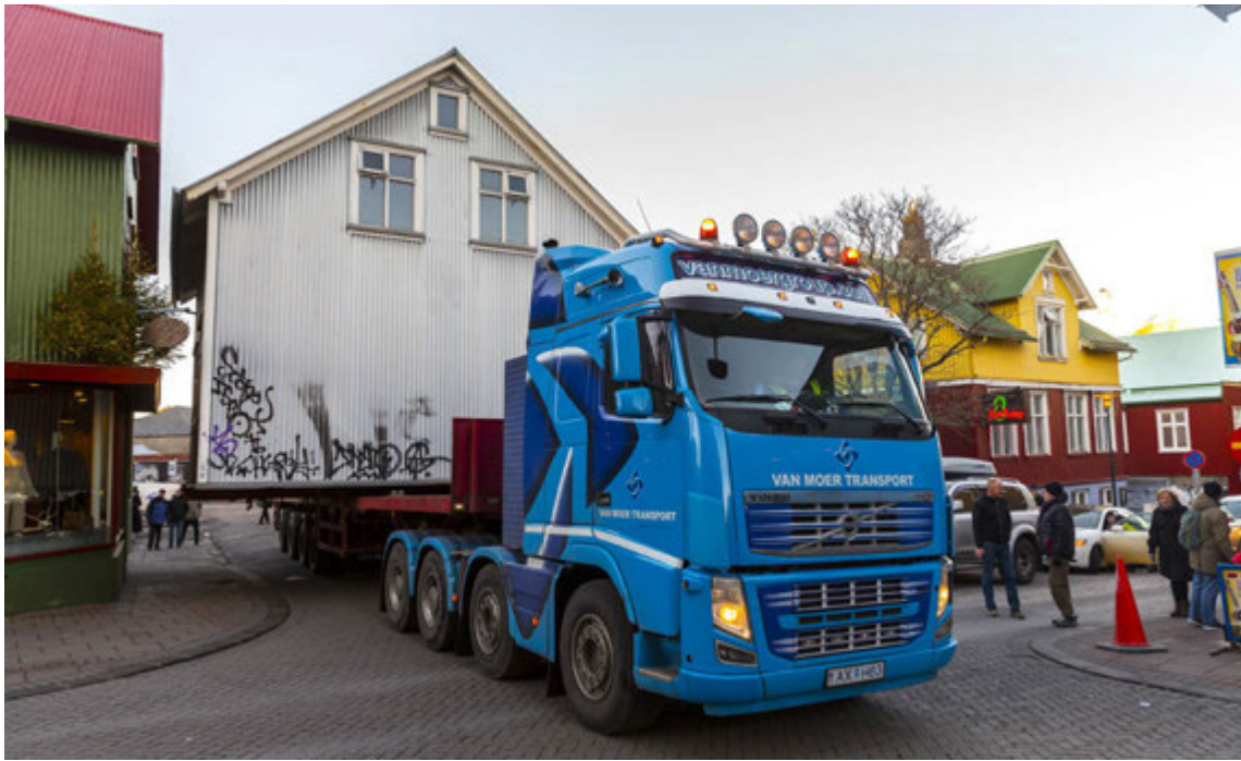
Hér má sjá þegar Fylkir flutti húsið að Vegamótastíg 9 yfir á Grettisgötu 45 fyrr á þessu ári.

Húsaflutningaferill Fylkis hófst fyrir nokkrum árum. „Ég byrjaði að vinna með fyrirtæki sem hét GB kranar þar sem ég var plataður í að flytja sumarhúsa og stærri vinnuskúra. Svo vatt þetta upp á sig og menn fóru að leita til mín um að flytja stærri hús.“ Húsaflutningar eru með sérhæfðari flutningum. „Það þarf útsjónarsemi og þekkingu á reikningsformúlum til að geta séð út hvað þarf til. Fyrst þarf að mæla húsið, bæði ummál og þyngd og velja bestu leiðirnar út frá því. Einnig þarf að reikna út hvernig sé best að taka húsið af sökklínunum og finna rétta búnaðinn til þess en ég ræð yfirleitt aðra til að sjá um að hafa það upp og er svo með aðstoðarmenn. Að þessu loknu fer undirbúningsvinnan af stað.“ Undirbúningsurinn felst meðal annars í því að útvega stálbita sem húsin eru hífð upp á og svo eru húsin tjökkuð upp á stálbitana með 20 tommu tjökku. „Þegar undirbúningsvinnan er búin tekur við að sækja um öll leyfi. Fyrst þarf að sækja um leyfi hjá skipulagsyfirvöldum til að flytja húsið. Þegar það liggur fyrir er send inn umsókn til Samgöngustofu sem leitar eftir samþykki hjá Vegagerðinni og svo er þessi samþykkt send umferðardeild lögreglunnar. Ég er svo í sambandi við hana til að fá mannskap í að fylgja mér þegar ég flyt húsið, aðstoða við götulokanir og svo framvegis.“ Í janúar flutti Fylkir hús á