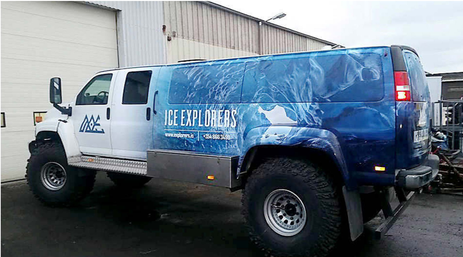
„Eins og staðan er akkúrat núna er þetta stærsti jeppi á landinu. Það er reyndar verið að smíða svipaðan bíl, 8 hjóla. Ég er að leita allra leiða til að toppa það,“ segir Þröstur sposkur.