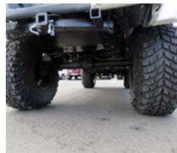
Bíllinn er búinn svokölluðum unimock hásingum en þær sitja mun hærra en hefðbundnar hásingar.