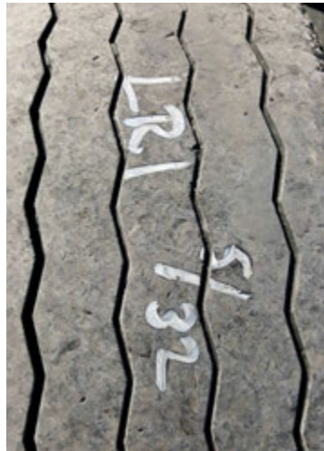
Gömlu dekkinn sem Þorkell tók undan á dögnum.

En hvernig lætur maður dekkinn endast svona lengi? Þorkell segir nokkur atriði skipta höfuðmáli. „Í fyrsta lagi skiptir öllu að vera með