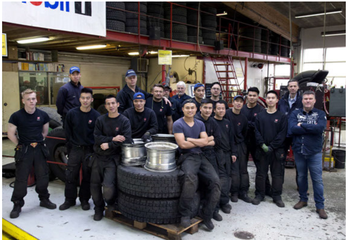
Samheldinn hópur starfsmanna N1 á Réttarhálsi.

„Við pöntum dekk frá Michelin í gámanvís í hverri viku þannig að við getum í mörgum tilfellum fengið dekk frá þeim á tveimur til þremur vikum. Michelin er einn stærsti hjólarðarframleiðandi í heimi og leggur gríðarlega