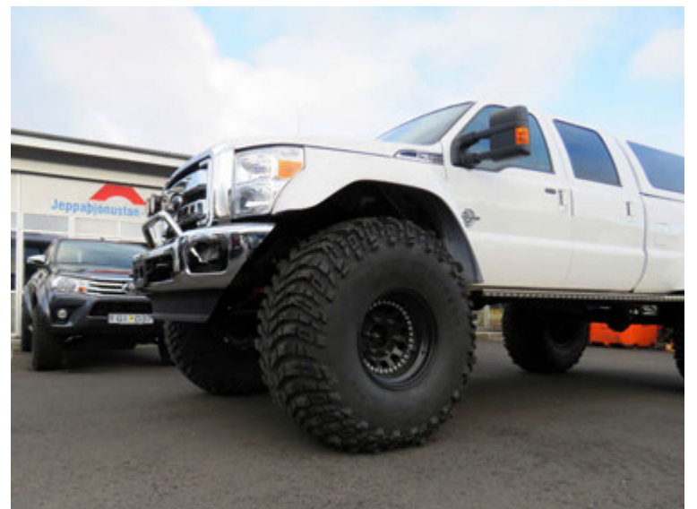
Jeppaþjónustan Breytir ehf. hefur umsjón með breytingunum. Vonast er til að bíllinn verði tilbúinn fyrir áramót.