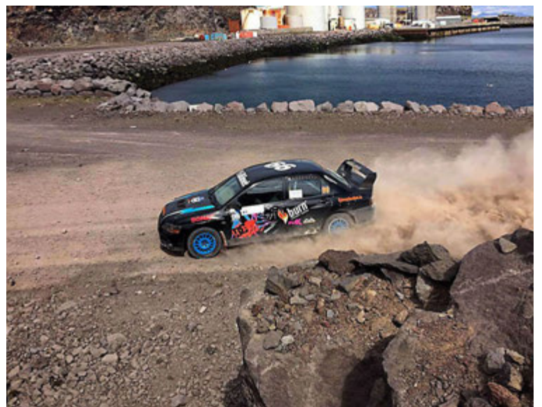
Rallíbillinn í akstri.