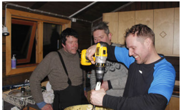
Tíu lítrar af bearnaise-sósu matreiddir í Jökulheimum með sérútbúinni borvél.

stað á föstudeginum, færið var gott og engin teljandi vandamál á leiðinni utan nokkurra smábilana sem var reiddað fljótlega. Á laugardegnum var stefnan sett á Jökulheima en þar sem það er örstutt frá Veidivötnum átti að fara bakdyraleiðina. Við fórum að Tröllinu og þar yfir Tungnaá. Það var smá bras á leiðinni þar sem einn bíllinn fór á hlið ofan í sprungu í Veidivatnahrauninu. Bíllinn