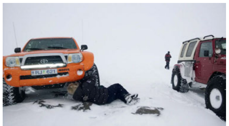
Farið yfir stöðu mála í einni pásunni.

Þetta er skemmtilegur hópur að þeirra sögn, fjölbreytt bílaflóra og mórallinn er góður. „Það er gaman að sjá alla jeppana koma saman og fara sömu leið. Við erum strax búin að ákveða næstu dagsetningu og matseðilinn en að öðru leyti er ekki búið að plana mikið. Aðalatriðið er að bóka skála og ákveða nokkurn veginn hvaða leið við ætlum að fara.“