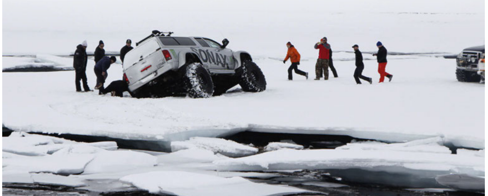
Ís brotnaði undan 54 tommu Ram.