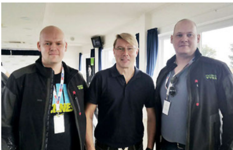
Starfsmenn Max1 með Mika Häkkinen.

Nokian dekkinn eru sérframleidd fyrir norðlægar slóðir og ég veit að ég get treyst þeim í hvaða aðstæðum sem er.