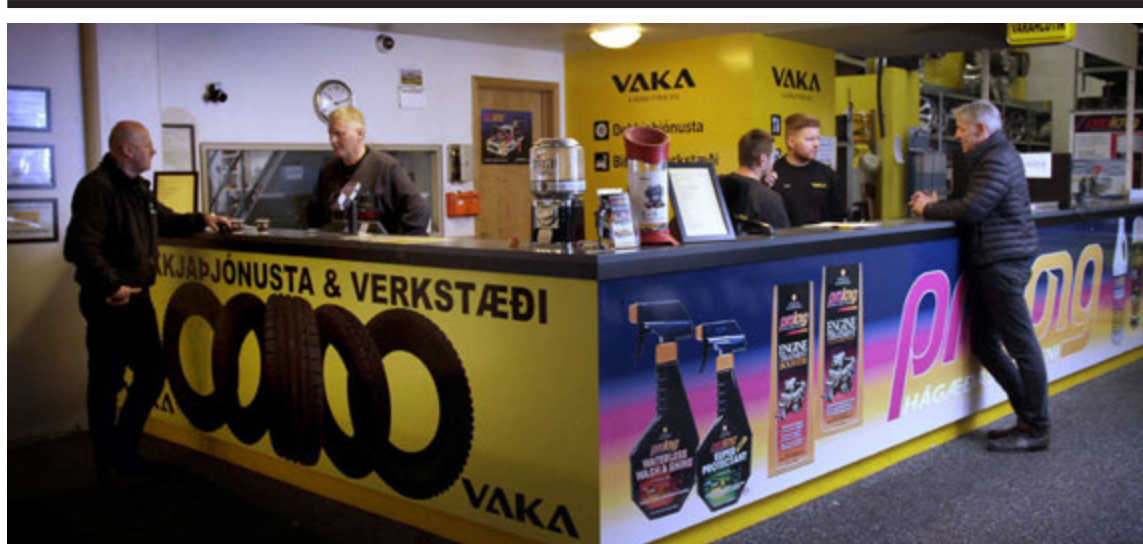
Það er vel tekið á móti viðskiptavinum hjá Vöku í Skútvögi.

„Á síðustu fimm árum hafa um sjötíu prósent slysa á erlendum ferðamönnum verið útafakstur og bílveltur og í slíkum slysum getur beltið oft skilið milli lífs og dauða, eða að minnsta kosti skilið á milli smávægilegra marbletta og alvarlegra meiðsla.“