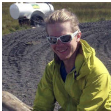
Fannar segir bíllinn koma til með að reynast vel á hálendinu og í slæmri færð.

En af hverju ákvæð Kyndill að ráðast í þessi kaup? „Við höfum alltaf verið mikil tækjasveit. Við erum með marga jeppa, öflugra sleðasveit og fjórhjóladeild. Við erum nú þegar með einn Ford Econoline sem er á 46 tommu dekkjum. Það var mikil umræða um það hvort við ættum að fá okkur annan bíl í þeim stærðarflokki eða jafnvel minni og léttari bíl en það hefur verið þróunin hjá flestum sveitum á höfuðborgarsvæðinu. Þar eru menn að bæta við sig 38 tommu eða 44 tommu Toyota Land Cruiser eða Hilux svo dæmi séu nefnd. Eftir vandlega íhugun ákváðum við hins vegar frekar að fara í stærri bíl enda máttum við það svo að mögulega væri meiri þörf á slíkum bíl í útköll þar sem um er að ræða mikla ófærð. Þá bindum við vonir við að hann muni vinna vel á móti hinum Fordinum okkar. Þetta verður flott par.“