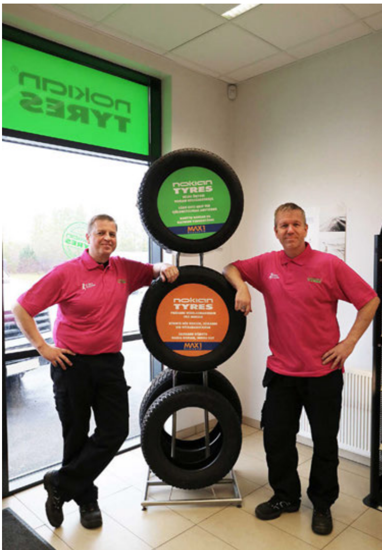
MAX1 leggur áherslu á að veita viðskiptavinum ráðgjöf við val á dekkjum því dekk eru flókin vara og mismunandi hvað hentar hverjum og einum. Hluti ágóða af sölu Nokian dekkja rennur til Krabbameinsfélagsins í október og nóvember.