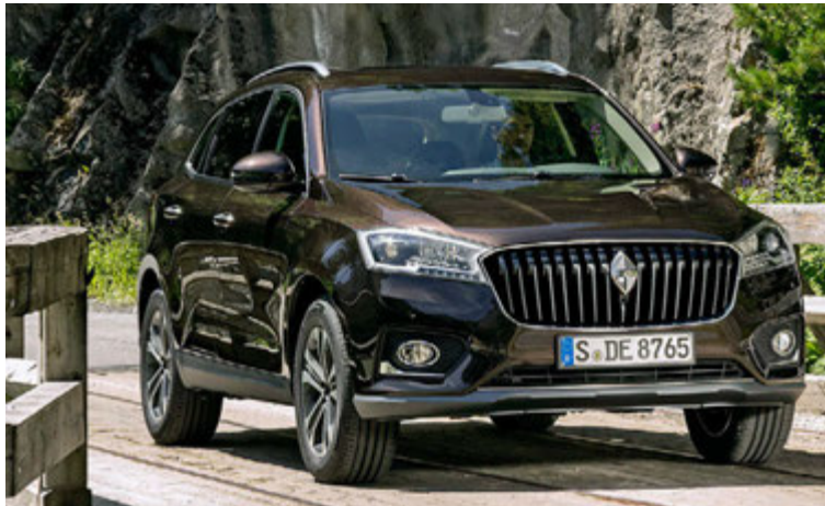
Borgward BX7 jeppinn.