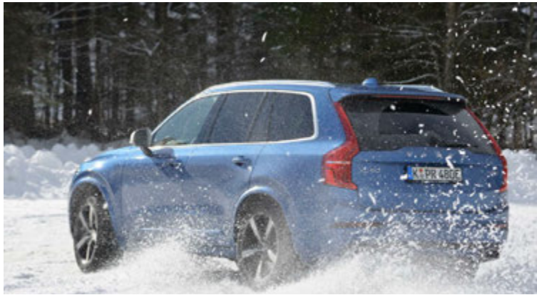
Volvo XC90 var bíll ársins í fyrra.