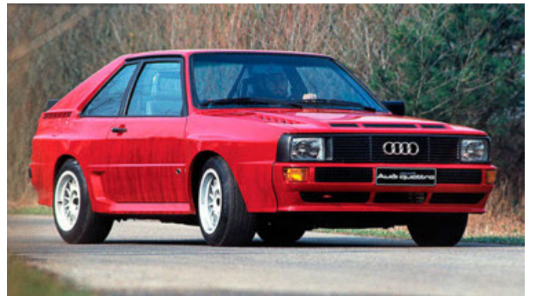
Audi Quattro rallybíllinn var með fimm strokka vél.

1984. Audi dró sig síðan úr rallakstursmótaröðinni árið 1986, en fimm strokka vélin hélt samt velli í kraftabílum Audi, meðal annars í 598 og 720 hestafla útgáfum í sérhæfðum brekkuklifursbílum. Einn af þekktustu bílum Audi með fimm strokka vél, Audi RS2 Avant, kom svo fyrst á markað árið 1994. Frá 1997 til 2009 varð þó tólf ára hlé á smíði fimm strokka véla hjá Audi, en 2009 kynnti Audi TT RS bíllinn með fimm strokka vél sem var 2,5 lítra og 340 hestafla. Audi TT RS er enn með fimm strokka vél, en nú 394 hestafla.