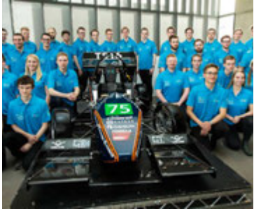
Team Spark liðið.