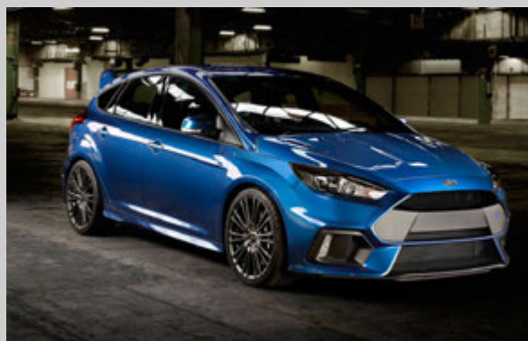
Ford Focus RS.

nálæga bíla, mannlíkama og önnur fyrirbæri. Eyesight sýnir hámarksárangur við hraða upp að 45 km/klst. en þótt hraðinn sé meiri en það sýnir Eyesight samt mjög góðan árangur sem dregið getur úr líkum á ákeyrslu. Auk ADAC hafa fleiri óháðir aðilar framkvæmt margvíslegar prófanir á Eyesight, svo sem bandaríska umferðaröryggisstofnunin IIHS (American Insurance Institute for Highway Safety), sambærilegir aðilar í Japan og víðar. Í öllum tilvikum sýnir sig að ekkert annað kerfi veitir enn sem komið er sambærilega forvörn og Eyesight.