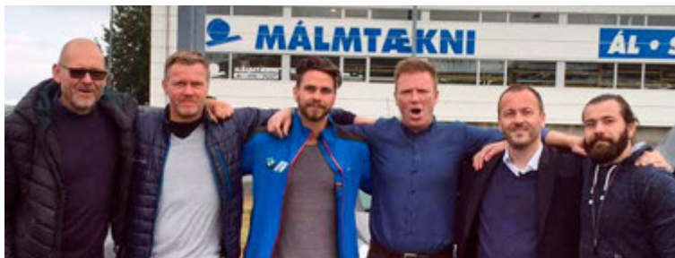
Ökumenn þátttökubíllanna frá BL.

ar nýju ráðningar hjá Borgward benda til þess að fyrirtækið ætli inn á evrópskan bílamarkað. Í apríl síðastliðnum kynnti Borgward BX7 jeppa sinn í Kína og er hann með 2,0 lítra forþjöppudrifna vél. Hann hefur nú þegar selst í 4.000 eintökum í Kína að sögn Borgward og bíða 10.000 pantanir í bílinn afgreiðslu. Borgward hefur hins vegar sagt að hefji fyrirtækið markaðssetningu í Evrópu verði það eingöngu með bíla með tengiltvinnaflrás eða með hreinræktada rafmagnsbíla. Borgward ætlar að kynna minni BX5 jepping í Kína seinna á þessu ári.