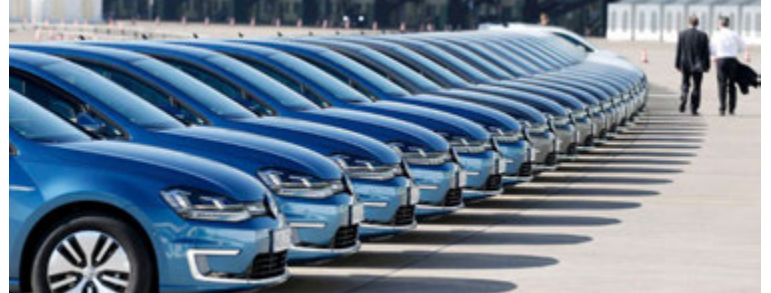
Röð af Volkswagen bílum í Kína.

ley. Það er því flest sem bendir til þess að Volkswagen-bílafjölskyldan muni taka við kyndlinum sem stærsti bílasali heims í Kína af General Motors. Það bar þó svo við að GM var söluhærra en VW í júní svo að slagurinn um efsta sætið gæti orðið spennandi út árið á þessum stærsta bílamarkaði heims.