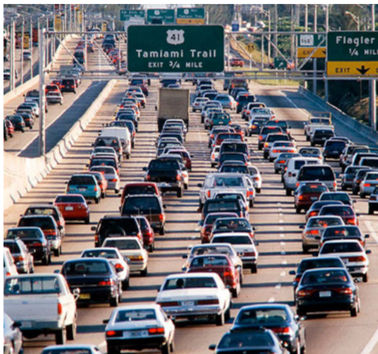
Bílaumferð í Bandaríkjunum.