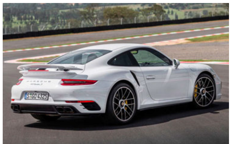
Porsche 911 Turbo S er framleiddur í fleiri eintökum á ári en Tesla áætlað að framleiða af Model S P100D.

Samkvæmt 25 bíla skilgreiningunni má strax taka út Koenigsegg One:1 en hann hefur verið framleiddur í færri eintökum en 25. Bugatti Veyron Super Sport var framleiddur í 30 eintökum. Ef miðað væri við 500 eintök dytti líka McLaren P1 út og ef miðað væri við 1.000 eintök dyttu allir út nema Porsche 911 Turbo. Hann