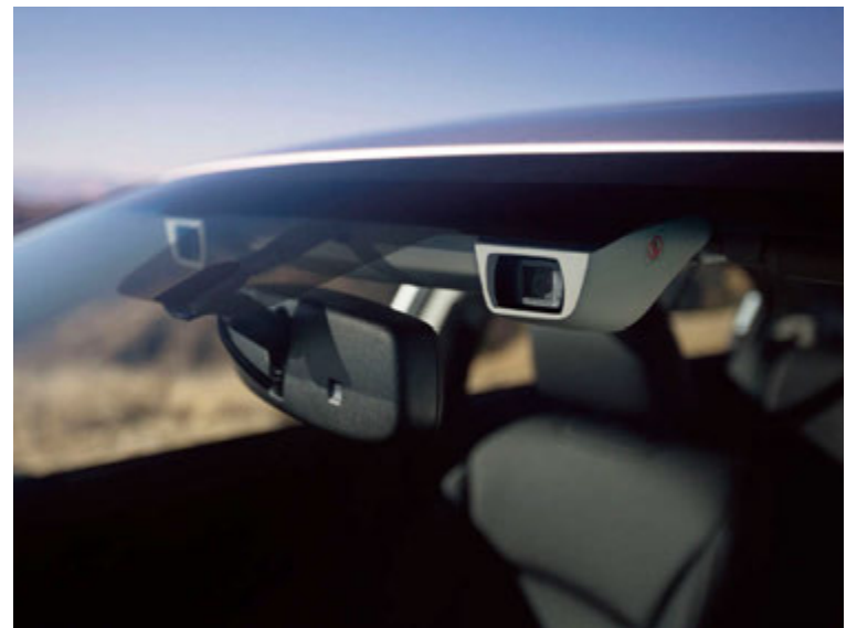
Eyesight öryggisbúnaðurinn byggir á tveimur myndavélum

ADAC prófaði öryggiskerfi sex bíltegunda (e. emergency brake assistance systems), bæði í lúxusbílum og hefðbundnum meðalstórum fjölskyldubílum. Sérstaða Eyesight eru tvær myndavélar (í stað einnar) sem greina þrívíða hluti í umhverfinu og senda upplýsingar til tölvu bílsins sem vinnur úr gögnunum og gefur hemlakkerfi bílsins fyrirhæli í samræmi við aðstæðjandi hættu í hverju tilviki. Eyesight fékk fullt hús stiga í öllum þremur aðalflokkunum sem tilraunirnar tóku til og býr ekkert kerfi enn sem komið er yfir sömu getu og Eyesight. Það kom t.d. í ljós í prófunum ADAC að þótt tilraunirnar væru gerðar á dökkklæddum vegfarendum, eða að nóttu til þar sem engin götuljós voru til staðar, gat Eyesight brugðist við á jafn árang-