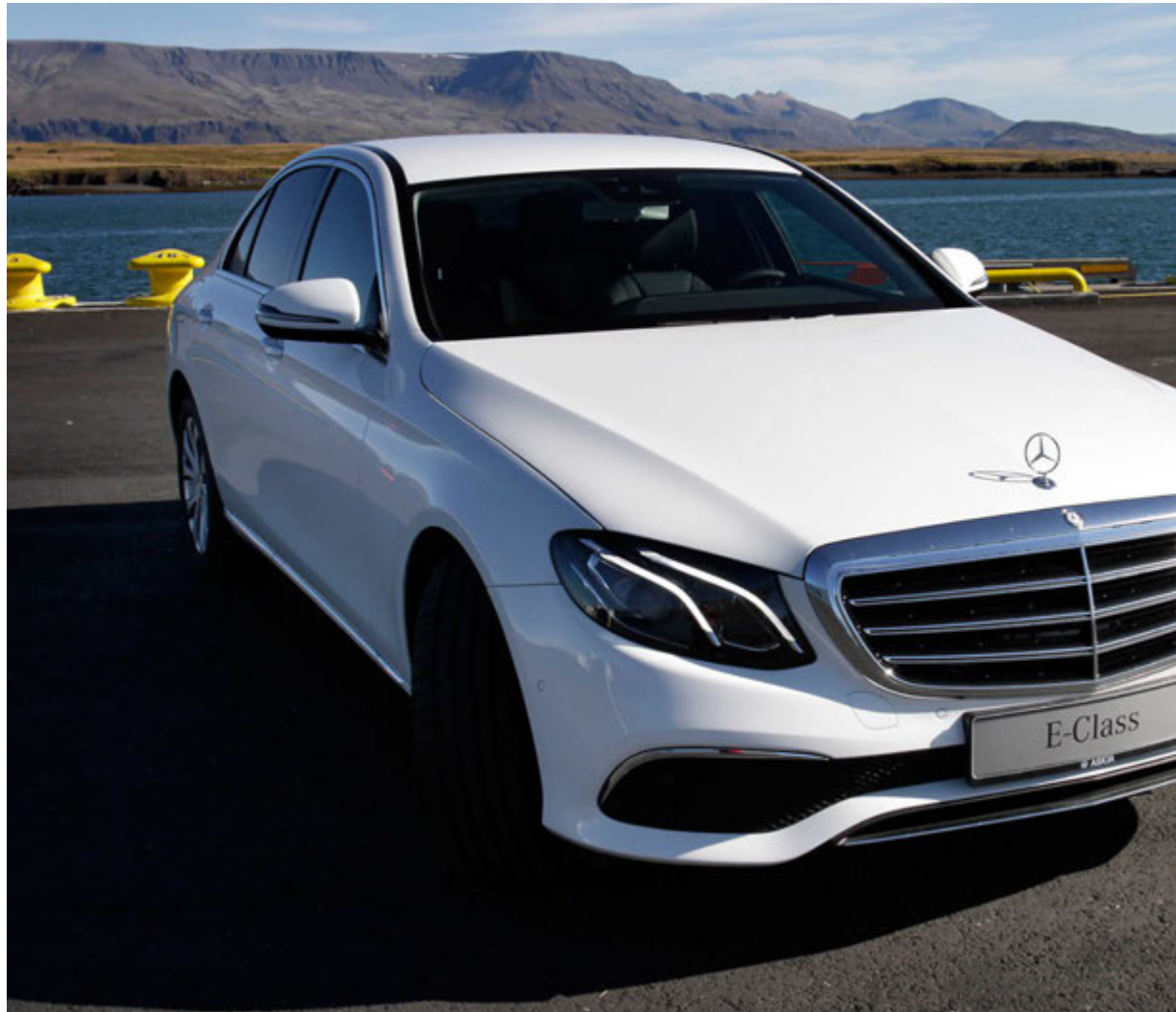
Mercedes Benz E-Class.

Í flokki jepplinga komast áfram Honda HRV, Kia Sportage og VW Tiguan. Í flokki jeppa komast áfram Audi Q7 E-Tron, BMW X5 Pug-in Hybrid og Lexus RX450h. Loks er flokkur pallbíla í fyrsta skipti en þar komast áfram Mitsubishi L200, Nissan Navara og Toyota Hilux. Bandalag íslenskra bílblaðamanna hefur opnað nýja heimasíðu í til efni valsins nú, billarsins.is og þar má sjá myndir af öllum þeim bílum sem nú koma til greina sem bíll ársins.