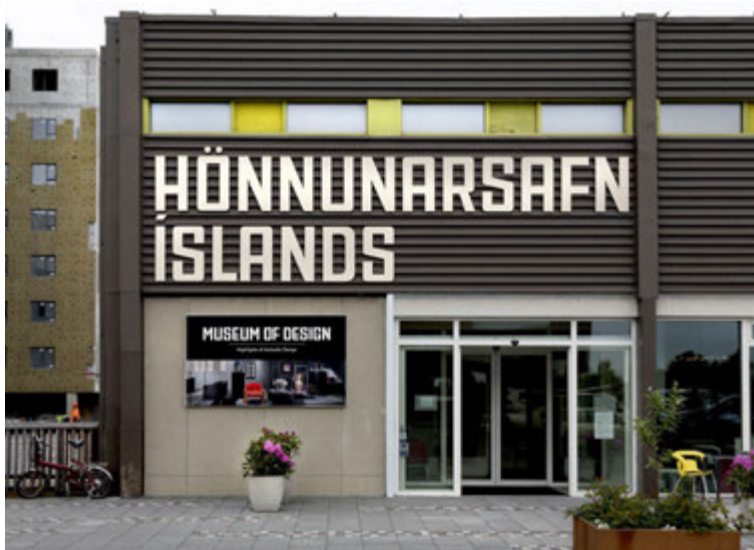
Hönnunarsafn Íslands í Garðabæ varðveitir íslenska hönnun.

Á strandstígnum meðfram höfninni í Hafnarfirði eru settar upp ljósmyndasýningar er varpa ljósi á dagleg störf og sögu fólksins sem bæinn byggði.