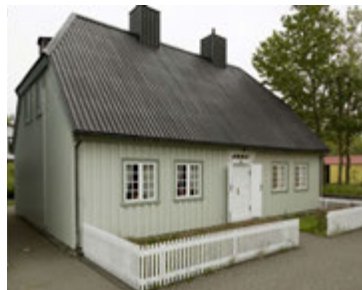
Sívertsen-hús þar sem sýnt er hvernig yfirstéttarfjölskylda í Hafnarfirði bjó.

Krókur á Garðaholti er lítill bárujárnsklæddur burstabær sem var endurbyggður úr torfbæ árið 1923. Bærinn er í dag með þremur burstum en árið 1923 var mið-