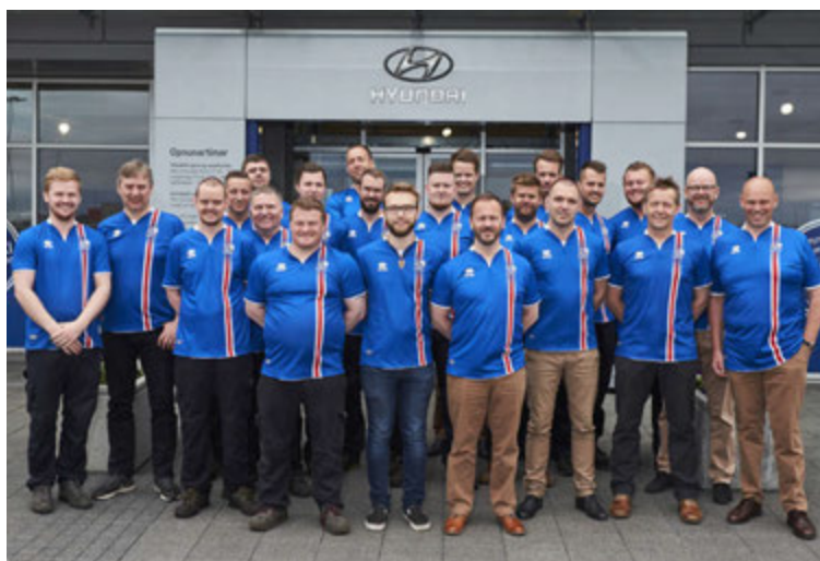
Samheldinn hópur starfsmanna Hyundai í landsliðstreyjum en þar á bæ er einhugur um álit á íslenska karlalandsliðinu í knattspyrnu.