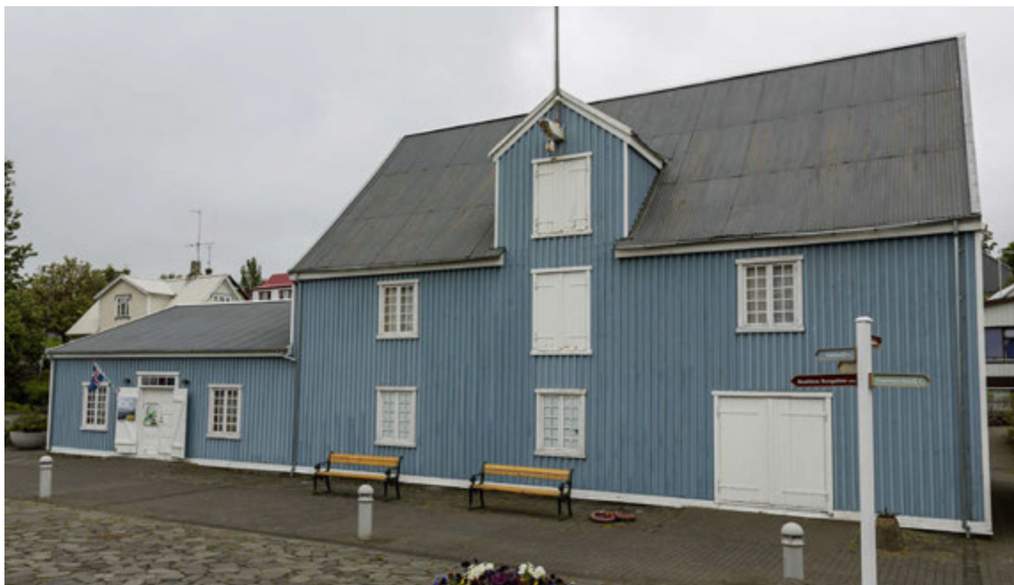
Í Pakkhúsinu í Hafnarfirði eru nokkrar áhugaverðar sýningar í gangi.

Siggubær er varðveittur sem sýnishorn af heimili verkamanns og sjómanns í Hafnarfirði á fyrri hluta 20. aldar.