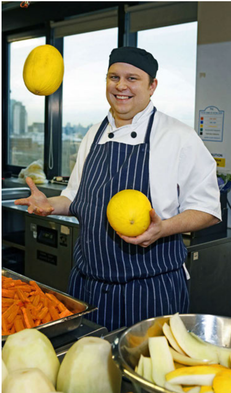
Starfsfólk ISS framreiðir hundrað þúsund hádegisverði í hverjum mánuði til fyrirtækja og stofnana á höfuðborgarsvæðinu ásamt því að sjá um veislur og aðrar veitingar.