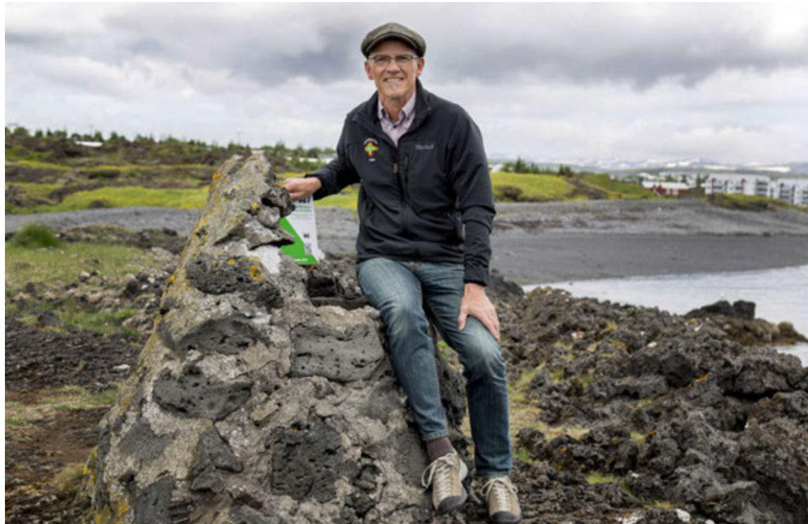
Guðni við einn af 27 áfangastöðum ratleiksins í ár.

eyktamark var fastur punktur í landslagi sem var notaður sem viðmið við sólargang til að vita hvað tímanum leið.