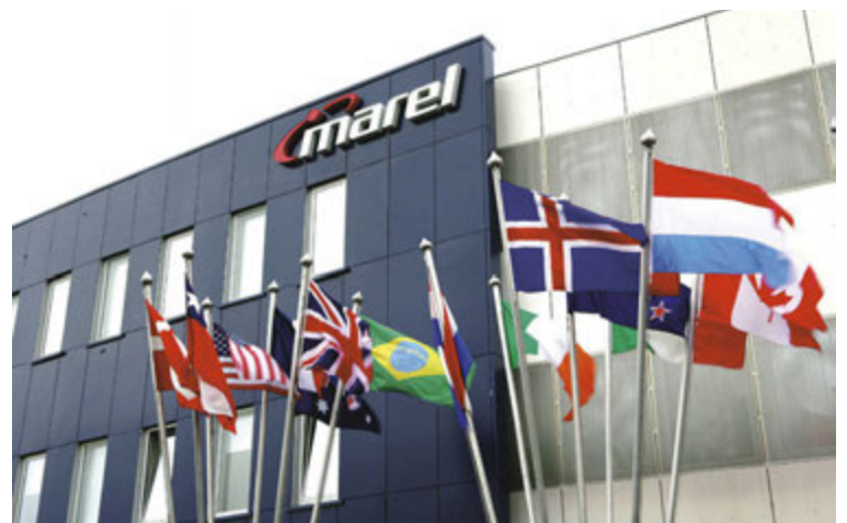
Marel selur hugbúnaðarlausnir til margra landa víða um heiminn.

Hjá Marel er manni boðið upp á að fást við skemmtileg verkefni og skipulagið í kringum þau er gott. Víðtæka þekkingu er að finna í hverju horni og stöðugt er ýtt undir að starfsfólk sækir sér meiri þekkingu og miðli henni að sama skapi til samstarfsfélaga sinna. Ekki skemmir fyrir að hér er bráðgott mótuneyti, aðstaða til íþróttaiðkunar er til fyrirmyndar og boðið er upp á margs konar félagstarf fyrir starfsmenn og aðstandendur þeirra.“