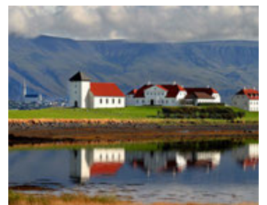
Bessastaðir baðaðir sól.