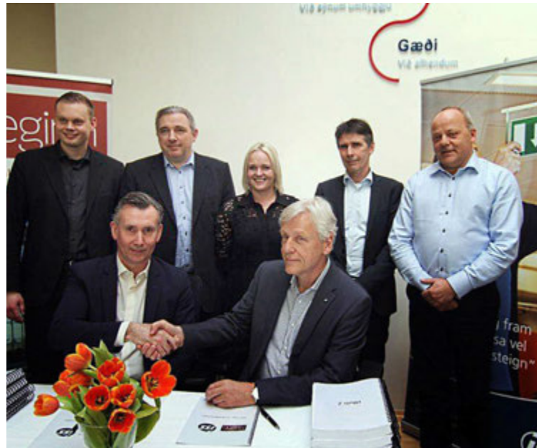
Í apríl síðastliðnum gerðu ISS og Reginn samning um yfirtöku á meginhluta þeirra rekstrarþátta sem Fasteignaumsýsla Regins hefur sinnt.

tíðina, mikil hreyfing er á markaðnum og hann er að breytast í takt við þróun og vöxt fyrirtækja og stofnana. Úthýsingarmarkaðurinn er að breytast, stjórnendur fyrirtækja horfa í síauknum mæli á lausnir, árangur og útkomu frekar en tímagjald eða eininga-verð, svokallaða „out-put based“