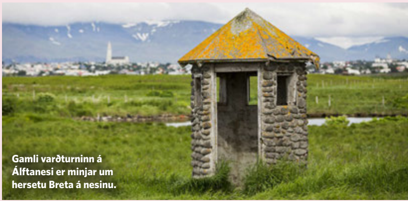
Gamli varðturninn á Álftanesi er minjar um hersetu Breta á nesinu.