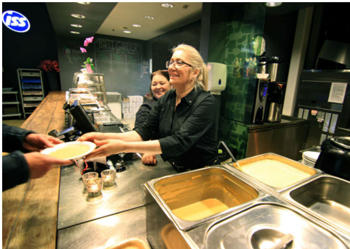
Hádegisverðarþjónusta ISS hefur verið í miklum vexti undanfarin ár.