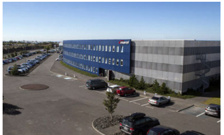
Marel er með höfuðstöðvar að Austurhrauni 9 í Gardabæ.