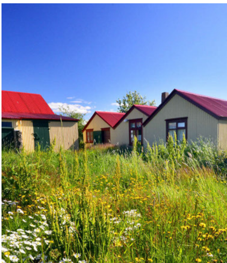
Krókur á Garðaholti.