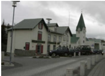
Strandgatan í Hafnarfirði.

Leyndar perlu? Hellisgerði og Heiðmörk. Svo verð ég að nefna Keili. Ég er ekki golfari en það er æðislegt að fara þangað þegar veðrið er gott og fá sér japanskt kjúklingasalat með útsýni yfir hafið, það er eins og að fara til útlanda í hádeginu.