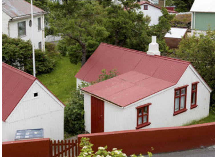
Siggubær er krúttlegur bær í miðbæ Hafnarfjarðar.