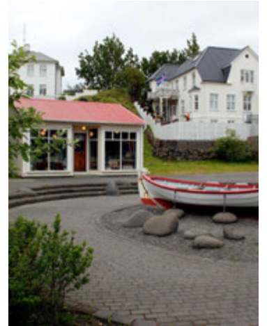
Í Beggubúð er verslunarminjasafn Byggðasafns Hafnarfjarðar.

ef til árásar á hann kæmi og þar fóru fram skotæfingar. Í dag er varðturninn skemmtilegur viðkomustaður á hjólaleið eða gönguferð um nesið. Til að komast þangað er best að fara Norðurnesveg og síðan Jörfaveg eins langt og hægt er þar til komið er að húsi sem stendur eitt og sér. Þá er beygt inn malarveg og þar blasir turninn við.