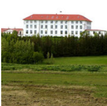
Ein af skemmtilegri minningum Andreu frá Garðabæ er þegar hljómsveitin Of Monsters and Men hélt tónleika við Vífilsstaði í Garðabæ og 25.000 manns mættu.