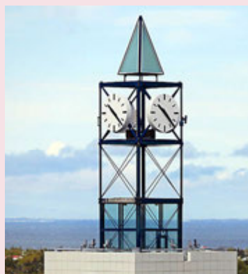
Hér má sjá ráðhústurn Garðabæjar sem var fyrirmyndin að afmælismerkinu.