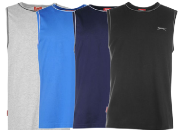
SLAZENGER HERRA HLÝRABOLUR