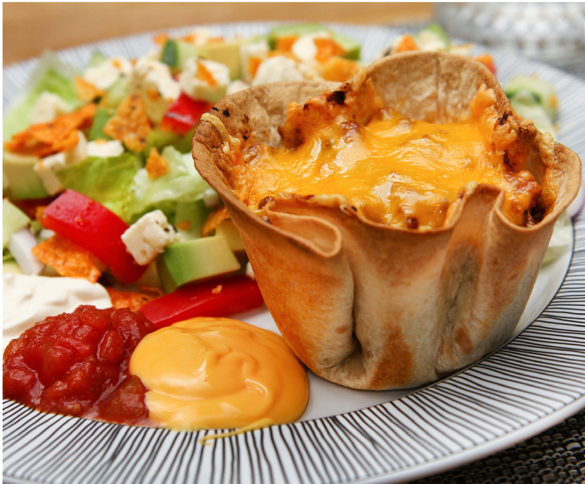
Fullkominn partíréttur fyrir kvöldið. Berið fram með góðu salati, nachos og sýrðum rjóma, guacamole og salsa-sósu.