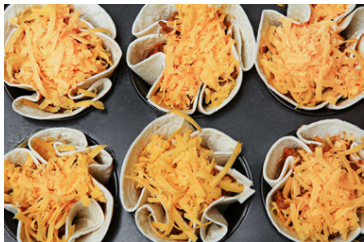
Þegar fyllingin er komin í kökurnar fara þær inn í 200°C heitan ofn í 10-15 mínútur, eða þar til osturinn er bráðnaður.