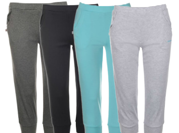
LA GEAR DÖMU KVARTBUXUR