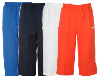
SLAZENGER BARNNA KVARTBUXUR