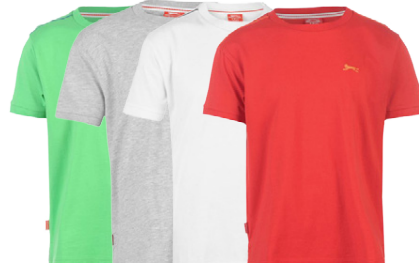
SLAZENGER BARNNA STUTTERMABOLUR