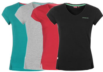
LA GEAR DÖMU STUTTERMABOLUR