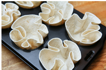
Sniðugt er að nota bollakökuform undir tortillakökurnar og spreya það að innan með olíu.

Steikið nautahakkið á pönnu, kryddið með taco-kryddi og hellið um 1 dl af köldu vatni yfir. Látið sjóða saman í nokkrar mínútur á pönnunni. Hrærið taco-sósu og refried beans saman við og setjið til hliðar. Spreyið olíu (ég nota PAM) í möffinsform og setjið tortillakökur í þau (það er allt í lagi þó þær standi upp úr), fyllið þær með nautahakksblöndunni og stráðið rifnum cheddarosti yfir. Setjið í 200°C heitan ofn í 10-15 mínútur, eða þar til osturinn er bráðnaður. www.ljufmeti.com