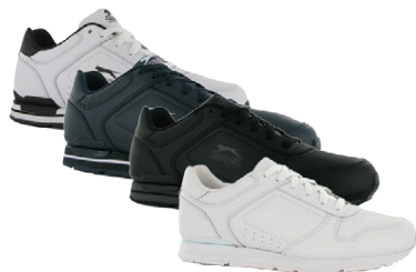
SLAZENGER CLASSIC HERRA SKÓR