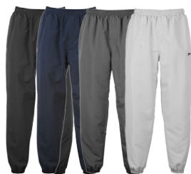
SLAZENGER HERRA BUXUR