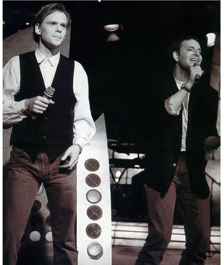
Frá undankeppninni 1991 þar sem Draumur um Nínu stóð uppi sem sigurvegari.