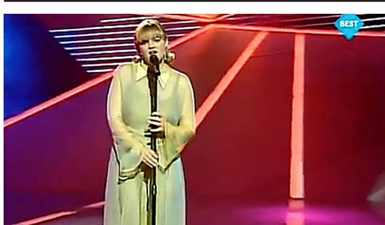
Kjöll Barböru þótti með því versta sem sést hafði í sögu Eurovision.

Lágmúla 9 • 108 Reykjavík • Sími 581 3730 • jsb@jsb.is • www.jsb.is