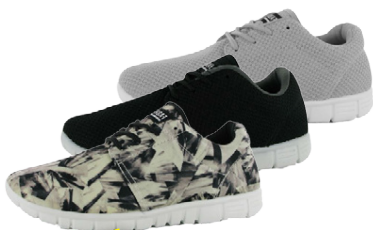
FABRIC MERCY DÖMU SKÓR