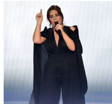
2015 Trijntje Oosterhuis - Holland