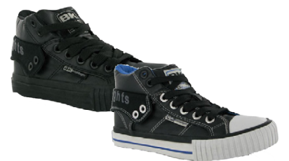
BRITISH KNIGHTS BARNNA SKÓR

EINNIG FÁANLEGT Í FLEIRI GERÐUM OG STÆRDUM