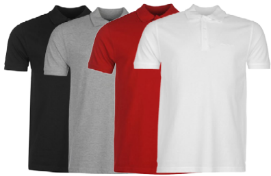
PIERRE CARDIN HERRA POLO BOLUR