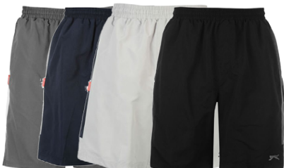
SLAZENGER HERRA STUTTBUXUR