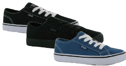
SOULCAL BARNNA SKÓR