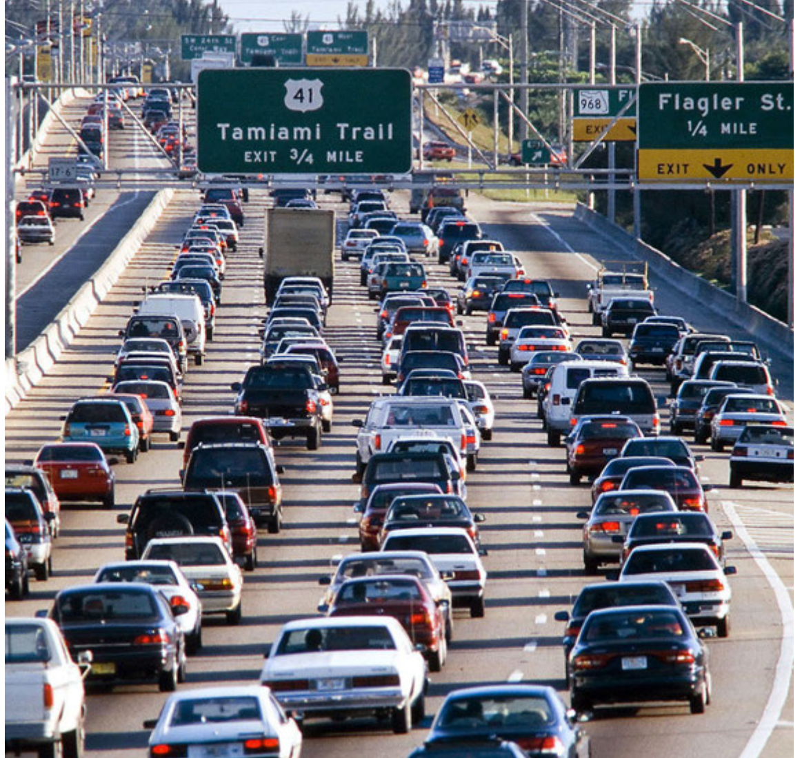
Þung umferð er víða á bandarískum vegum.

Sá þróunarkostnaður sem nú þegar hefur verið settur í vélinni í Golf R400 fer þó ekki til einskis þar sem fyrirhugað er að setja hana í Audi bíl eða bíla. Volkswagen ætlar hins vegar að huga að smíði næstu kynslóðar Golf R sem er nú 300 hestafla kraftagerð þessa vinsæla bíls.