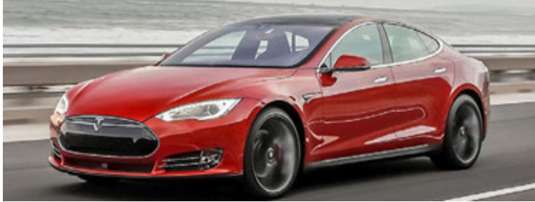
Tesla Model S