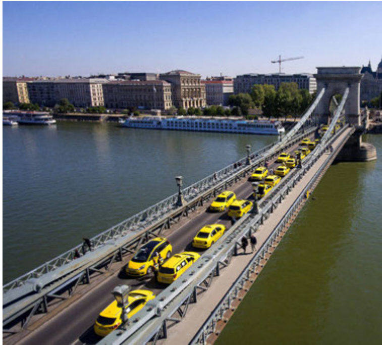
Brúin algerlega teppt með leigubílum.