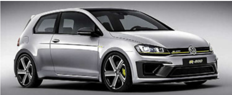
Volkswagen Golf R400

unnar komi frá brennslu náttúrulegs gass. Í Hong Kong eru nú um 4.000 rafmagnsbílar í umferðinni og hafa eigendur þeirra notið endurgreiðslu frá ríkinu við kaup á þeim. Það hefur því engu skilið til að minnka mengun í landinu, en hefur kostað ríkissjóð þar nærri 24 milljarða króna. Þrátt fyrir að ástandið í Hong Kong hvað varðar notkun kola til rafmagnsframleiðslu sé slæmt, er það enn þá verra í Kína, en þar koma 60 prósent af rafmagn frá brennslu kola með tilheyrandi mengun. Því má segja að það sé ekki til neins að nota rafmagnsbíla í landinu þó svo að margir bílaframleiðendur þar leggi mikla áherslu á framleiðslu þeirra. Því ættu þeir allir að vera seldir til landa þar sem rafmagnsframleiðsla fer fram með umhverfisvænum hætti. Svo er þó ekki.