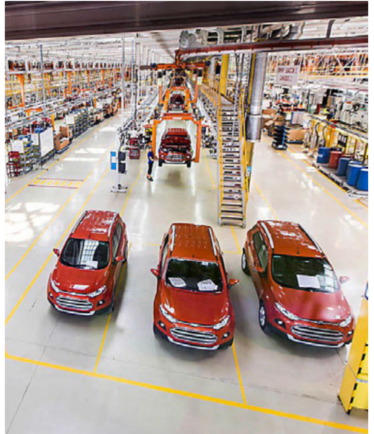
Úr verksmiðju Ford í Rússlandi.

Ford á ekki von á því að ársaukningin verði eins mikil og á fyrsta ársfjórðungi, en að vöxturinn verði samt góður. Reyndar er enn búið við að bílamarkaðurinn minnki í Rússlandi, áður en hann fer að færast aftur til fyrra horfs, en áður en núverandi hrun hófst var Rússland næststærsti markaðurinn fyrir bíla í Evrópu, á eftir Þýskalandi. Í ár er því spáð að 1,53 milljónir nýrra bíla seljist í Rússlandi og að minnkun ársins verði um 5 prósent frá síðasta ári.