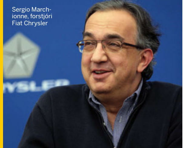
Sergio Marchionne, forstjóri Fiat Chrysler

árið 2018 er allsendis óvíst, en hann segir að verði það seinna sé það höfuðverkur arftaka hans. Sameining verði ekki umflúin. Hann telur að dyrnar hafi aldrei lokast fyrir sameiningu og áfram verði haldið með tilraunir til þess. Marchionne hefur reyndar nefnt einn bílframleiðanda enn, þ.e. kóreska bílframleiðandann Hyundai sem einnig á Kia, en að sú sameining sé ólíklegust þar sem kóreskir framleiðendur séu almennt ekki tilbúnir til neinnar sameiningar við aðra framleiðendur.