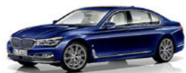
BMW M760i verður glæsilegur bíll.

Renault, ásamt fjölmörgum íhlutaframleiðendum, ætlar að fjárfesta fyrir 129 milljarða króna í Marokkó og reisa einskonar „iðnaðarmiðstöð“ þar sem framleiddir verða íhlutir í Renault- og Dacia-bíla. Renault á tvær bílaverksmiðjur í Marokkó, þ.e. í Tangier og Casablanca. Verksmiðjan í Tangier er stærsta bílaverksmiðja í N-Afríku og eftir að hún verður stækkuð og iðnaðarmiðstöðin verður tilbúin munu verða framleiddir 400.000 bílar á ári í henni. Í þeim báðum eru nú framleiddir Dacia-bílar, Dokker, Lodgy og Sandero í Tangier og Logan og Sandero í Casablanca. Að minnsta kosti fimm-tán íhlutaframleiðendur ætla að taka þátt í uppbyggingu iðnaðarmiðstöðvarinnar og leggja til hennar fjármagn. Bílaiðnaður er mjög vaxandi í Marokkó og PSA/Peugeot-Citroën ætlar að byggja þar nýja bílaverksmiðju sem kosta mun 79 milljarða króna og þar á að framleiða 200.000 bíla á ári. Það eru ekki bara bílframleiðendur sem þyrpst hafa til Marokkó á síðustu árum heldur er franskur flugvélaframleiðandinn Bombardier þar á meðal.