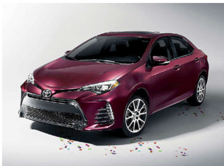
Ellefta kynslóð Toyota Corolla.