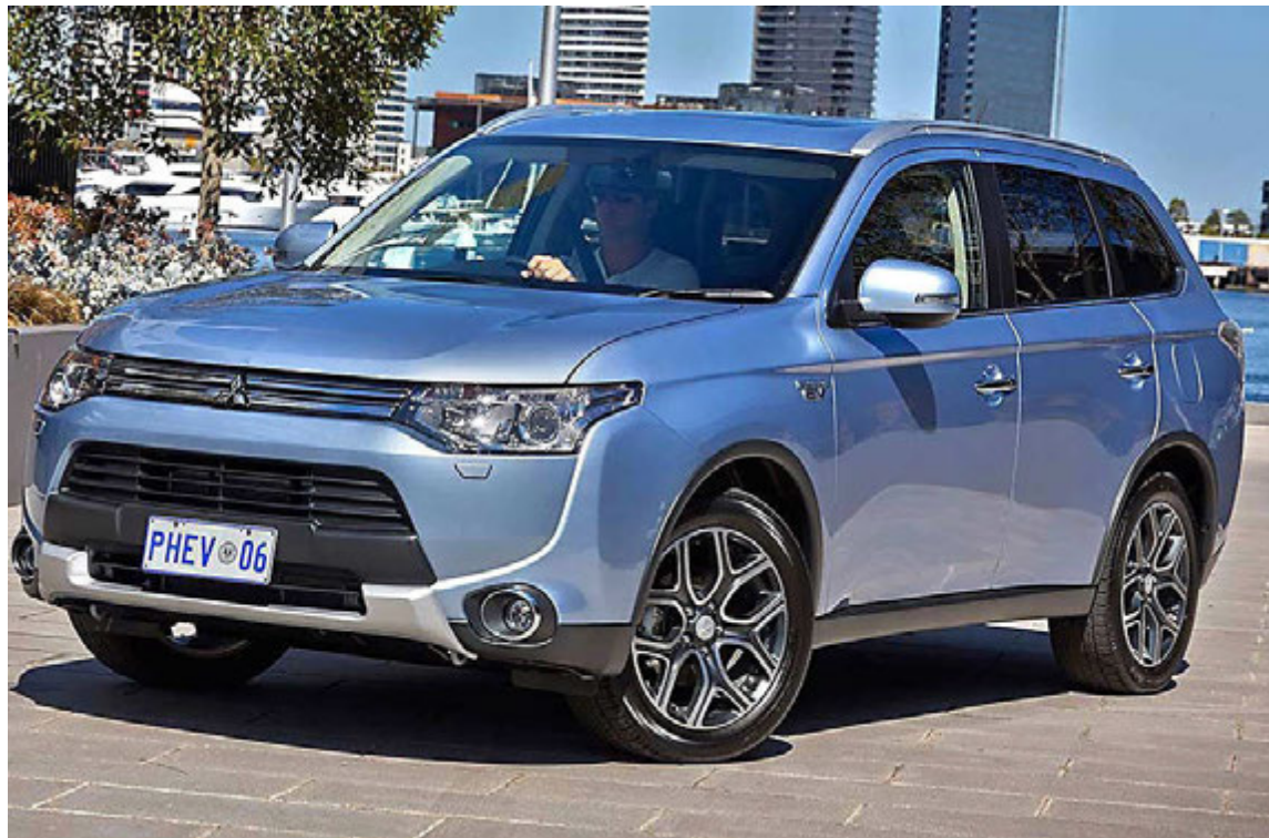
Mitsubishui Outlander PHEV.