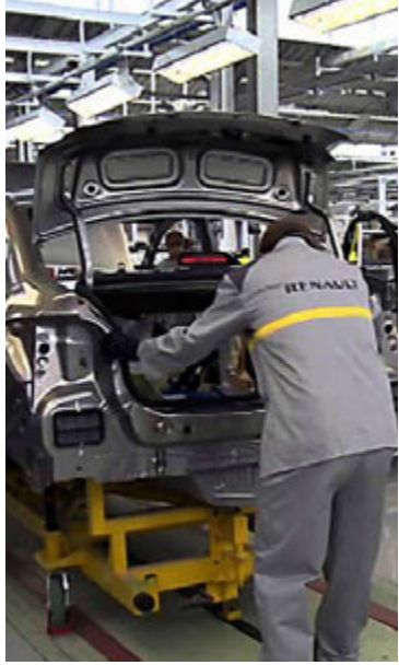
Úr verksmiðju Renault í Tangier.