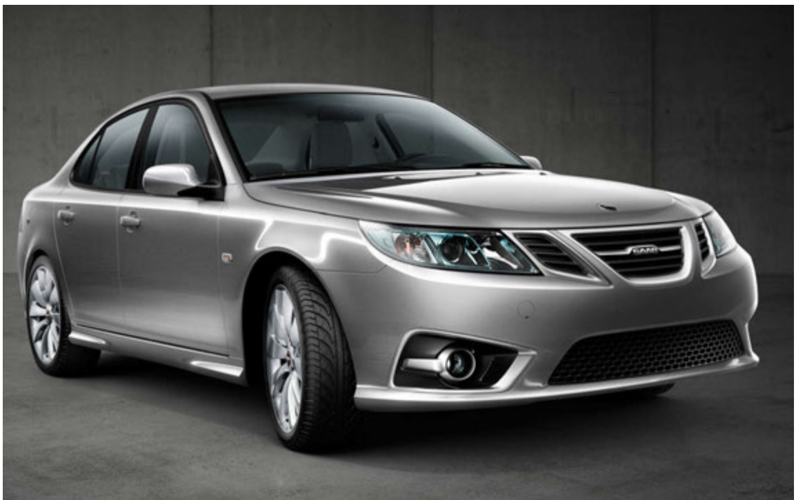
Saab 9-3 Aero.

sú minnsta af tíu verksmiðjum Volkswagen í Þýskalandi og þar vinna um 500 manns. Þeir þurfa ekki að hafa áhyggjur af atvinnumissi þar sem þeim býðst öllum að vinna áfram í verksmiðju Volkswagen í Zwickau, sem einnig er í gamla A-Þýskalandi, en þar eru Golf- og Passat-bílar framleiddir. Þó að verksmiðjunni í Dresden verði lokað verður það bara tímabundið og henni mun verða breytt til þess að framleiða aðrar gerðir Volkswagen-bíla eða annarra undirmerkja Volkswagen. Það mun taka um eitt ár. Búið var að kynna nýja kynslóð Phaeton, en nú hefur verið tekin ákvörðun um að kynna ekki þann bíl, en líklegt þykir þó að hann muni aftur líta dagsljósið sem rafmagnsbíll árið 2019 eða 2020.