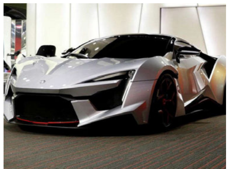
Fenyr SuperSport er engin venjuleg kerra.