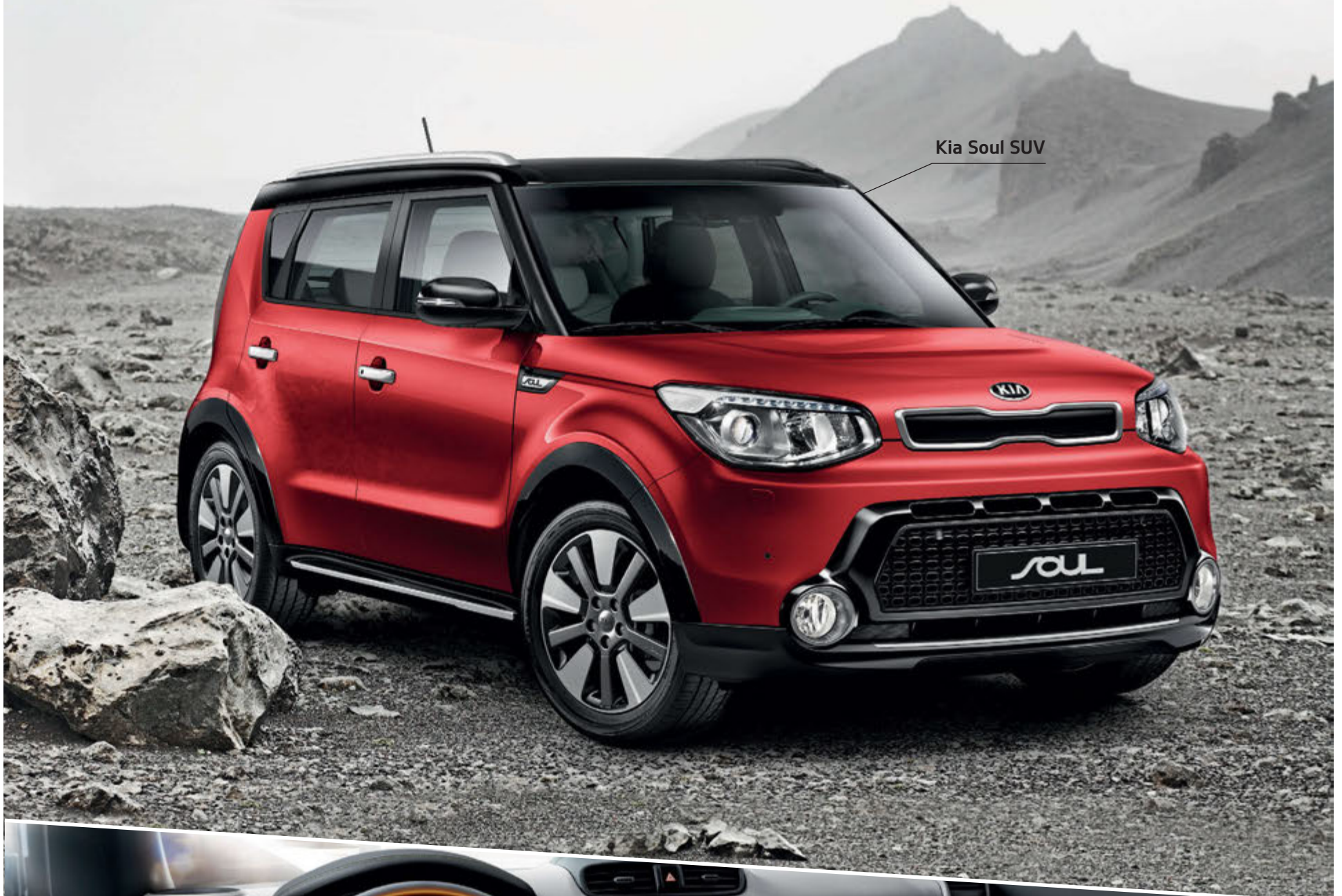
Kia Soul SUV