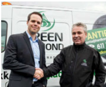
Fulltrúar váttryggingafélagsins Varðar og Harðkornadekkja ehf., umboðsaðila Green Diamond, handsala samninginn.

Hvað er til ráða? Eru góðir vetrarhjólbarda of dýrir? Ættu hagsmunaaðilar eins og váttryggingafélögin ekki að skoða