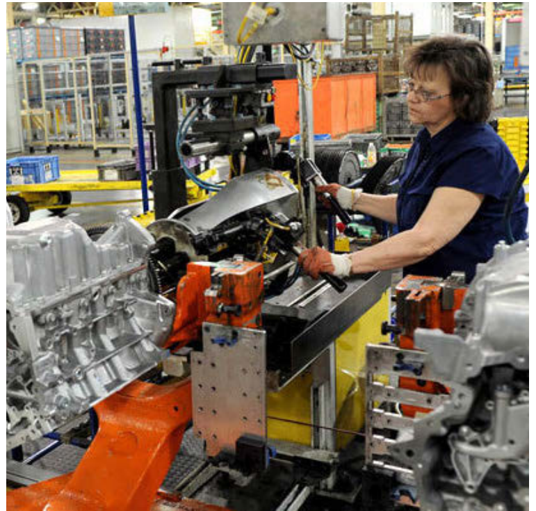
Vélasmiði í bandarískri verksmiðju.

GM, Fiat-Chrysler og Ford smíða um 20 milljónir véla og skiptinga í ár. Um 90% þeirra eru meira og minna sams konar vélar, sem þýðir að þeir eru hver í sínu horni að gera sama hlutinn og þróa nýjar vélar af sömu gerð og hinir með ærnum þróunarkostnaði. Ef þessir þrjár aðilar sameinuðust um þróun og smíði þessara tuttugu milljóna véla og skiptinga myndi