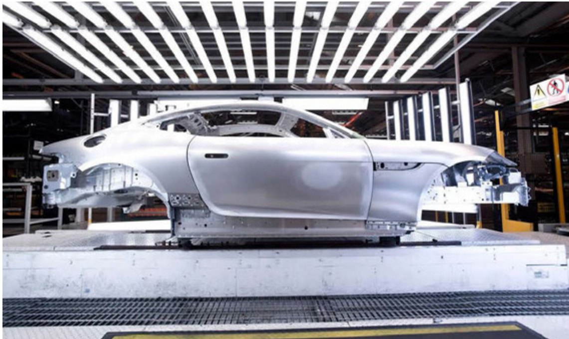
Úr smiðju Jaguar.

Þessi bíll á að vera jafn fær um að aka um hefðbundna vegi og keppnisbrautir og á að vera þægilegur í umgengni og fara vel með farþega. Hann verður sannkallaður lúxusbíll sem mikið er lagt í, enda mun hann kosta langleiðina í 300.000 dollara, eða 39 milljónir króna. Bíllinn verður smíðaður í Michigan í Bandaríkjunum og framleiðsla hefst í apríl á næsta ári. Aðeins 50 eintök verða smíðuð af þessum bíl.