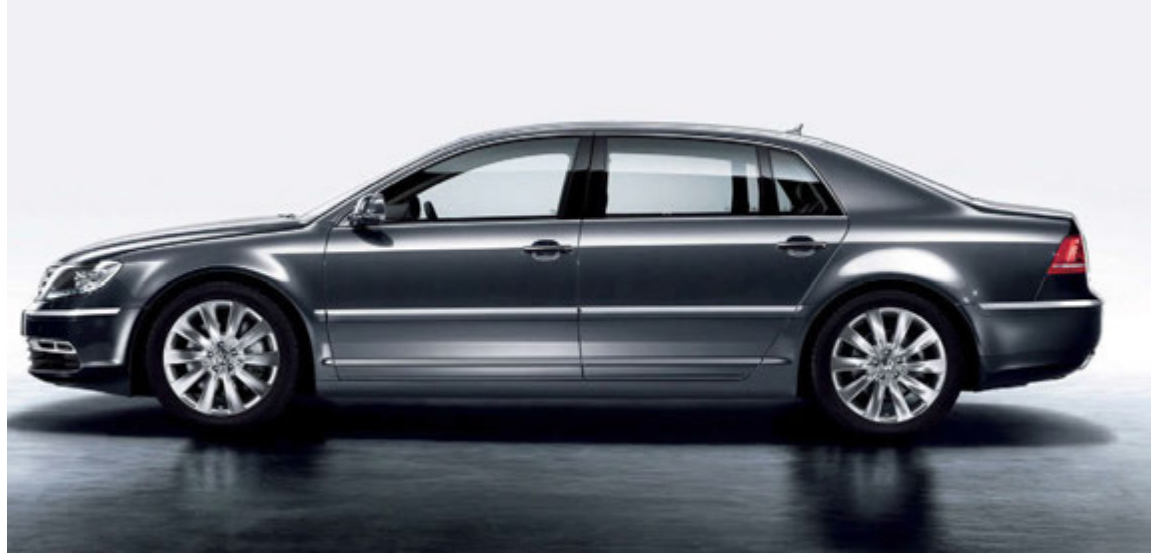
Volkswagen Phaeton er á stærð við Audi A8.

nýjan bíl frá grunni. Til stendur að kynna þennan áhugaverða bræðing næsta haust. Audi RS6 Allroad er helst hugsaður fyrir Kínamarkað, en hann verður einnig seldur á öðrum mörkuðum. Búist er við því að í þessum nýja bíl verði sama vélin og í RS6, þ.e. 4,0 lítra V8 og 560 hestafli vélin sem einnig má finna í Audi RS7. Þar sem von er á nýrri kynslóð A6 bílsins árið 2017 verður þessi bíll ekki lengi á markaði í fyrstu útgáfu, en ef til vill verður hann áfram í boði með næstu kynslóð. Búist er við því að Audi RS6 Allroad verði eitthvað dýrari en Audi RS6.