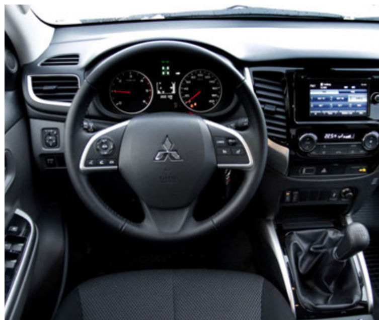
Hin laglegasta innrétting í L200.

Yfir það heila verður að segjast að nýr Mitsubishi L200 hafi vakið undrun fyrir gæði, aksturs- og drifgetu, fágun, búnað, flutnings- og toggetu og alls ekki síst útlit. Þar tekur hann öðrum pallbílnum í