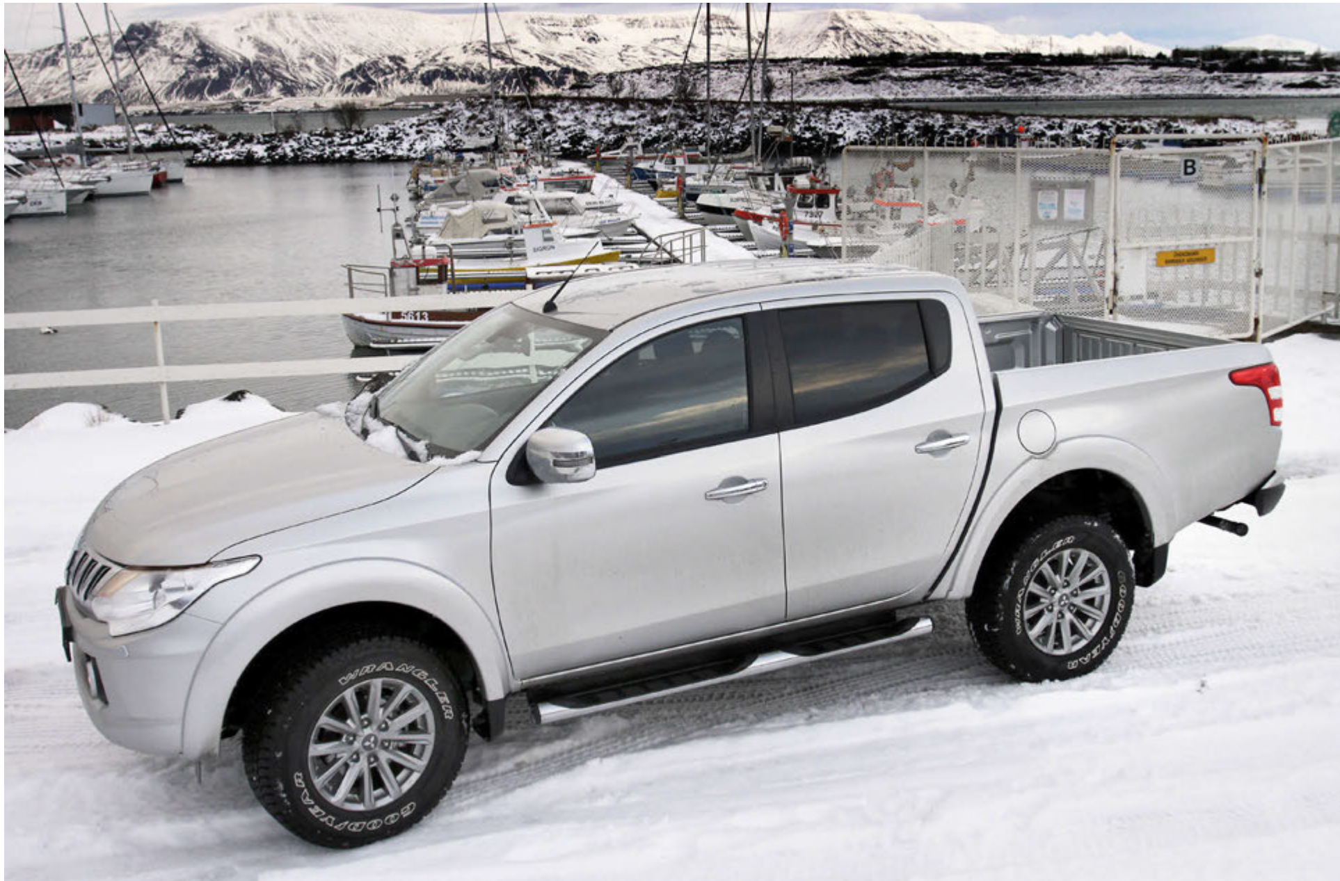
Mitsubishi L200 pallbíllinn.