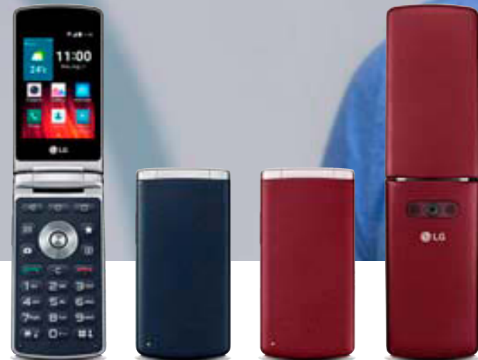
Búið er að draga fram klassíska símaútlitið sem margir þekkja.