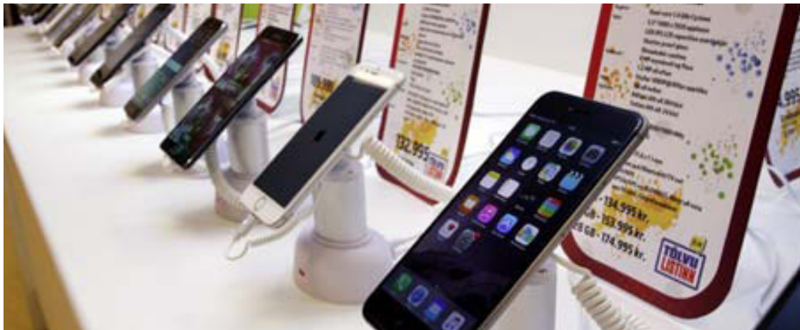
Tölvulistinn er með 38 gerðir af farsímum fyrir jólin frá Apple, Samsung, LG og HTC á lægra verði. Sama verð er í öllum 7 verslunum Tölvulistans um landið.