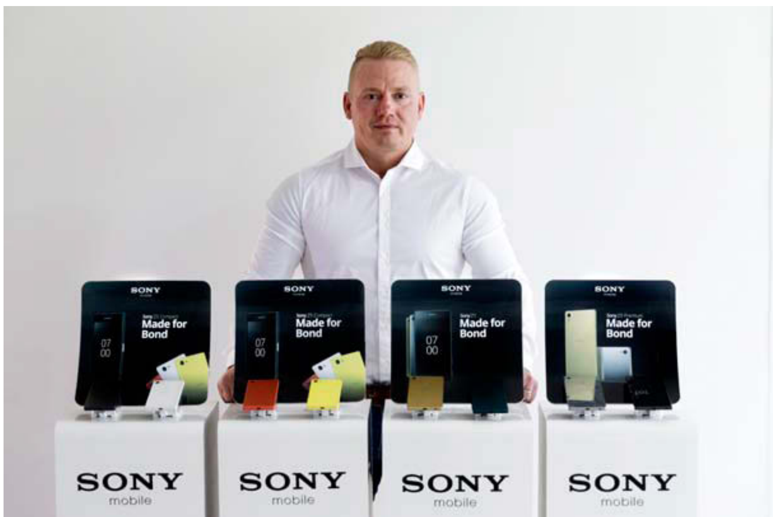
Í nýju glæsilegu Z5 línunni frá Sony eru þrjú snjallsímar sem eru í grunninn samí síminn en í þremur mismunandi stærðum.

Miðjutækið er Sony Z5 síminn sem kemur í 5,2" skjá-stærð. „Sá sími er örliðið stærri en fellur vel í lófann. Smáir fingur finna mögulega fyrir því að aðgerðir með annarri hendi verða flóknari og oftar en ekki er betra að nota báðar