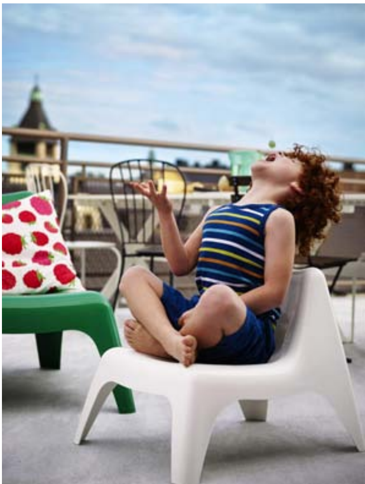
BUNSÖ plaststólarnir eru skemmtileg barnaútgáfa af litríku IKEA PS VAGÖ stólunum sem henta hvort sem er inni eða úti.