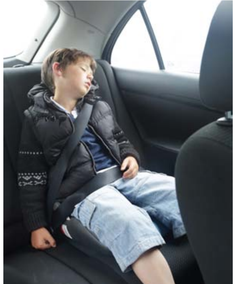
Börn á aldrinum tveggja til tólf ára virðast vera viðkvæmur hópur í bíl. Reyna má að miða ferðalögin við þann tíma sem barnið sefur.