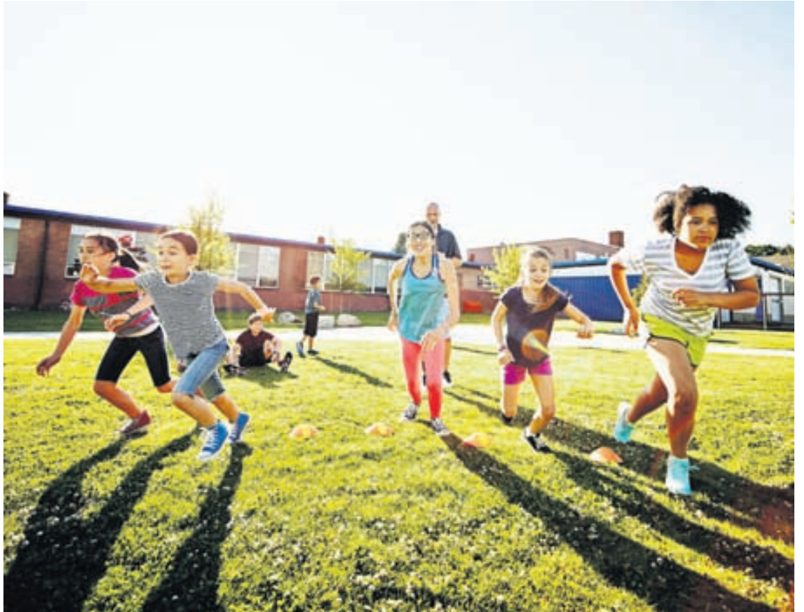
Börn hafa afskaplega gaman af því að vera úti, hlaupa um og fara í leiki.