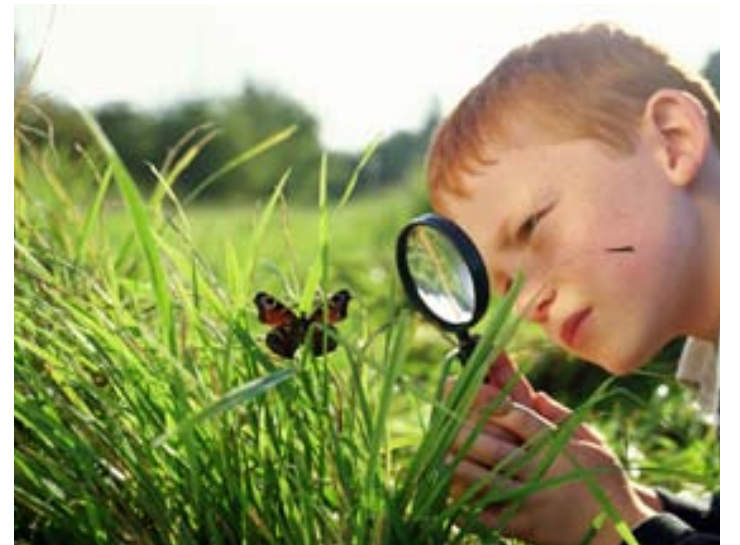
Lagt verður af stað frá gömlu rafstöðinni við Elliðaár fimmtudaginn 11. júní klukkan 19.

Útsölustaðir: Apótekarinn, Lifandi markaður, Lyfjaval og Heimkaup.is.