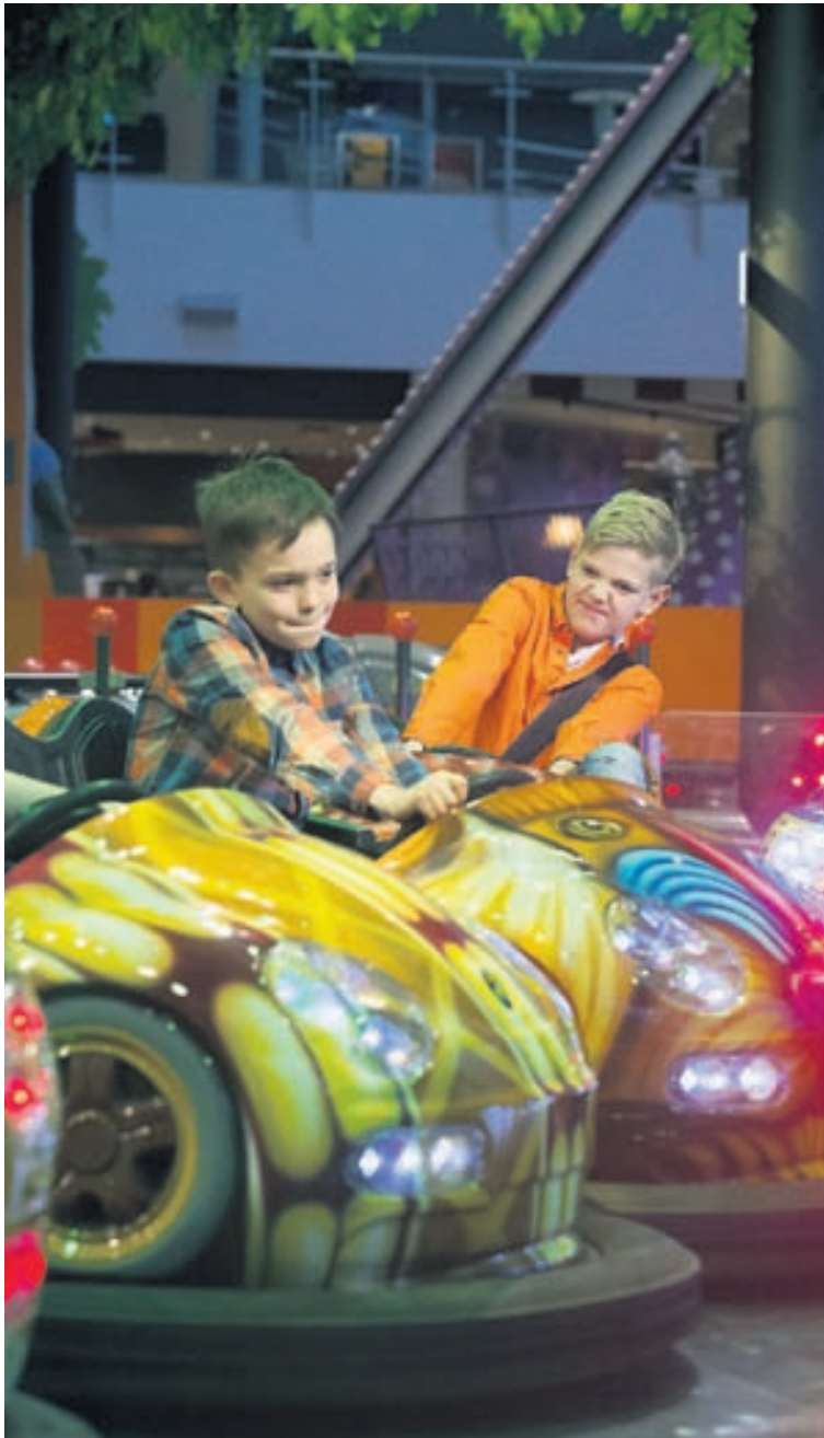
Klessubílnir eru sívinsælir.