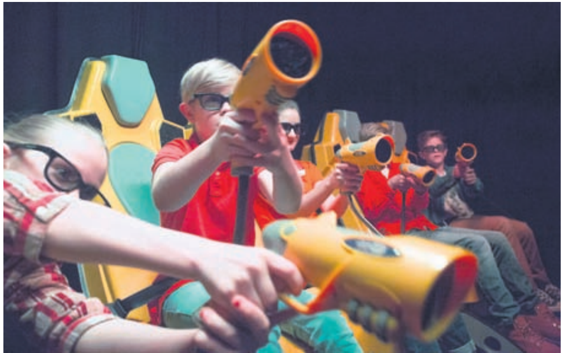
Í 7D-bíóinu er alltaf fjör.