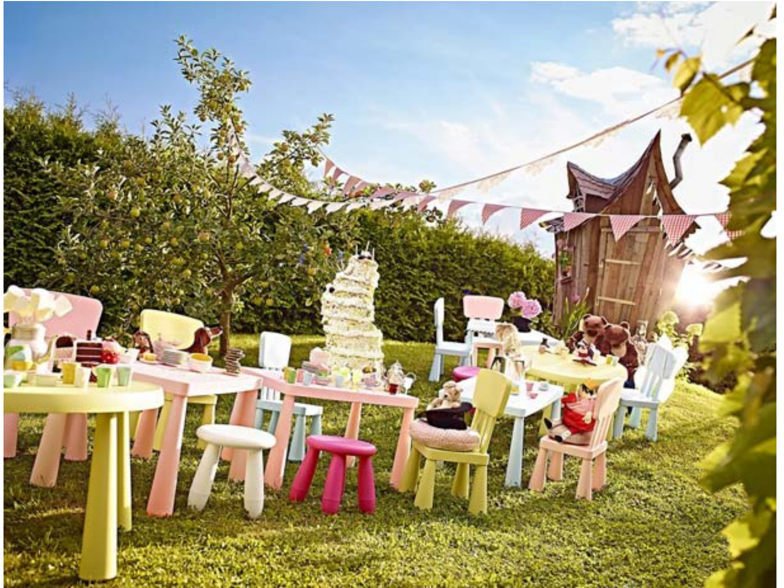
MAMMUT línan frá IKEA þolir notkun utandyra.

Auður segir samverustundir fjölskyldunnar á sumrin einkennast af annars vegar leik og hins vegar tilefnum til að njóta saman veitinga, hvort sem það er smurt nesti í lautarferðina eða stórveisla. „KALAS barnaborðbúnaðurinn er auðvitað ofboðslega vinsæll, og ég held að sú barnafjölskylda sé vandfundin sem ekki hefur haft KALAS á borðum. Svo er líka litríkur og skemmtilegur borðbúnaður í sumarlinunni sem ætti að falla í kramið hjá yngstu kynslóðinni; skálar, diskar, glös, sogrör og servíettur.“ Það ætti því að vera auðsótt mál að henda upp sumarlegri veislu hvar og hvenær sem er.