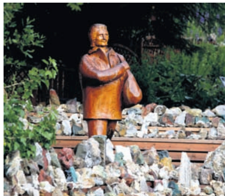
Heimsókn í Steinasafn Petru á Stöðvarfirði er mikil upplifun.