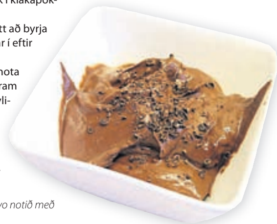
Súkkulaðimúsinn er gómsæt og girnileg og er tilvalinn eftirréttur á helgarkvöldi.

glös og þau sett í frysti. Eftir um það bil korter er íspinnaprikum stungið ofan í glösin. Leyfið svo ísnum að frjósa.