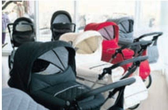
Roan-barnavagnarnir eru vandaðir og fallegir. Vinsælasti vagninn í Barninu Okkar heitir Kortina og samanstendur af vagn- og kerrustykki og skiptitösku og kostar aðeins 99.900 krónur.

Kynningarblað Leikir, uppskriftir, söfn, leikföng og skemmtun.