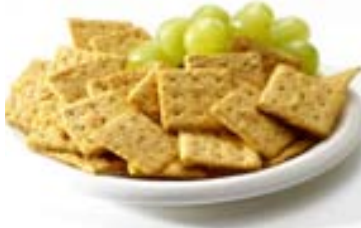
Þurrkex stuttu fyrir brottför gæti dregið úr flökurleika í ferðinni.

Engifer hefur reynst vel við ferðaveiki. Prófið að tyggja engiferrot eða engifersælgæti í bílnum.