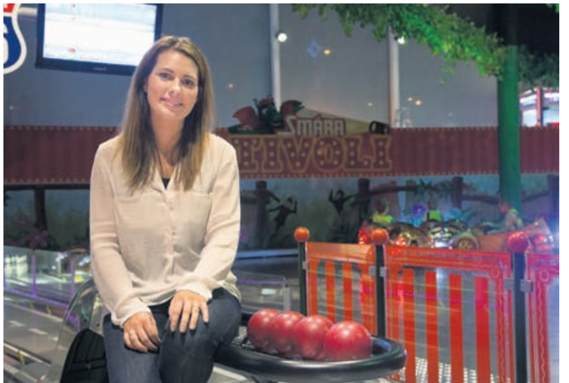
Starfsemi tívolíins hefur verið sívaxandi frá því það tók til starfa 2011.

Tívolíkortin eru svo inneignarkort og gilda í öll tækin. Með þeim safnar fólk tívolímiðum sem þá setur í miðavél og safnar þannig punktum inn á kortið sitt. Síðan