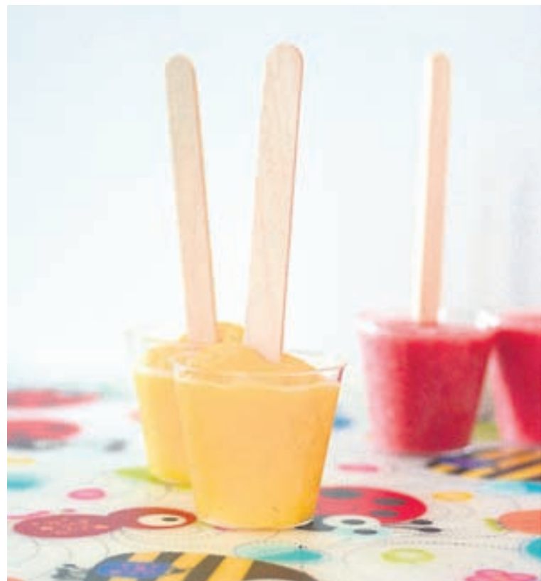
Mangóísinn er hollur og góður. Hægt er að breyta til og nota jarðarber í stað mangós.