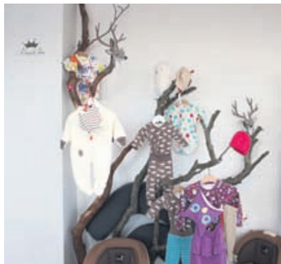
Vöruúrvalið í Barninu Okkar er fjölbreytt og fæst þar meðal annars vandaður barnafatnaður fyrir yngstu börnin.