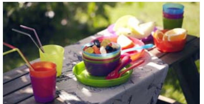
KALAS barnaborðbúnaðurinn er afar vinsæll og vandfundin sú barnafjölskylda sem ekki hefur haft KALAS á borðum.