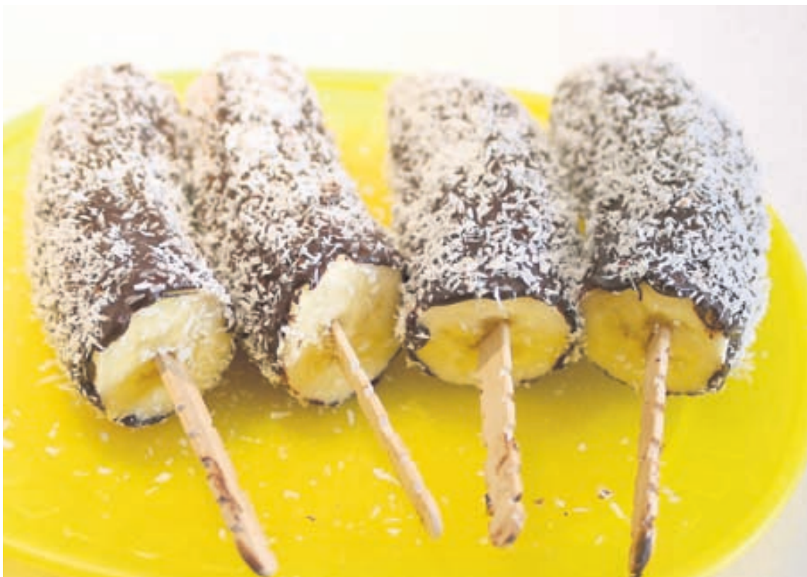
Bananaís er einfalt að útbúa og geta börnin jafnvel gert hann sjálf. Auk þess er hann ljúffengur á bragðið.