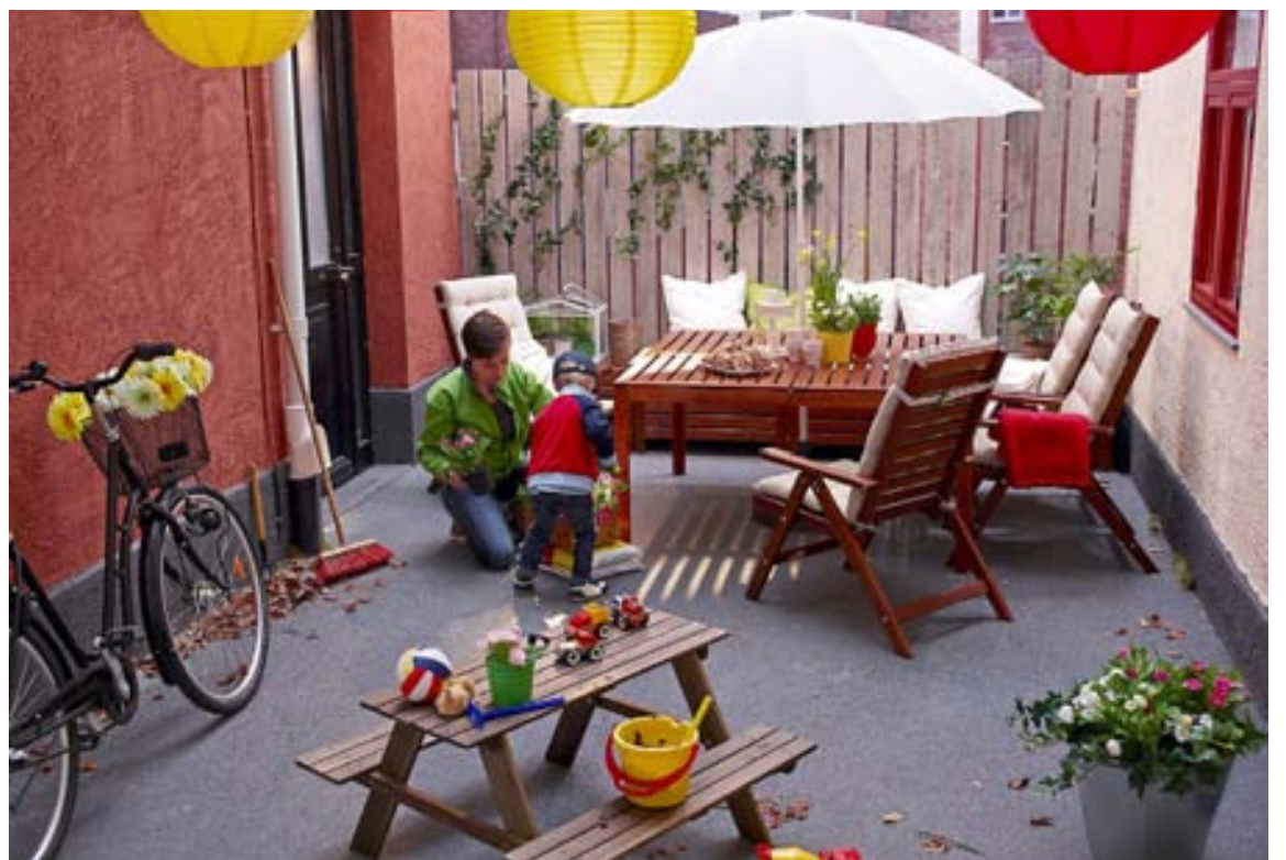
RESÖ bekkurinn hefur verið vinsæll, enda á frábæru verði og börnin elska að eiga eigið sæti sem hentar þeirra hæð.