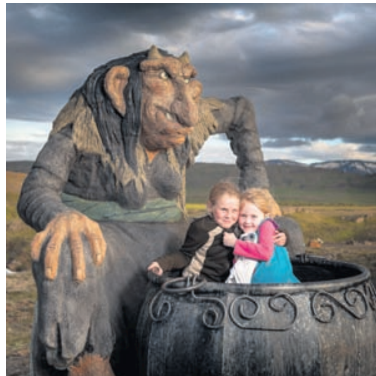
Gryla og tröllin vaka yfir gestum í Fossatúni. Stíltir gestir fá að vera með á mynd.

Í Tröllagarðinum í Fossatúni, skammt frá Borgarnesi, eru tröllin í forgrunni eins og nafnið gefur til kynna. Gestir geta tekið þátt í Tröllaleikjum sem eru fjölskylduvæn skemmtun þar sem allir fjölskyldumeðlimir geta leikið sér saman. Spila má tröllagolf, tröllatennis, tröllatog, tröllaspark, tröllablað og tröllaparís svo nokkrir leikir séu nefndir. Víða um svæðið má skoða og kynnast betur ýmsum tröllum og ef vel er farið að þeim má örugglega taka myndir af þeim með yngstu kynslóðinni. Nánari upplýsingar má finna á www.fossatun.is .