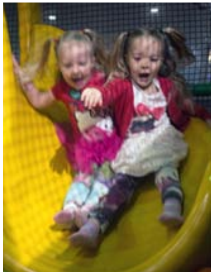
Í barnagæslunni er glænýr hoppukastali.