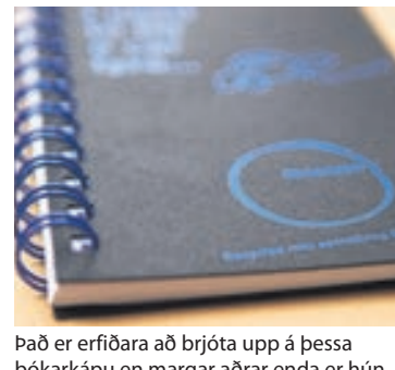
Það er erfiðara að brjóta upp á þessa bókarkápu en margar aðrar enda er hún endurunin úr dekkjum.