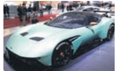
Aston Martin Vulcan