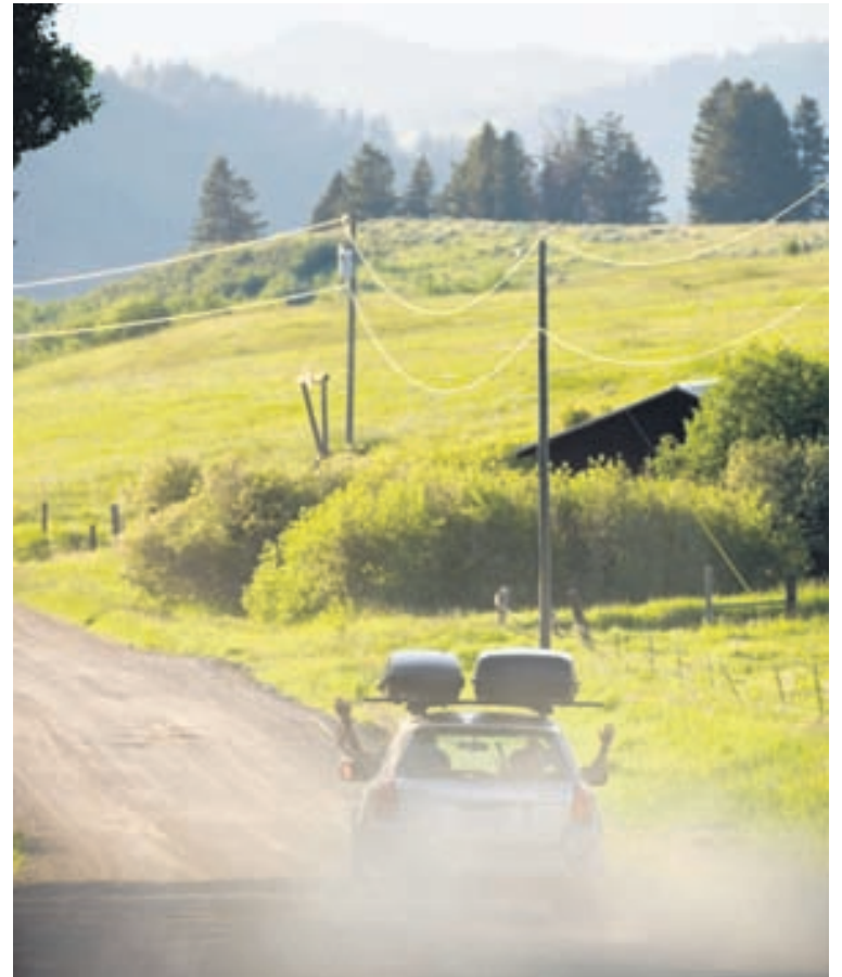
Ástand vega er misjafnt og nauðynlegt að vera á góðum dekkjum á langferðum.

Pétur segir ástandið á vegum landsins heldur verra en venjulega og í sumar verði farið bæði í endurbætur og styrkingar víða um land.