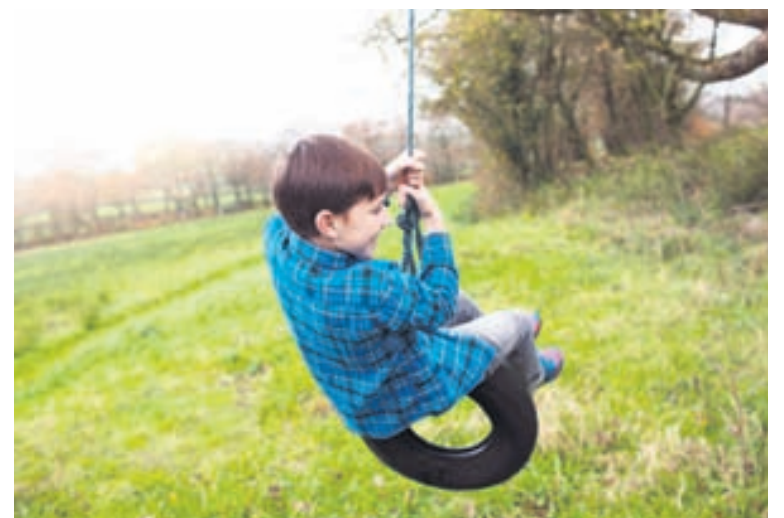
Klassíska leiðin til að endurnýta dekk – róla.