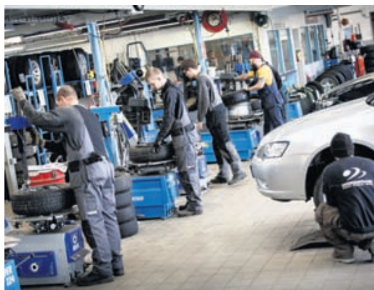
Mikið fjör í Höllinni. Starfsmenn Dekkjahallarinnar leggja mikið upp úr fljótri og góðri þjónustu.