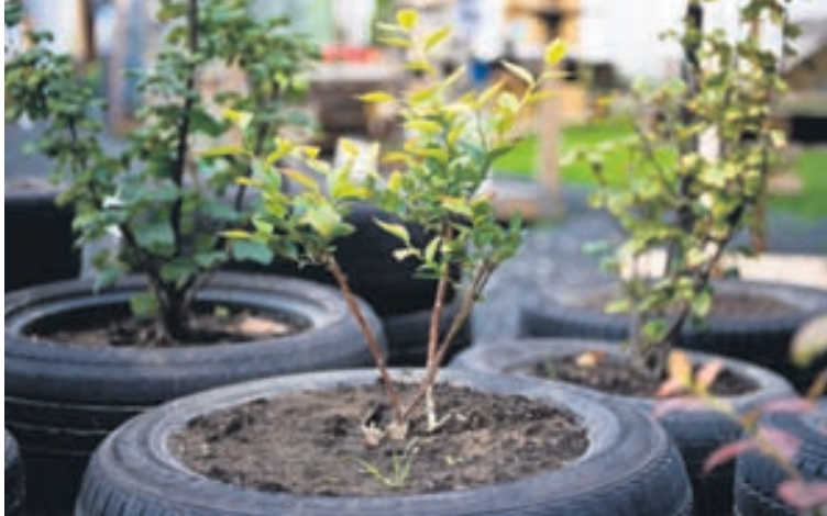
Dekk eru fyrirtaks pottar fyrir plöntur.

eru þeir kurlaðir og notaðir í yfirborð á íþróttaleikvöngum og til endurbóta á vegum. Enn betra er að nota ónýt dekk í eitthvað allt annað en þau eru þekkt fyrir, að gefa þeim nýtt líf á nýjum vettvangi. Hér eru nokkur dæmi um slíkt.