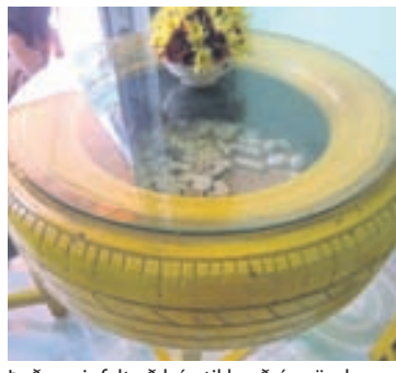
Það er einfalt að búa til borð úr gömlu dekki. Þá er því smellið ofan á einhvers konar fætur eða undirlag og glerplata sett ofan á það. Og svo er bara að bera fram kaffið.