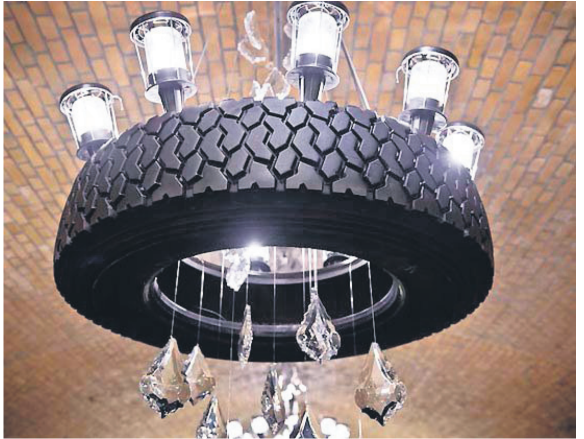
Hjólbarði sem ljósakróna. Það er ekki algeng sjón.