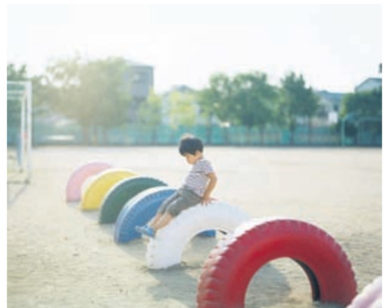
Dekk eru notuð á fjölbreyttan máta á leikvöllum fyrir börn.