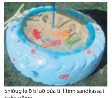
Sniðug leið til að búa til lítinn sandkassa í bakgarðinn.