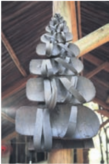
Sandalar úr gúmmíu eru notaðir í mörgum Asíulöndum. Þessir eru búnir til úr dekkjum og eru til sölu á götumarkaði í Ho Chi Minh-borg í Vietnam.