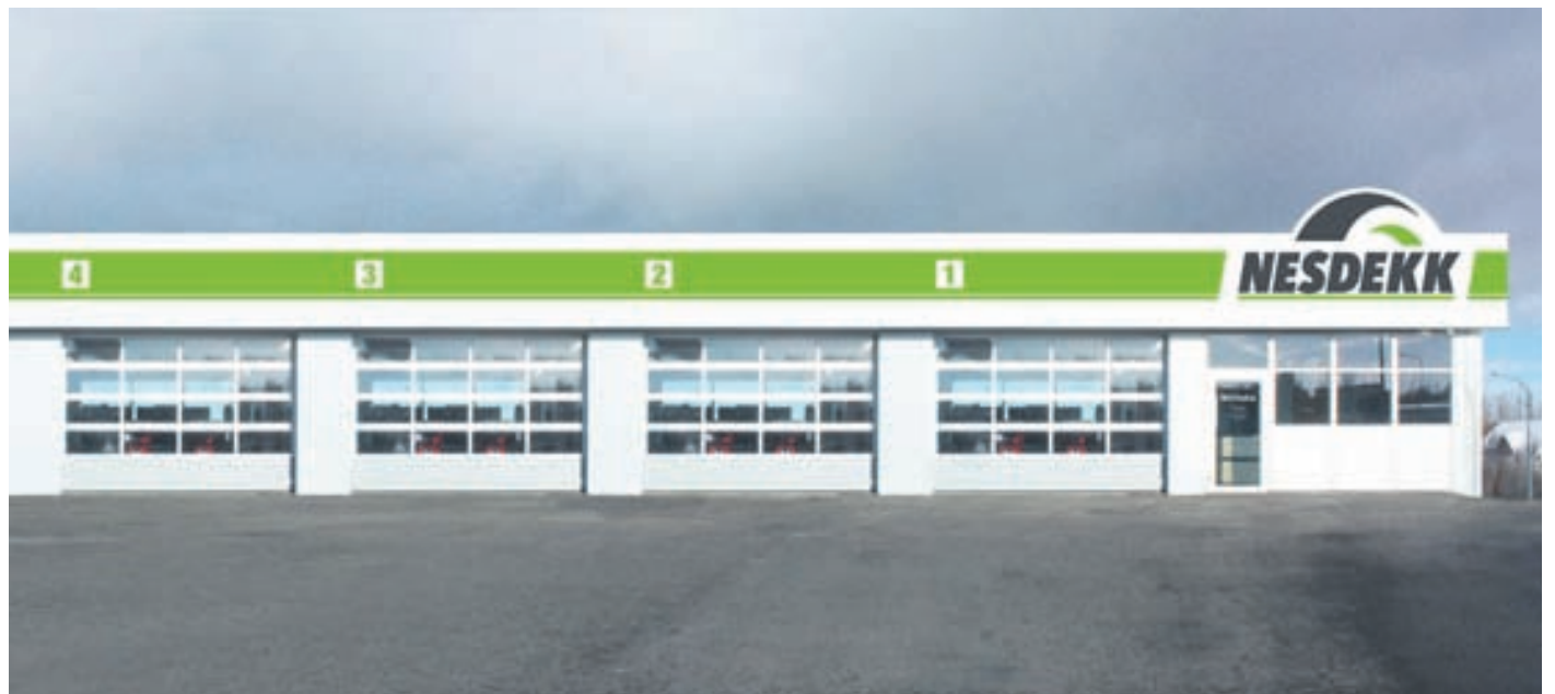
Nú er Nesdekk líka komið í Garðabæ, þar sem áður var Nýbarði.

Allar fimm stöðvar Nesdekk eru opnar virka daga milli kl. 8 og 18 og á laugardögum milli kl. 11 og 14.