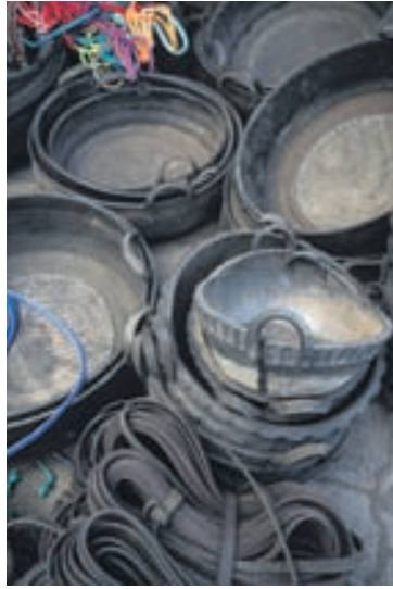
Körfur má nota til ýmissa þarfra hluta. Þessar voru til sölu á markaði í Ekvador.