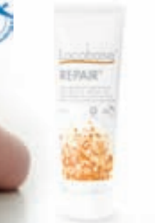
Locobase® fyrir þá sem þú elskar...