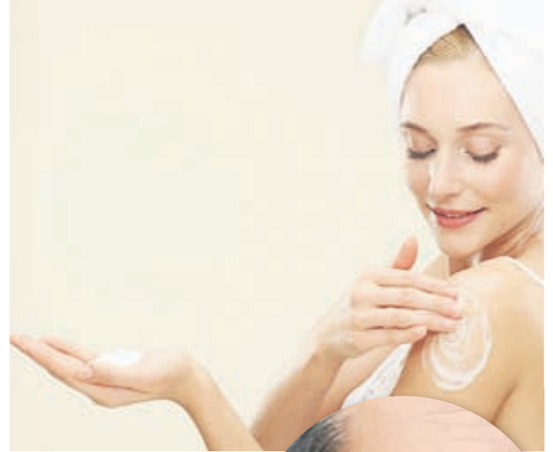
Best er að bera á húðina beint eftir sturtu á meðan hún er ennþá rök.