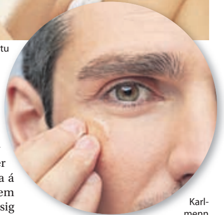
Karlmenn þurfa ekki síður að bera á sig en konur.

með því að bæta húðinni strax upp þann raka sem hún tapar í þurru og köldu veðri. Karlmennt eru oft tregir til að bera á sig krem en þeir þurfa ekki síður á því að halda en konur. Best er að bera á sig eftir það og byrja á vandamálasvæðum. Sumir sem glíma við húðvandamál bera á sig og vefja svo plastfilmu utan um sérlega slæm svæði og leyfa henni að vera í um hálf klukkustund. Það tekur vissulega tíma en linar þjáningar og húðin verður silki mjúk.