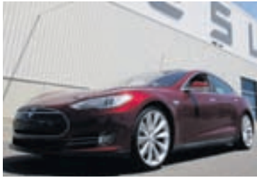
Tesla Model S fyrir utan höfuðstöðvarnar.

Hreinræktuðum rafmagnsbílum og Plug-In-Hybrid-bílum fer mjög fjölgandi vestanhafs eins og í öðrum heimshlutum. Þeir spara eigendum sínum háar upphæðir í eldsneytiskostnaði og reiknað hefur verið út að hann nemi 171 milljón lítra eldsneytis sem kostað hefði þá 11,3 milljarða króna. Það eru nú um 200.000 slíkir