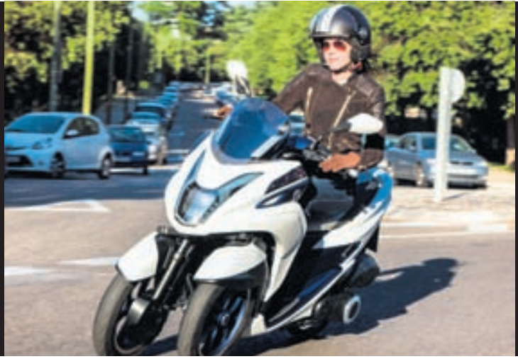
Sannarlega óvenjulegt hjól frá Yamaha.

Hvaða mótörhjólaframleiðandi ætlar ekki að taka þátt í þriggja hjóla æðinu sem nú virðist hafið? Yamaha hefur kynnt eitt slíkt hjól með 125 cc fjögurra strokka mótör og CVT-sjálfskiptingu. Hjólið er afar létt, eða aðeins 152 kíló, og segir Yamaha að þar fari léttasti þriggja hjóla farkosturinn sem í boði er. Þyngdardreifingin er 50/50 á framhjólin og afturhjólin og það hallar sér í beygjum með svokölluðu „Multi Wheel System“ og er mjög stöðugt hvort sem ekið er beint eða í beygjum. LED-ljós eru bæði að framan og aftan á því og diskabremsur eru einnig að framan og aftan. Hjólið á að eyða mjög litlu og Yamaha segir að það eigi að kosta eigandann einkar lítið að reka það. Þetta hjól verður aðeins í boði í Evrópu til að byrja með og kostar 4.000 evrur, eða um 630.000 kr. Það kemur á markað í sumar og kaupendur þess geta valið um fjóra líti.