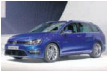
Volkswagen Golf Wagon R.

Stærsti bílaframleiðandi í Rússlandi er AvtoVAS, sem framleiðir Lada-bíla. Tap var á rekstri fyrirtækisins í fyrra og nam það 25,3 milljörum króna. Sala á rússneskum bílum féll í fyrra og var minnkunin 7% hjá Lada en 5% ef teknir eru saman allir rússneskir bílaframleiðendur. Efnahagsástandi í Rússlandi er um að kenna að sögn Lada. Renault-Nissan á 32% hlut í AvtoVAS, Volkswagen 11% hlut og General Motors 9%. Lada menn spá því að árið í ár verði þeim áfram erfitt og þar á bæ búast menn ekki við mikið aukinni sölu. Lada mun samt kynna nýjar bílgerðir á árinu og vonast til þess að ná markaðshlutdeild af erlendum bílaframleiðendum. Aðalmarkmið AvtoVAS á þessu ári verður að snúa rekstrinum til hagnaðar. AvtoVAS hefur smíðað bíla í 60 ár og voru þeir í upphafi byggðir á Fiat 124-bílnum, en lagaðir að rússneskum aðstæðum, kulda og vegum. Voru bílarnir hærri á vegi og með rússneskar vélar sem þóttu betri en þær sem voru í Fiat-bílnum.