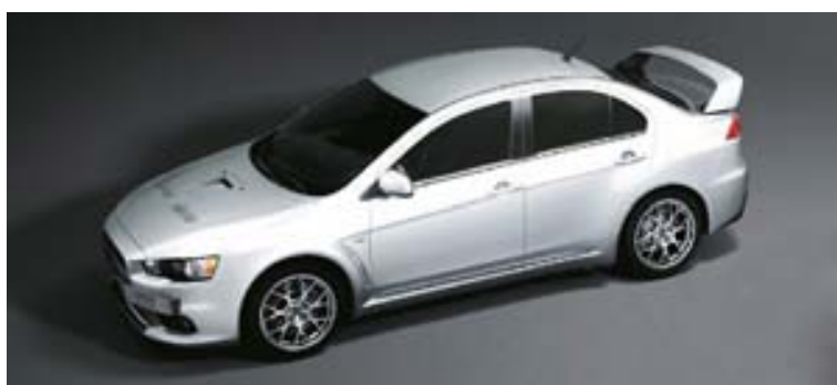
Mitsubishi Lancer EVO hefur ávallt verið í miklum metum hjá bílaáhugamönnum.

því að þessi ný Seat-jepplingur verði smíðaður í Skoda-verksmiðju í Tékklandi á sama stað og Yeti-jepplingur Skoda er smíðaður. Ástæða þess er sú að mun ódýrara er að smíða bíla í Tékklandi en á Spáni. Seat hefur ekki skilað hagnaði síðan árið 2007. Tapið minnkaði á milli ára í fyrra en nam samt tæpum 24 milljörðum króna. Sala Seat-bíla jókst um 11% á síðasta ári og nam 355.000 bílum, en ekki dugði það til svo að tapi yrði snúið í hagnað. Til greina kemur að reisa Seat-verksmiðju í Kína, en Kína er stærsti markaðurinn fyrir Seat-bíla.