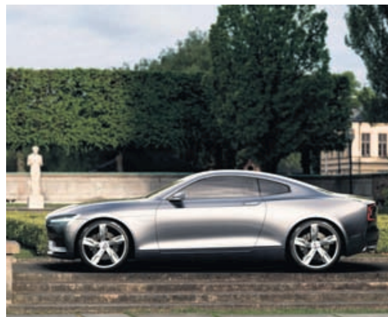
Volvo Concept Coupe.

Kínverjar ætla ekki að sitja hjá Kínverskir bílaframleiðendur ætla ekki að horfa á evrópska og bandaríska bílaframleiðendur fylla eigin markað. Þeir ætla að stóru sína framleiðslu og hafa í því skyni keypt upp nokkur fornfræg bílamerki, eins og sænsku framleiðendurna Volvo og Saab. Margir þeirra leita nú enn frekar hófanna með kaup á fleiri slíkum bílafyrirtækjum,