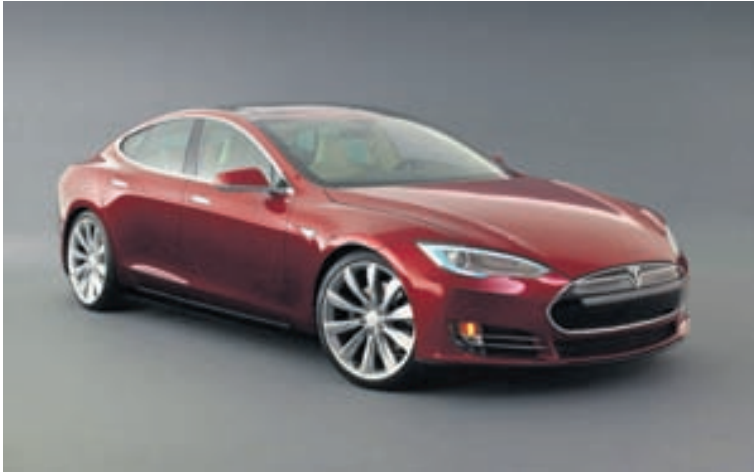
Tesla Model S rafmagnsbíllinn var söluhæstur og Nissan Leaf í þriðja sæti.

Model S í Noregi í ár, talsvert meira en af Golf og Leaf. Til að setja þessar tölur í enn meira samhengi þá seldust fleiri Tesla Model S en af öllum gerðum Ford-bíla. Góð sala rafmagnsbíla í Noregi skýrist að miklu leyti af þeim ívilnunum sem rafmagnsbílaeigendur njóta þar, vörugjalda- og skattleysi, fríum bílastæðum, forgangi á akreinum fyrir strætisvagna, fríum vegtollum og fleiri þáttum. Ekki skal þó litið fram hjá því að Tesla Model S er samt dýr bíll, en efnahagur íbúa Noregs leyfir slíkan munað.