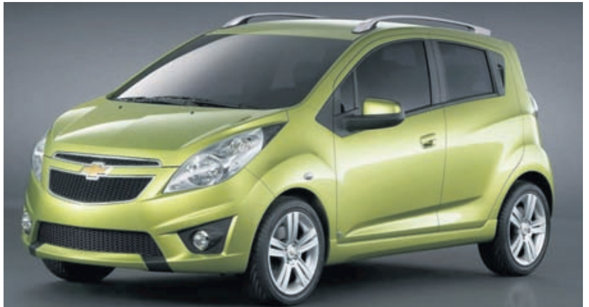
Chevrolet seldist mest allra bíla merkja.

inn Geely í Kína, sem myndi sjá áfram um framleiðslu eldri gerðar XC90, þrátt fyrir að nýja gerðin verði einnig til sölu þar. Sá eldri verður í boði sem ódýrari valkostur en nýi bíllinn. Aðeins einn vélarkostur yrði í eldri XC90-bílnum, 2,5 lítra og fimm strokka vél með forþjöppu. Nú eru þegar liðin 12 ár frá framleiðslu fyrstu og einu kynslóðar Volvo XC90 bílsins og eru fá dæmi um slíkt á seinni árum, en árin halda áfram að telja með framleiðslunni í Kína.