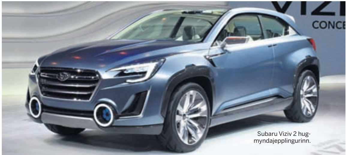
Subaru Viziv 2 hugmyndajepplingurinn.

en heildarlækkun í sölu var ekki nema 5,5% í fyrra, en sala Ford minnkaði um 18%. Ekki batnaði það hjá Ford á þessu ári því fyrstu tvo mánuði ársins minnkaði sala Ford um 21%. Þessar aðgerðir Ford verða ekki þær einu í Rússlandi, en fyrirtækið ætlar að loka verksmiðjum sínum í fjórar vikur á næstunni til að rétta við muninn á framböði og eftirspurn Ford-bíla í Rússlandi. Ford áformar ekki að draga sig frá framleiðslu bíla sinna í Rússlandi þrátt fyrir tímabundna erfiðleika og hefur trú á bættu ástandi þar.