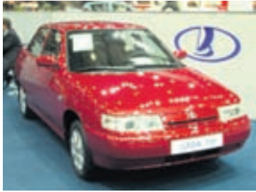
Lada er ekki að slá í gegn á heimavelli.