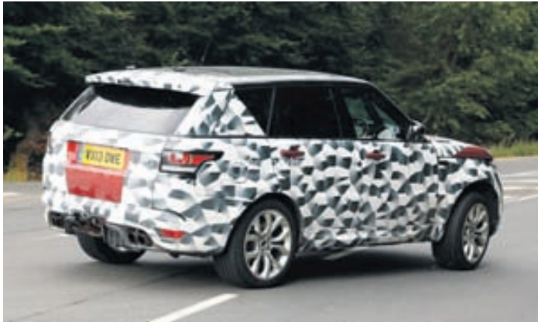
Prófanir á nýjum Range Rover Sport RS.

Nokkuð jöfn skipting er á milli hreinræktuðra rafmagnsbíla og Plug-In-Hybrid-bíla, eða um 100.000 af hvorri gerð. Bílarnir Chevrolet Volt, Nissan Leaf og Tesla-bílar telja um tvo þriðju af öllum þessum flota. Bílarnir Chevrolet Volt, Nissan Leaf og Tesla-bílar seldust helmingi meira í fyrra en árið áður en sala Tesla-bíla áttfaldadist milli ára. Þessi sparnaður eigenda rafmagnsbíla mun einungis fara vaxandi á næstu árum og minnka þörfina fyrir jarðefnaeldsneytisnotkun Bandaríkjamanna.