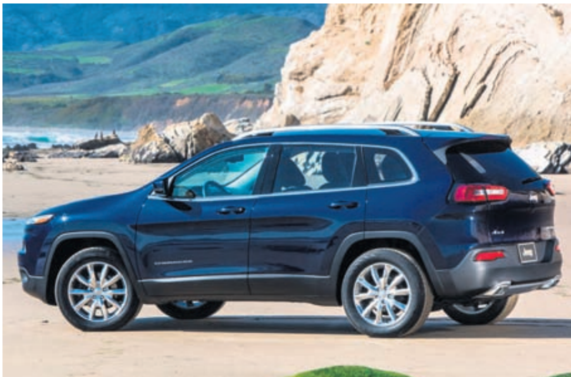
Jeep Cherokee selst eins og heitar lummur vestra.

gera þennan bíl afar álitlegan og ekki bara hráa spyrnukerru. Verð hans verður 50.000 bresk pund, eða 9,2 milljónir króna. Þessi bíll er svo snöggur að hann skýtur aftur fyrir sig bílum eins og BMW M3, Porsche 911, mörgum Lamborghini-bílum og það er afar stutt í að hann nái Porsche 911 Turbo. Mercedes Benz hefur sagt að fyrirtækið framleiði öflugustu fjögurra strokka vél allra bílaframleiðenda í CLA45 AMG-bíllinn, sem er 335 hestöfl, en þessi ný bíll Mitsubishi slær því við um heil 105 hestöfl.