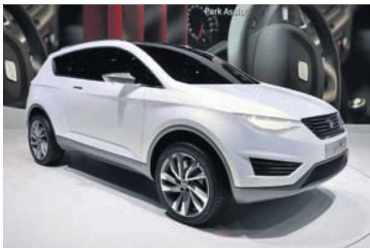
Seat-hugmyndajepplingur á bílasýningu í Genf.