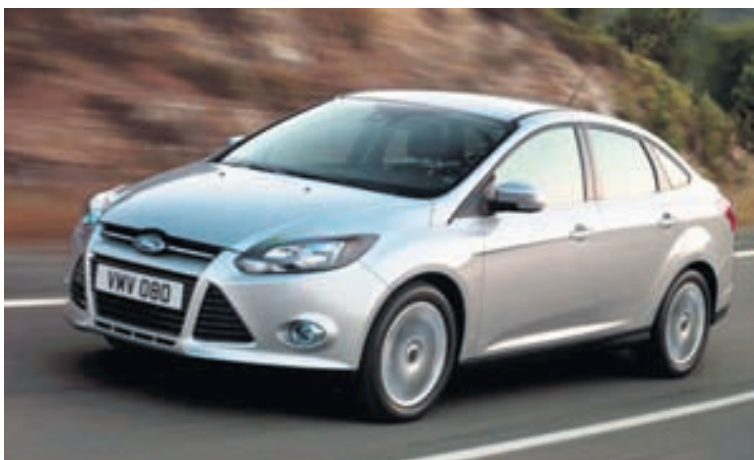
Sala á Ford-bílum minnkaði um 18% í Rússlandi í fyrra.

vænsta sportbíl. Þessi vél þarf líka að anda meira en aðrir vélarkostir í Range Rover Sport og því eru stærri loftinntök að framan og að aftan eru myndarleg fjögur pústop. Ekki er ljóst hvar Jaguar/Land Rover ætlar að kynna þennan bíl, en ekki er talið ólíklegt að það verði á bílasýningunni í New York sem hefst um miðjan apríl. Þó gæti hann fyrst sést á bílasýningunni í Peking í lok apríl, enda eru margir vænlegir kaupendur bílsins þar.