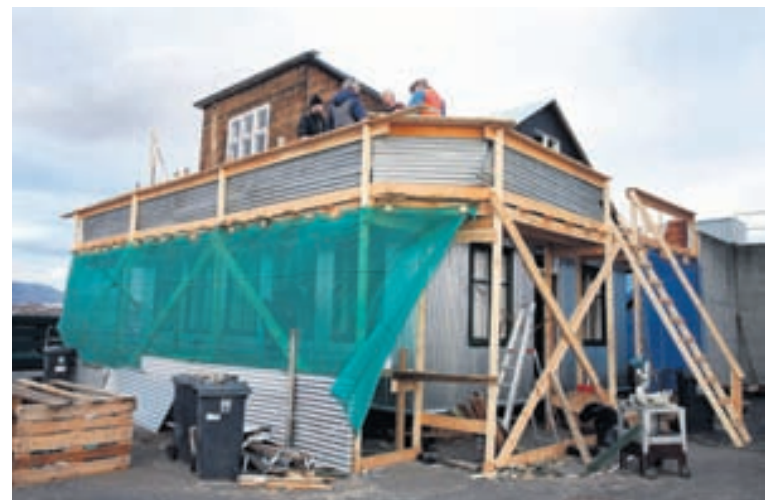
Viðhald húsa getur verið kostnaðarsamt.

urgreiðsluna. Eyðublöð fást hjá skattstjórum og á vef ríkisskattstjóra. Halda þarf til haga frumritum af öllum reikningum og þeir þurfa að vera sundurliðaðir vegna efnis og vinnu. Skattstjóri í heimabæ sér um endurgreiðsluna sem fer fram innan þrjátíu daga frá móttöku skjala.