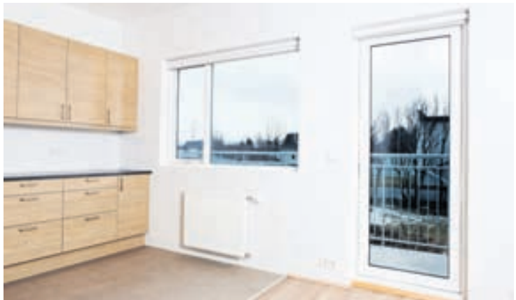
Ráðgjafar Húsasmiðjunnar veita viðskiptavinum góð ráð við val á gluggum og hurðum.