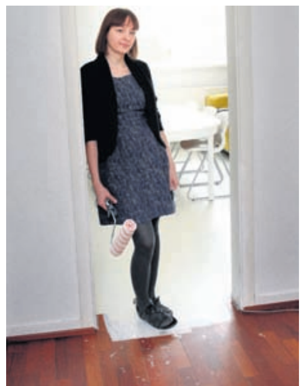
Hér má sjá gamla merbau-parkettið fara smátt og smátt undir hvíta gólfmálningu hjá Hörpu.

„Ég er hamingjusöm í birtunni minni og ljóst gólfíð lyftir öllu upp. Ég get líka óhikað friðað samvisku annarra þegar kemur að parkettmálun því hún er í góðu lagi og kjörið ráð á krepputímum til að fríska upp á gólfefni heimilisins. Ég mæli bara með að fólk fari að ráðum fagmanna um efnað."