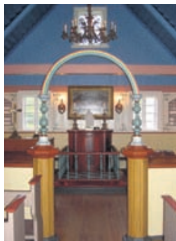
Úr Skinnastað í Öxarfirði.