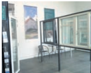
Úrvalið má skoða í sýningarsal Faris að Gylfaflöt 3. Nánari upplýsingar á www.faris.is.

flöt 3 má skoða VELFAC-glugga af ýmsum stærðum og gerðum og skella hurðum," segir Sigurður.