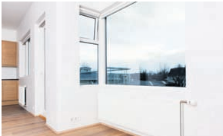
Allir gluggar Húsasmiðjunnar eru sérsníðaðir eftir óskum viðskiptavina.