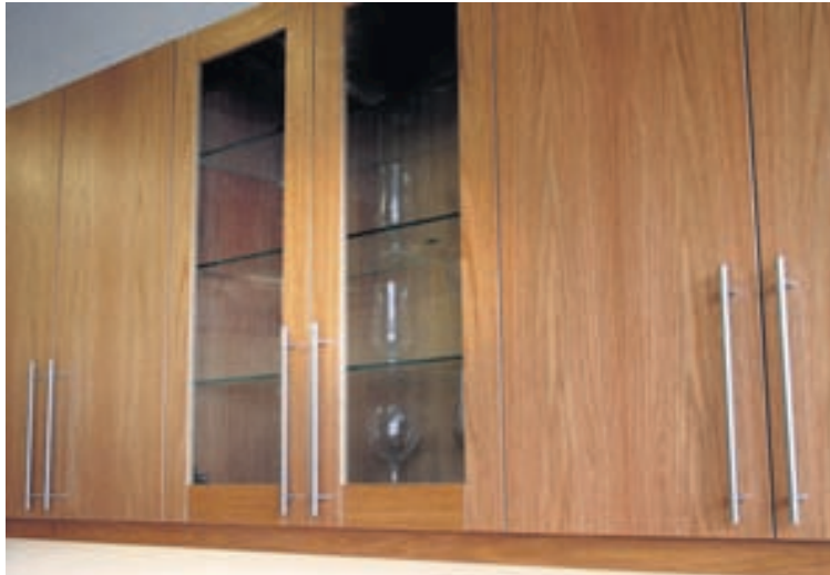
Glæsilegt úrval og útlit innréttinga er ríkulegt í Birninum.

gömlu eldhúsi eða baði og endurnýja yfirbragð þess,“ segir Páll.