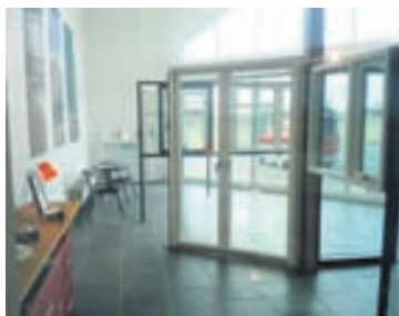
VELFAC-gluggarnir eru því sem næst viðhaldsfrír þar sem álið að utan er raflakkað.