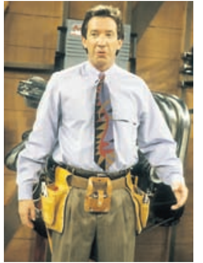
Tim Allen varð heimsfrægur fyrir leik sinn í þáttunum um Handlaginn heimilisfaðir.

Þættirnir voru byggðir á uppstandi og gamanleik Tims Allen en fjölluðu um Taylor-fjölskylduna, hjón með þrjú börn. Tim er nokkurs konar staðalímynd af bandarískum eiginmanni sem dái verkfæri, bíla og íþróttir. Hann er sömuleiðis mikill brandarakall sem er stöðugt að prófa og þróa nýja hluti með verkfærunum sínum. Þættirnir eru endursýndir víða um heim um þessar mundir en þeir nutu mikilla vinsælda á Stöð 2 á sínum tíma. Nafnið á þáttunum, Handlaginn heimilisfaðir, festi sig í sessi hjá landsmönnum og hefur verið mikið notað, bæði í gríni og alvöru. Þótt Tim Allen sé þekktastur fyrir leik sinn í Home Improvement hefur hann sömuleiðis orðið vinsæll í kvikmyndunum um jólasveininn The Santa Clause. Þá fékk Bósi Ljósár rödd hans léða í kvikmyndunum Toy Story. Undanfarin ár hefur Allen leikið Mike Baxter í þáttunum Last Man Standing.