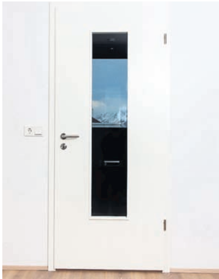
Fallegar hurðir fást hjá Húsasmiðjunni í mörgum litum.

Hægt er að kynna sér úrval glugga og hurða í öllum verslunum Húsasmiðjunnar. Best er þó að koma við í Timburmiðstöð Húsasmiðjunnar í Grafarholti til að sjá bæði úrvalið og fá ráðgjöf.