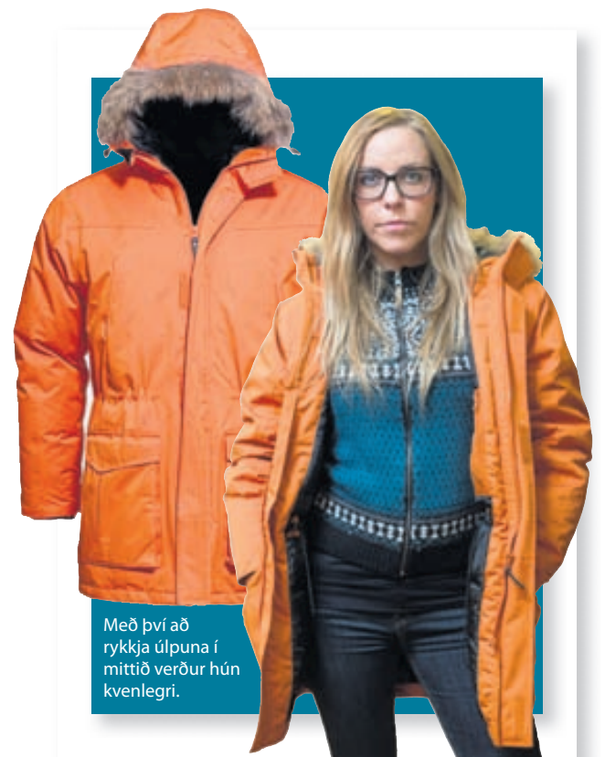
Með því að rykkja úlpuna í mittið verður hún kvenlegri.