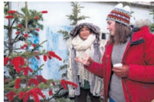
Desemberkuldur og Dorrit er hlýlega klædd.