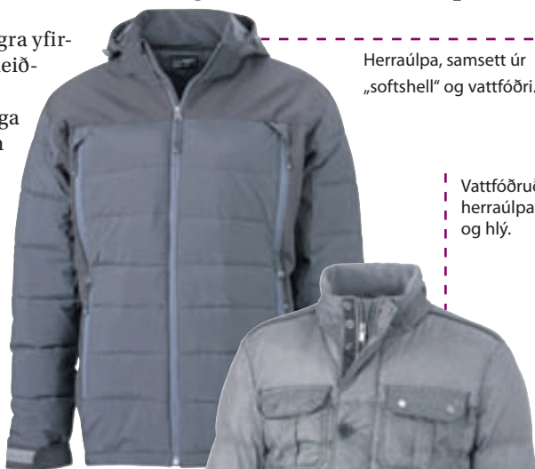
Herrauþpa, samsett úr „softshell“ og vattfóðri.

Batik er með verslun og sýningarsal að Bíldshöfða 16. Skoðið vörurvalið á www.batik.is