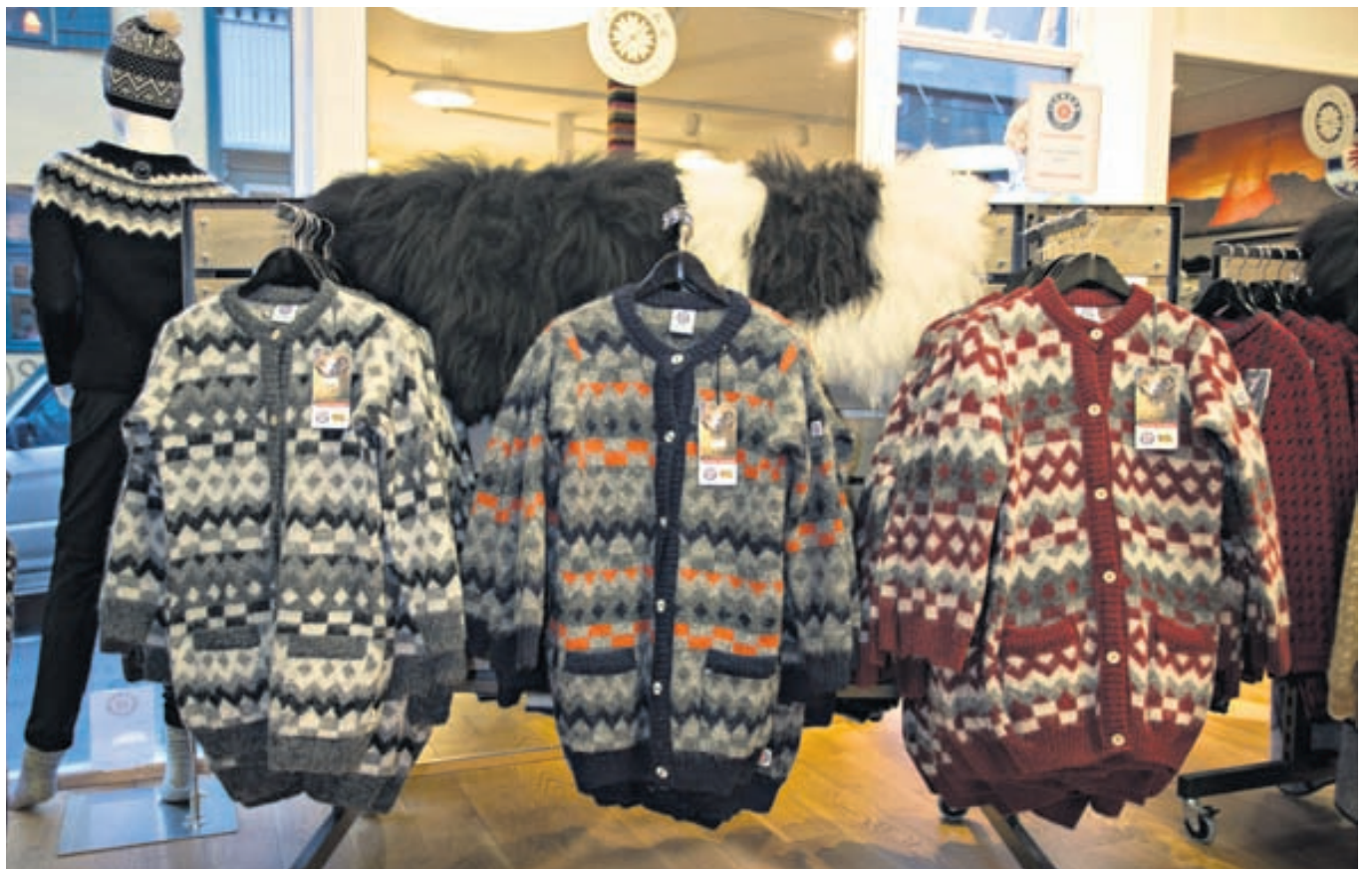
Hönnuðir Icewear teikna ullarvörurnar. Þær eru framleiddar í verksmiðju fyrirtækisins í Vík í Mýrdal.

Verslunin er í Fákafeni 9, Þingholtsstræti 2-4 og Austurvegi 20 í Vík í Mýrdal. Einnig rekur ICEWEAR öfluga vefverslun, www.icewear.is þar sem boðið er upp á fjölbreytt vöruúrval og fría heimsendingu um land allt.