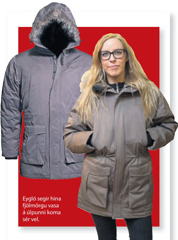
Eygló segir hina fjölmörgu vasa á úlpunni koma sér vel.