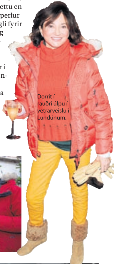
Dorrit í rauðri úlpu í vetrarveislu í Lundúnum.

Hér eru nokkrar myndir af forsetafrúnni í mismunandi yfirhöfnum.