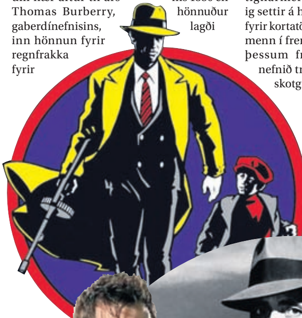
Gulur regnfrakki er einkennismerki leynilögreglu-mannsins Dicks Tracy.

Rykfrakkinn var notaður af hermönnum í fyrri heimsstyrjöldinni, þá var einnig bætt við hann ýmsum eiginleikum eins og axlarólum fyrir skúfa eða önnur tignarmerki. Þá voru einnig settir á hann D-laga hringir fyrir kortatöskur og sverð. Hermenn í fremstu víglínu gáfu þessum frökkum viðurnefnið trench coat, eða skotgrafarfrakki.