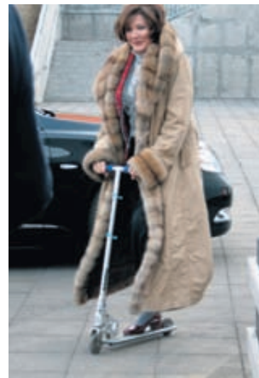
Dorrit Moussaieff í fallegri skinnkápu í heimsókn í Skagafirði. Hún bregður oft en ekki á leik með börnum þar sem hún kemur.