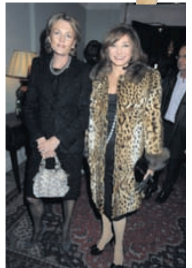
Dorrit og Madelaine Lloyd-Webber koma til veislu í Lundúnum. Dorrit í pels.