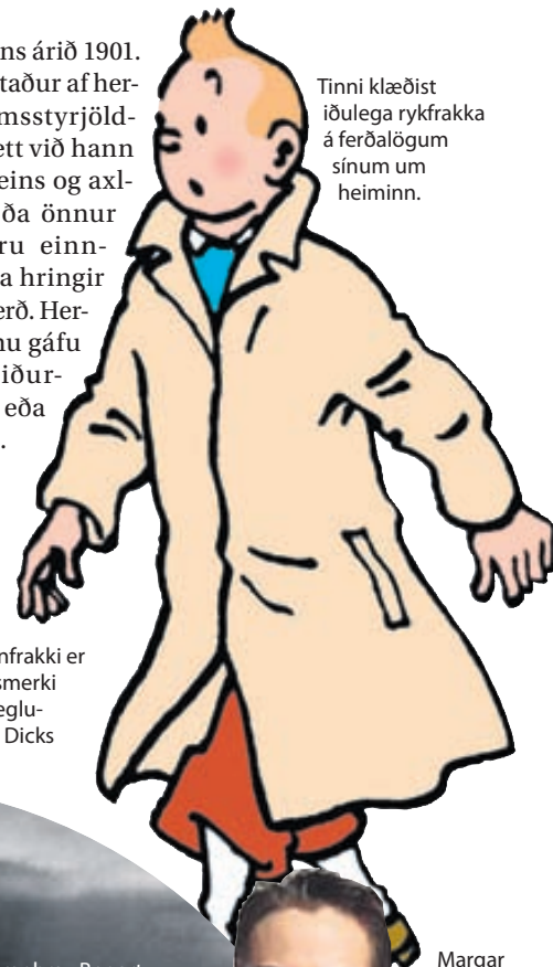
Tinni klæðist iðulega rykfrakka á ferðalögum sínum um heiminn.