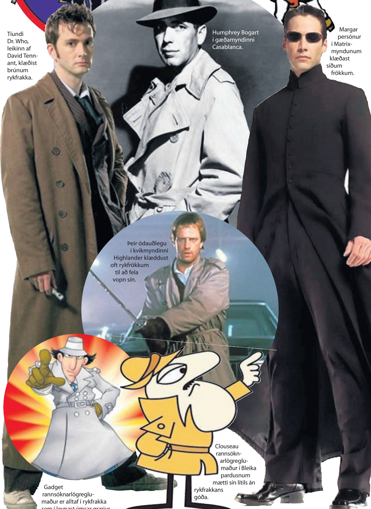
Þeir ódauðlegu í kvikmyndinni Highlander klæddust oft rykfrökkum til að fela vopn sín.