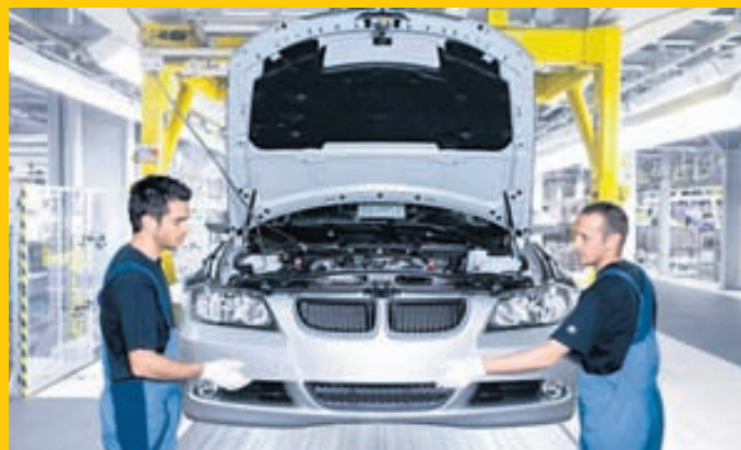
Úr samsetningarverksmiðju BMW í Þýskalandi.

á hundraðið að meðaltali og það hljómaði jafn illa í eyrum þýskra framleiðenda. Krafa Þjóðverjanna er enn fremur sú að þessum lágu tölum þurfi ekki að hlíta fyrr en árið 2024, eða fjórum árum seinna. Þýsku framleiðendurnir benda á að þeir séu tilbúnir til að hlíta ströngum kröfum um eyðslu og mengun, en markið hafi verið sett of hátt, eða öllu heldur of lágt! Þýsku framleiðendurnir fengu stuðning frá löndum eins og Bretlandi og Póllandi. Umhverfissinnar eru fokreiðir út í Evrópusambandið fyrir að hafa beygt sig fyrir Þjóðverjum og að þeir standi í vegi fyrir því að Evrópa taki forystuna í framleiðslu umhverfisvænna bíla.