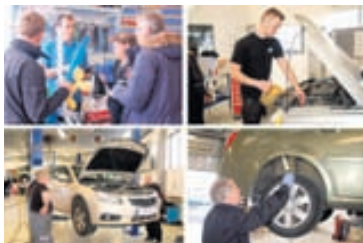
Ötulir starfsmenn gaumgæfa bílana.