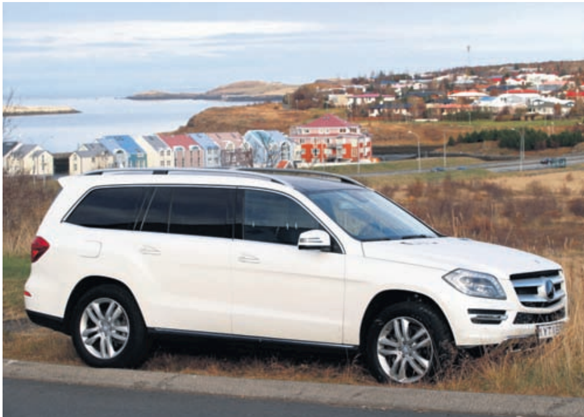
Mercedes Benz GL350 er mjög langur bíll, með þrjár sætaraðir og rúmar sjö farþega.

Vissir þú að... holl og góð fæða studlar að líkamlegu heilbrigði sem börn eiga rétt á