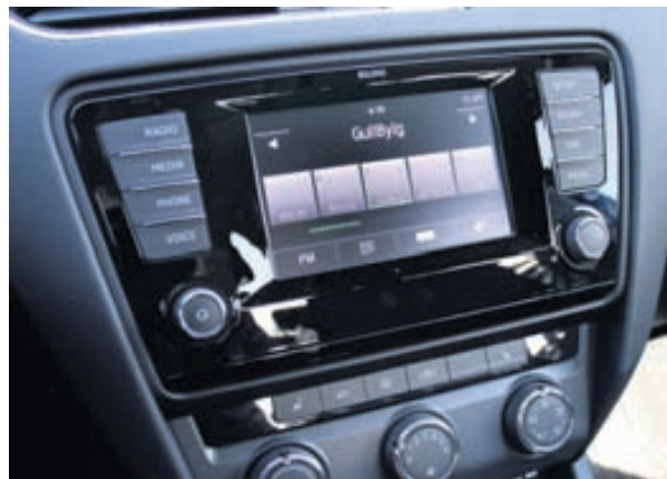
Frágangur innréttingar er til fyrirmyndar.