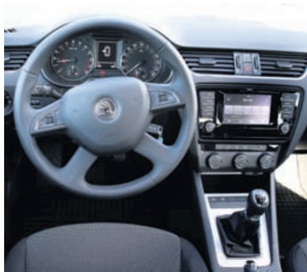
Octavia er skemmtilegur akstursbíll og hefur nú batnað sem slíkur.

konar sniðugum lausnum og smáatriðum. Armpúðinn er með sniðugustu og skilvirkustu hækkun sem greinarritari hefur séð, kæling í hanskahólfi, rusladallur með poka í farþegahurð, sniðugar hirslur með miklu notkunargildi og rúðuskafa í bensínloki eru bara örfá dæmi um sniðugheitin. Ekki versnar það hvað skottið varðar, snúa má þar mottunni, sem er tvöföld með gúmmíi öðrum megin en teppi hinum megin, allt eftir þörfum. Festingar fyrir hvers konar farangur eru þær flottustu sem sést hafa og engin takmörk eru fyrir því hvað tékkneskir verkfræðingar Skoda reyna að einfalda fyrir mann lífið. Allt þetta fær kaupandi Octavia fyrir lítið. Því er Skoda Octavia, nú sem áður, frábær kaup og ekki kæmi á óvart að hann seldist allra bíla best á þessu ári á Íslandi.