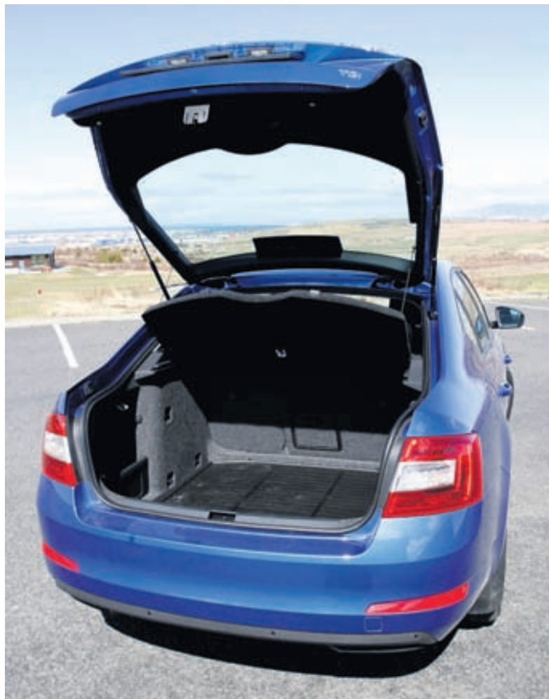
Skottið er hrikalega stórt, 590 lítrar.

konar sniðugum lausnum og smáatriðum. Armpúðinn er með sniðugustu og skilvirkustu hækkun sem greinarritari hefur séð, kæling í hanskahólfi, rusladallur með poka í farþegahurð, sniðugar hirslur með miklu notkunargildi og rúðuskafa í bensínloki eru bara örfá dæmi um sniðugheitin. Ekki versnar það hvað skottið varðar, snúa má þar mottunni, sem er tvöföld með gúmmíi öðrum megin en teppi hinum megin, allt eftir þörfum. Festingar fyrir hvers konar farangur eru þær flottustu sem sést hafa og engin takmörk eru fyrir því hvað tékkneskir verkfræðingar Skoda reyna að einfalda fyrir mann lífið. Allt þetta fær kaupandi Octavia fyrir lítið. Því er Skoda Octavia, nú sem áður, frábær kaup og ekki kæmi á óvart að hann seldist allra bíla best á þessu ári á Íslandi.