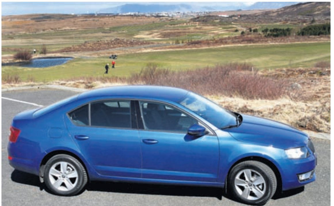
Skoda Octavia hefur ekki breyst svo mikið í útliti, en samt fríkkað.