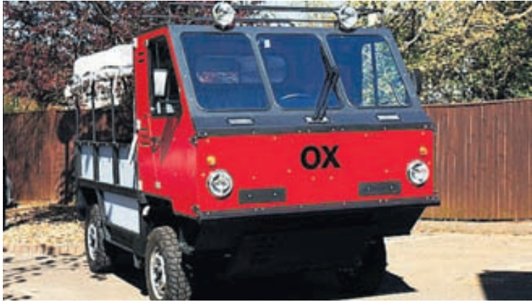
Bíllinn ber heitið OX og er bresk hönnun.