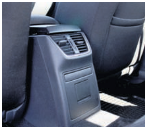
Skoda leggur mikið upp úr sniðugum lausnum.