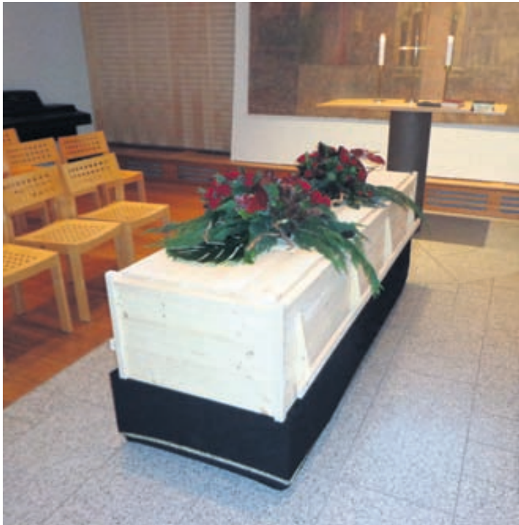
Útfararþjónustan hefur látið hana og smíða íslenskar kistur úr íslenskum viði í samstarfi við Þorstein B. Jónmundsson.

Útfararþjónusta, blómaskreytingar, legsteinar, útfararsíðir og stuðningur í sorg.