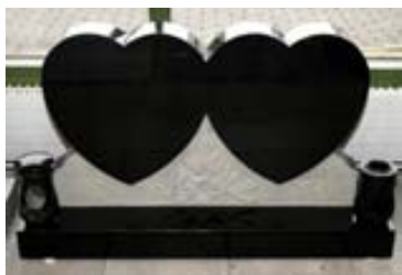
Steinarnir eru allir úr hágæða graníti og þola íslenska veðráttu afar vel.