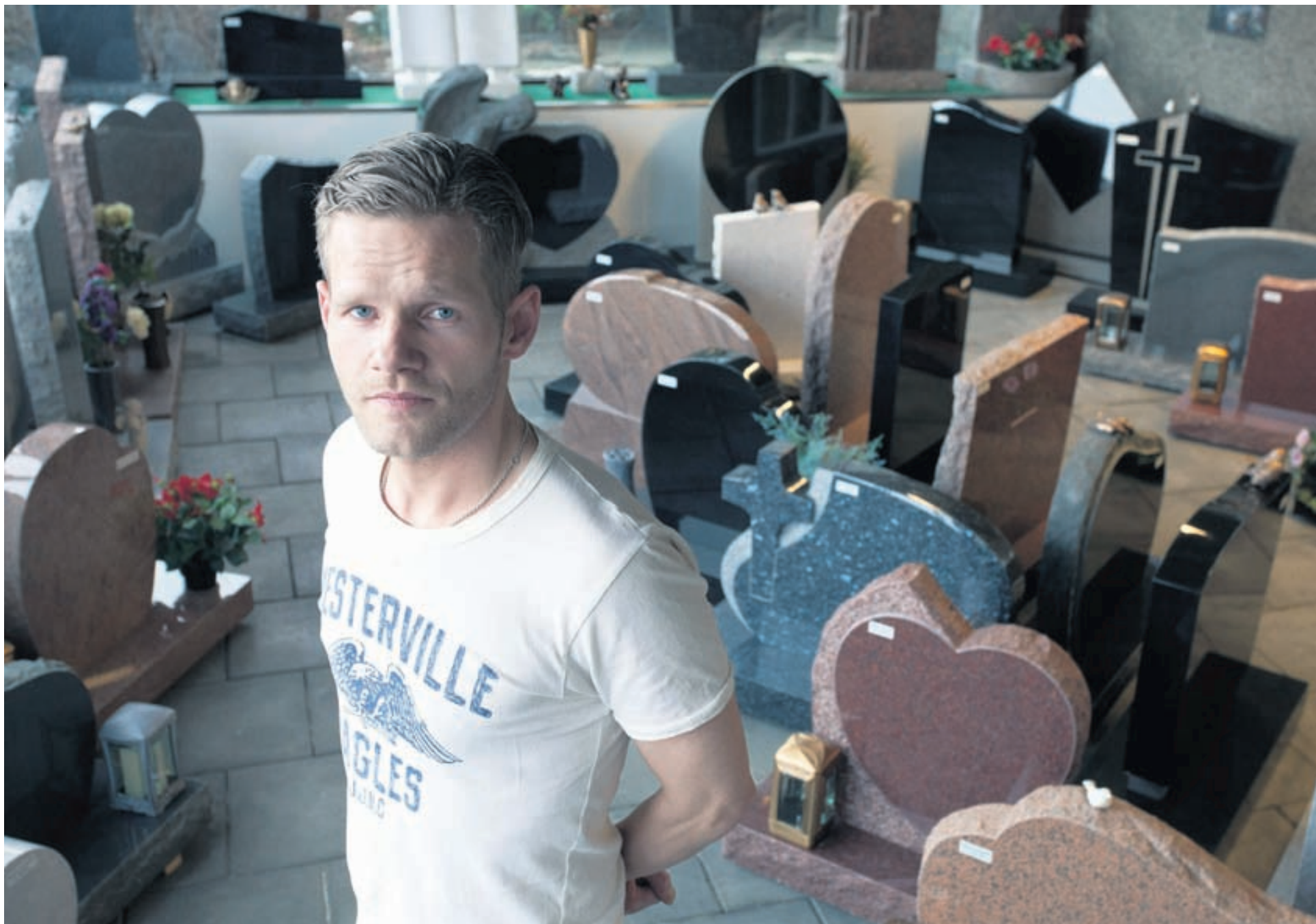
Legsteinar úr graníti og marmara, gabbró, líparíti og stuðlabergi eru til sýnis í glæsilegum sýningarsal að Skemmuvegi 48, Kópavogi. Þar er hægt að skoða ýmsar gerðir legsteina.