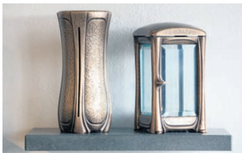
Ljósker og vasar eru á sérstöku tilboði um þessar mundir á 29.900.

Afmælislegsteinninn er með undirsteini, áletrun, lukt, vasa og postulínsmynd og kostar 169.000 með uppsetningu í kirkjugarði.“