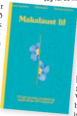
Bókin Makalaust líf kom út fyrir jólin.