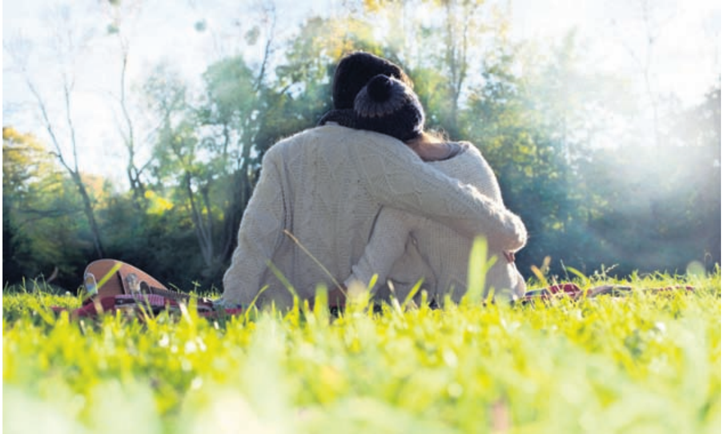
„Ég var að kveða þann sem hafði leikið aðalhlutverkið í þessu leikriti og svo þarna í jarðarförinni var ég sjálf orðin aðalleikarinn.“