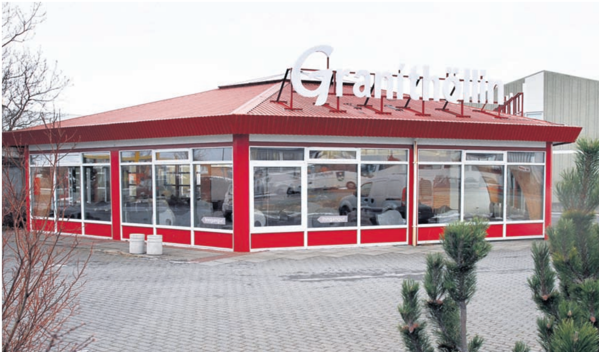
Graníthöllin er til húsa að Bæjarhrauni 26 í Hafnarfirði. Þar er gott aðgengi og tekið vel á móti fólki.