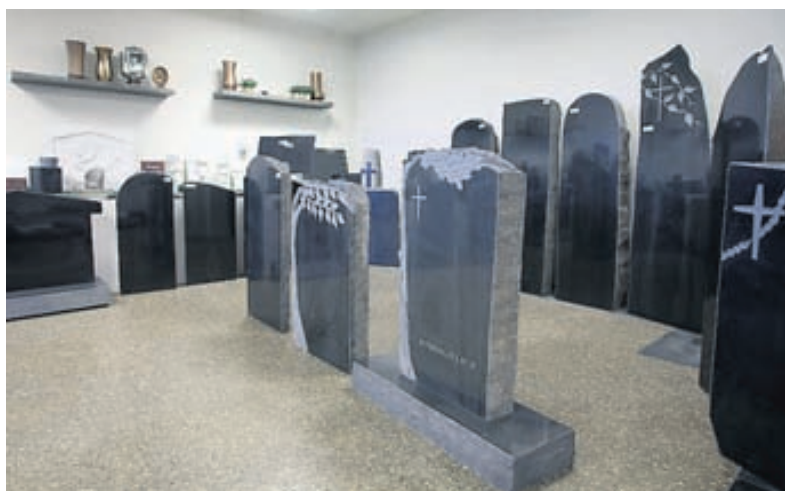
Legsteinar úr íslensku stuðlabergi eru einstaklega fallegir og hafa notið vinsælda í gegnum árin.