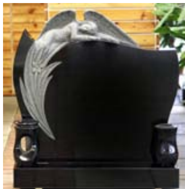
Granítluktir og vasar í stíl við legsteininn er nýjung sem hefur verið vel tekið.

Þá tekur Graníthöllin að sér viðgerðir og viðhald á legsteinum. „Það borgar sig að gera við