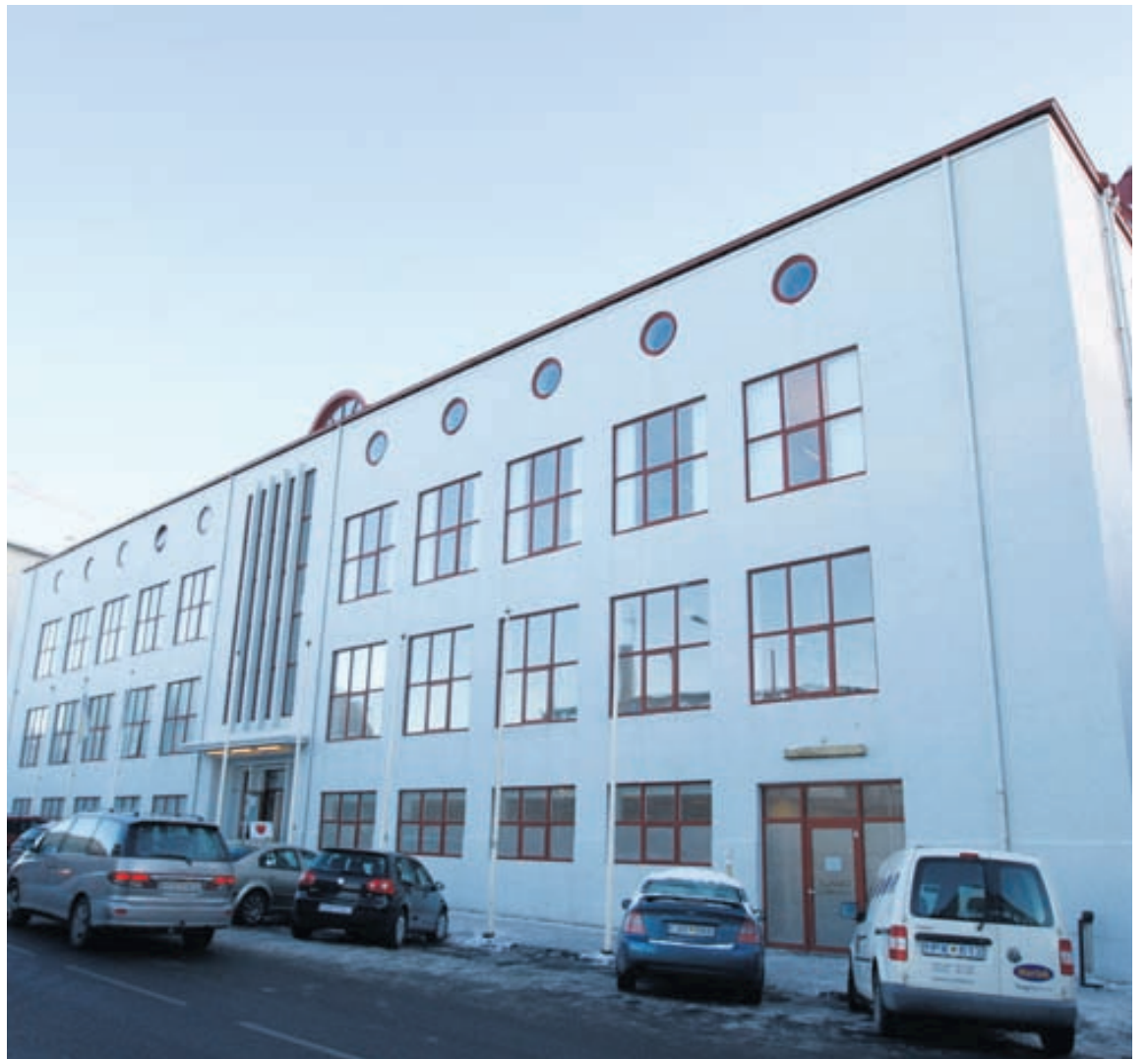
Vímulaus æska er til húsa að Borgartúni 6. Foreldrasíminn er 581-1799. Hann er opinn allan sólarhringinn.