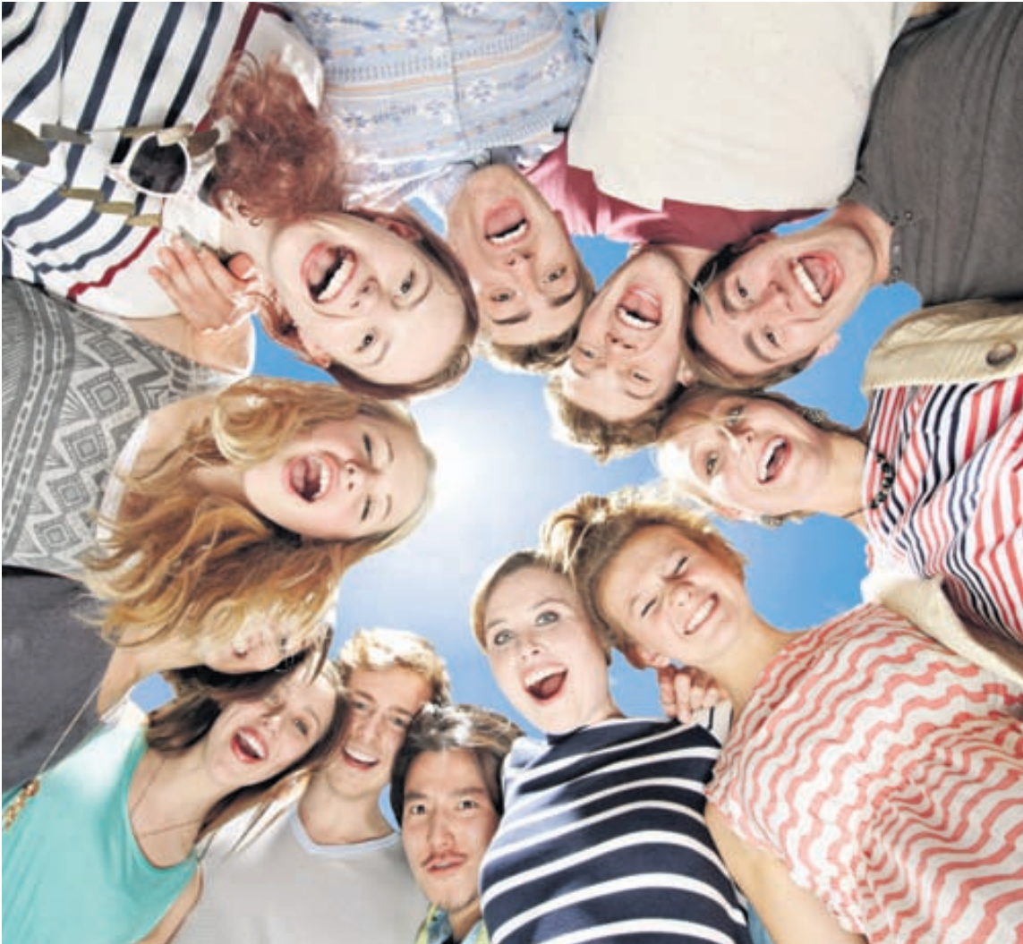
Samstarf Vímulausrar æska - Foreldrahús við hina ýmsu aðila lýtur bæði að forvörnum og námskeiðshaldi.