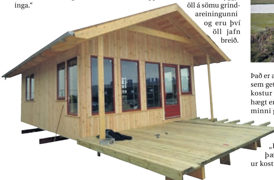
Sperrur og gólfbitar í rammahúsin frá BYKO koma samsett.

Nánari upplýsingar má finna á heimasíðu BYKO, byko.is, þar sem meðal annars er hægt að horfa á myndband af byggingu rammahúss. Einnig eru allar upplýsingar veittar í síma 515-4000.