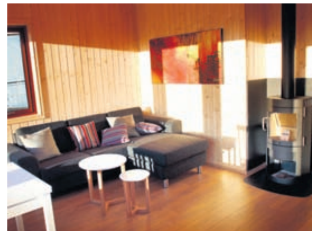
Rammahúsin frá BYKO henta bæði einstaklingum og fyrir aðila í ferðabjónustu.