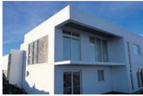
Einingahús frá BM Vallá við Prúðsali 2 í Kópavogi.

Þess má geta að á síðasta ári seldi BM Vallá fullbúið einingahús til Noregs sem vakið hefur mikla athygli og verður fróðlegt að fylgjast með framhaldinu þar.