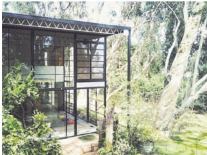
Það tók fimm menn einungis 16 tíma að reisa stálgrindina og einn mann þrjá daga að ljúka við þakið.