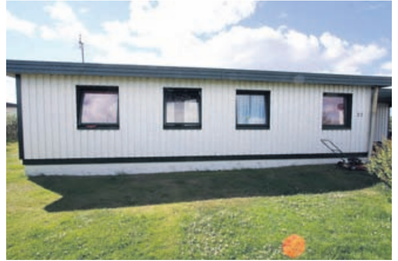
Viðlagasjóðshúsin ættu flestir að kannast við, enda staðsett víða um land.