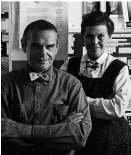
Charles og Ray Eames hönnuðu einingahúsið eftir sínum eigin þörfum.

Af þeim 25 húsum verkefnisins sem reist voru þykir Eames-húsið bera af, bæði hvað varðar arkitektúr og sem þægilegt og nothæft íbúðarhús. Eames-hjónin bjuggu sjálf í húsinu til æviloka. Fjölskylda þeirra á húsið enn og barnabörn þeirra nota það. Þá er vinnustofa þeirra enn þá virk í húsinu.