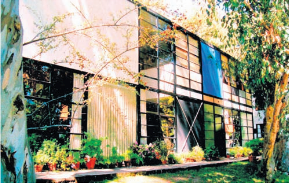
Eames-húsið er samsett úr stálrómmum og færanlegum veggjum og rennihurðum.