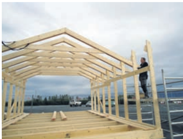
Burðarviður í húsin kemur tilsniðinn í réttum stærðum og lengdum ásamt festingum með greinargóðum leiðbeiningum.