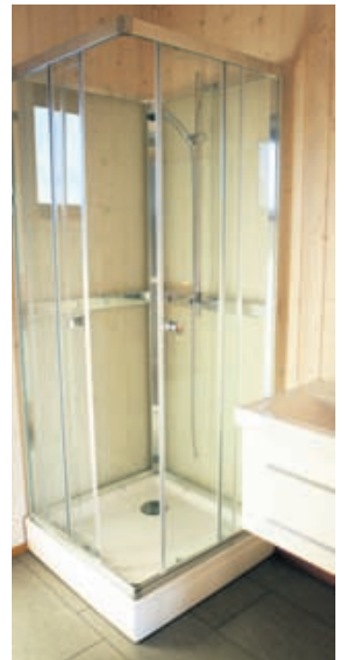
Hægt er að kaupa rammahús með fullbúnu baðherbergi; með sturtuklefa, salerni og baðskáp með handlaug.