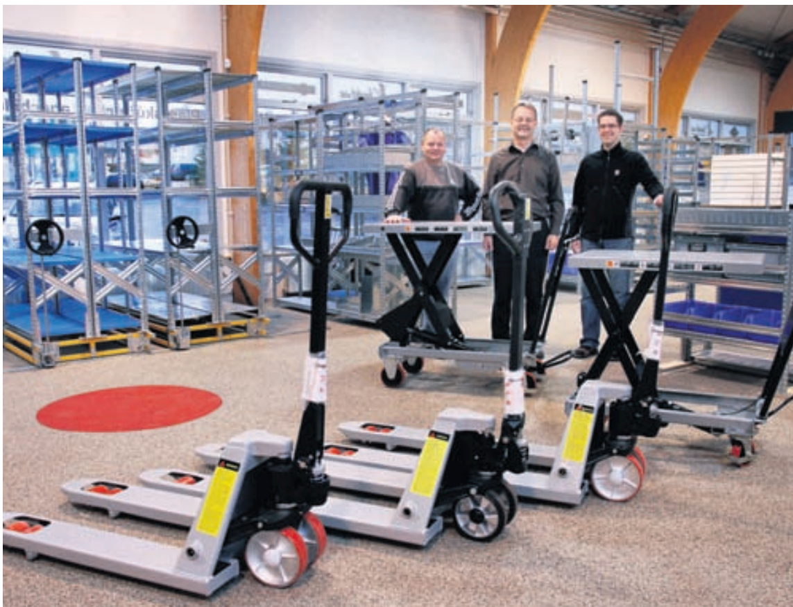
Auk hillukerfa býður Ísold ehf. upp á sérsmíðaðar lausnir.