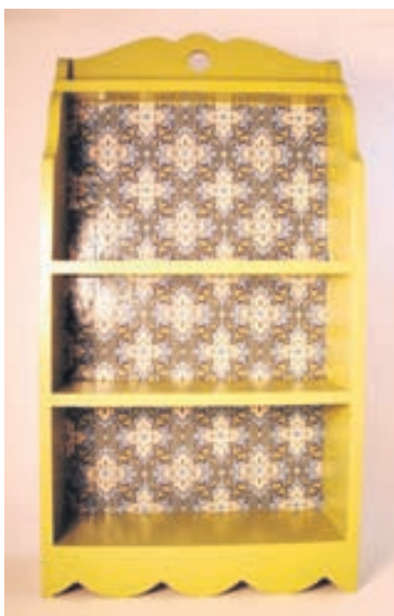
Auðvelt er að hressa upp á gamla hillu með því að veggfóðra bakið á henni.