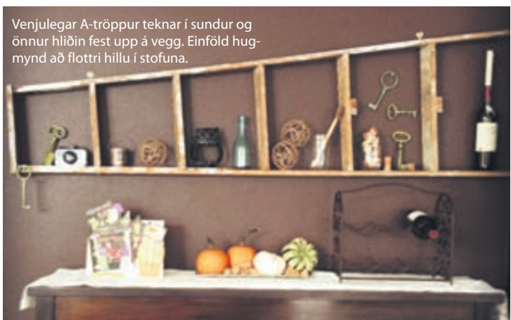
Venjulegar A-tröppur teknar í sundur og önnur hliðin fest upp á vegg. Einföld hugmynd að flottri hillu í stofuna.