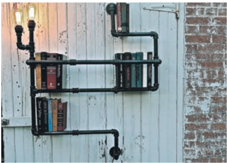
Rör geta þjónað fleiri en einum tilgangi. Hér hafa forlata bókahillur verið smíðaðar úr rörum.