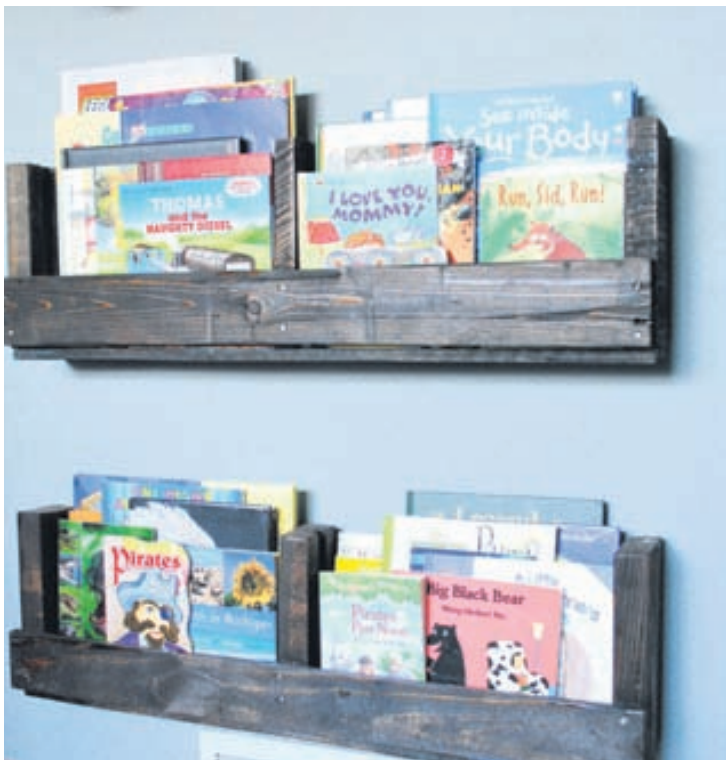
Hér hefur vörubretti verið tekið í sundur og búnar til fallegar bókahillur úr því.

Þegar talað er um hillur hugsa flestir um hina hefðbundnu tegund úr viði eða málm. Hillur geta hins vegar verið í nánast hvaða formi sem er og margar flottar og óvenjulegar hillur sem skreyta híbýli fólks og geyma hina ýmsu muni þess. Hér má sjá nokkrar óvenjulegar hillusamstæður.