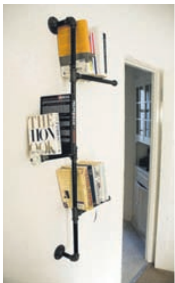
Önnur gerð af rörahillu.