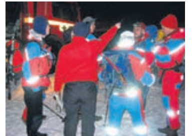
Endurmenntun björgunarsveitarmanna er þeim afar nauðsynleg.