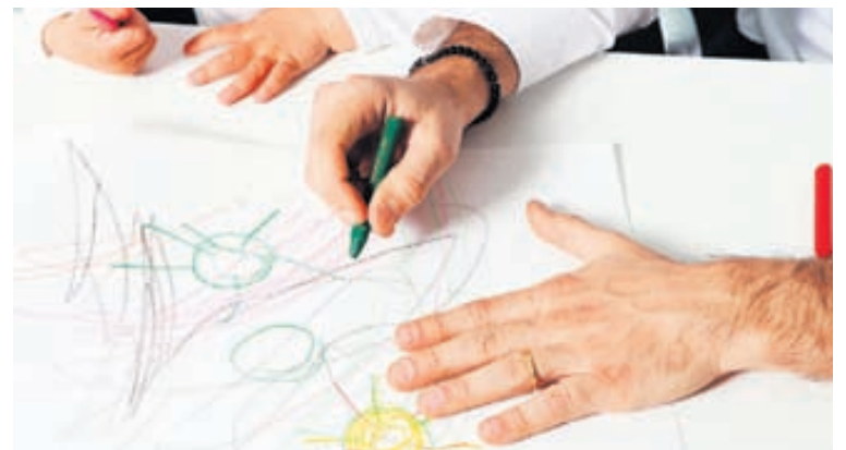
Velgengi í námi byggir á góðri námstækni og skipulagi.