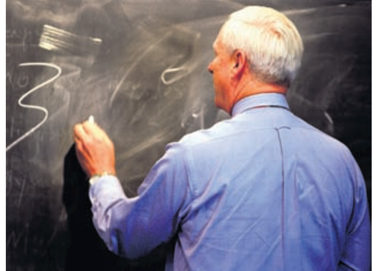
Þegar haustið nálgast og fjöldi tækifæra býðst til að sækja námskeið er tilvalið að kanna hvernig málum er háttað hjá stéttarfélaginu.

Fjöldi félagsmanna í Eflingu er í kringum 18 þúsund. Efling