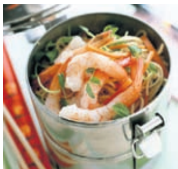
Einfalt er að matreiða kínverskar núðlur með risarækjum. Spennandi og gómsætur réttur í nestisboxið.

Heimagert skólanesti er lostæti þegar vel tekst til og sparar margar krónur þegar hagsýni er höfð að leiðarljósi. Nesti heiman úr eldhúsi þarf hvorki að samanstanda af upphituum afgangum né tilbreytingarleysi í útfærslum og auðvelt er að útbúa freistandi máltíðir í nestisboxið.