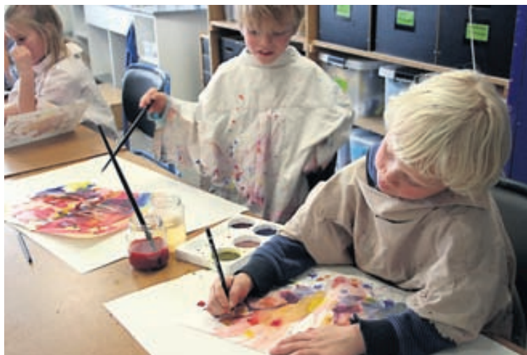
Fjölbreytt úrval námskeiða er í boði fyrir börn og unglinga hjá Myndlistaskólanum í Reykjavík.