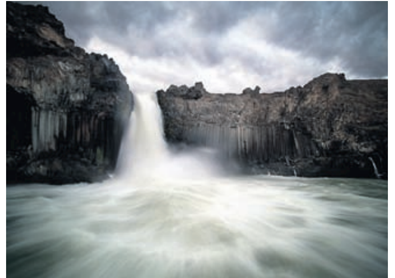
Aldeyjarfoss á þungbúnum degi. Myndir Daníels má sjá á síðunni Augnablik á Akureyri á Facebook.

Spurður hvort hann ætli að leggja ljósmyndun fyrir sig er hann þó á