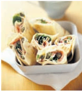
Mexíkóskar pönnukökur eru seðjandi, bragðgóðar og passa við flest. Ómótstæðilegar með reyktum laxi, kapers, rauðlauk og káli á milli kennslustunda.