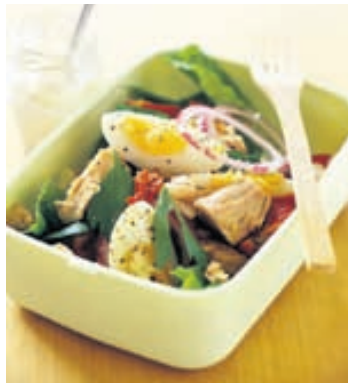
Salade Niçoise er ljúffengur kostur og hollur. Kál, kartöflur, túnfiskur, tómatar, rauðlaukur, egg og ólífur með salatsósu úr rauðvinsedik, graslauk, salti og pipar.