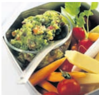
Brakandi ferskt grænmeti er viðeigandi snakk yfir skólabókunum. Unaðslega gott með heimagerðu lárperumauki.