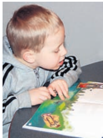
Nemendur á öllum aldri geta fundið eitt-hvað við sitt hæfi á vef Námsgagnastofnunar.

Á vef Námsgagnastofnunar er að finna fjölbreitt efni sem tengist öllum námsgreinum grunnskóla. Þar má fá upplýsingar um alla prentaða titla, sækja efni til útprentunar, hljóðbækur, myndir og gagnvirk efni. Gagnvirka efnið er fyrir ýmsan aldur, allt frá byrjendalæsi til stórra upplýsingavefja um afmörkuð fræðasvið. Íslenskuefni er fyrirferðarmikið á vefnum og þeir sem eru að taka sín fyrstu skref í átt að lestri geta æft sig á ýmsa vegu og hlustað á efni. Það sama má segja um þá sem vilja æfa stafsetningu eða eru að læra íslensku sem annað mál. Efnið á vefnum er vel kynnt í skólum landsins og notað á öllum skólastigum en hér er vert að benda á nokkra vefi sem henta einnig sérstaklega vel fyrir allan almenning. Fuglavefurinn er dæmi um vef sem er mikið notaður af almenningi en hann hefur að geyma fjölbreyttan fróðleik um íslenska