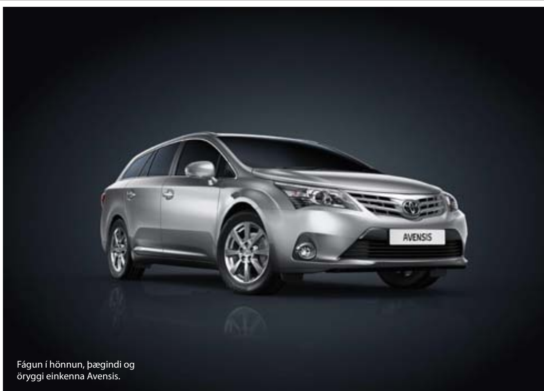
Fágun í hönnun, þægindi og öryggi einkenna Avensis.