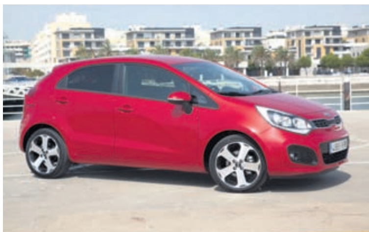
Heildarútlit Kia Rio þykir vel heppnað, með rennilegum hliðum og sportlegu yfirbragði.