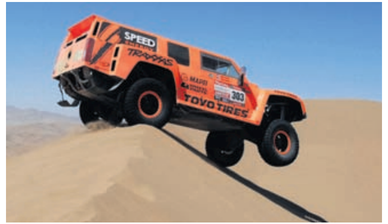
Hummer-bifreið ekið yfir sandöldu í Síle.

Keppendur aka á sérútbúnum jeppum og torfærumótörhjólum. Farið er yfir mjög erfitt landsvæði, yfir sandöldur, gegnum drullupytti, ósléttar heiðar og grjótmulning. Vegalengdirnar eru ekki litlar eða um 800 til 900 kílómetrar á dag.