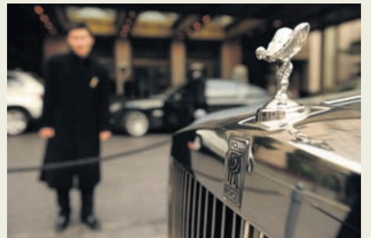
Rolls Royce fyrir utan lúxushótel í Sjanghæ í Kína.