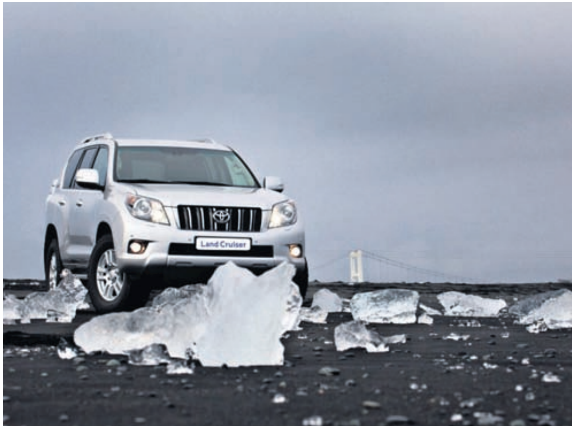
Land Cruiser 150 við útfall Jökulsár á Breiðamerkursandi. Jeppi sem hentar Íslendingum vel enda er hann vinsæll.