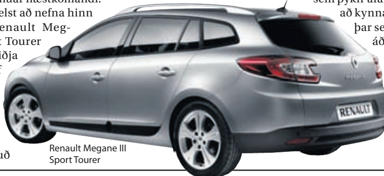
Renault Megane III Sport Tourer