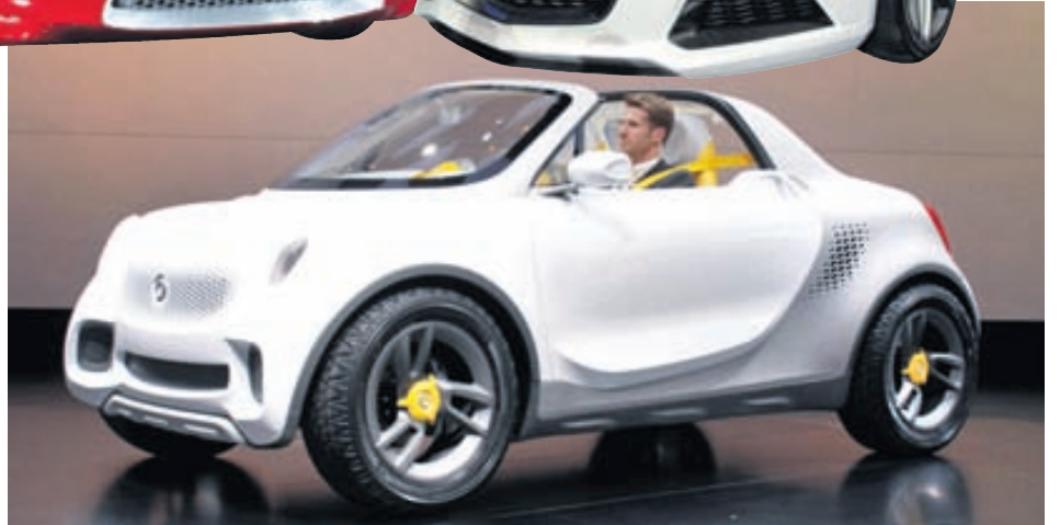
Smart For Us hugmyndabíllinn var einn af fjölmörgum bílum sem kynntir voru til sögunnar á fyrsta degi bílasýningarinnar í Detroit. Sýningin verður opin almenningi frá 14. til 22. janúar.

hygli enda eru þeir oft íburðarmikilir á að líta enda fátt til sparað. Oftar en ekki fara þeir þó ekki óbreyttir á göturnar. Hér má sjá nokkra hugmyndabíla sem kynntir voru á fyrstu dögum bílasýningarinnar.