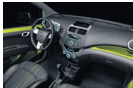
Smáatriðin skipta máli í Spark. Tekið er tillit til allra þátta í hönnuninni þar sem aðgengi og útlit fara hönd í hönd.