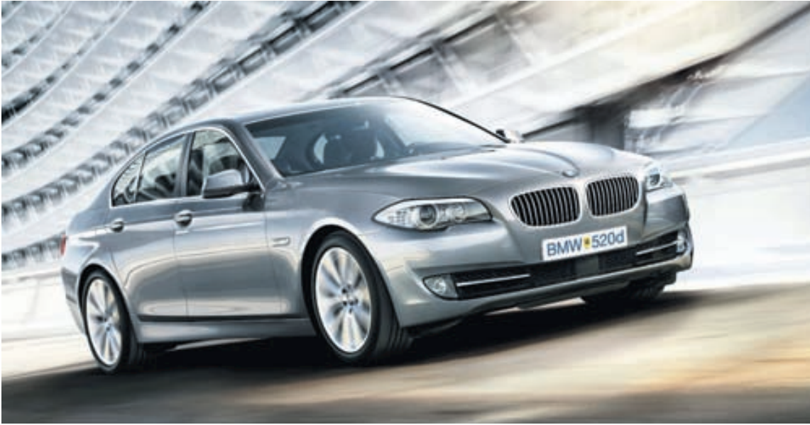
BMW 520d er nýr og glæsilegur bill frá BMW. Í honum eru EfficientDynamics-tækninýjungar og eyðir hann aðeins 5,0 l á hverja 100 kílómetra.