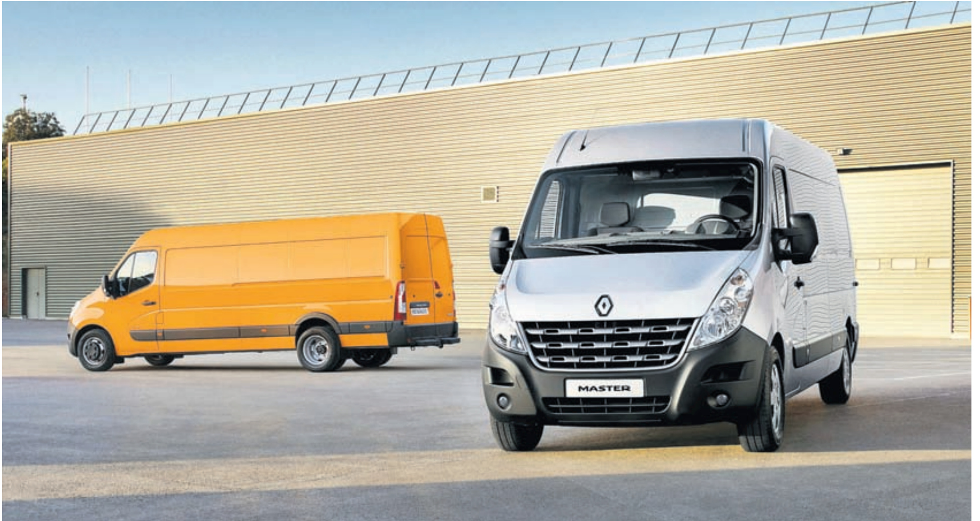
Nýi Renault Master-sendibíllinn er til í ýmsum lengdum.

Kynningarblað sendibílar, eldsneyti, metan, rafmagn, fjölskyldubílar, vistakstur