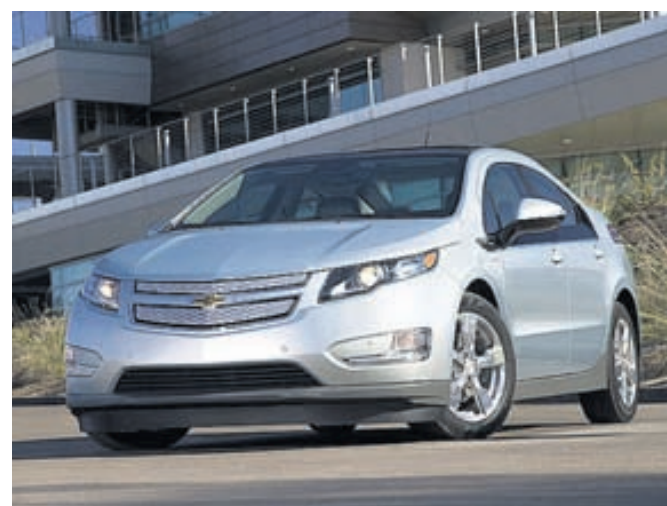
Chevrolet Volt er skilgreindur sem fyrsti langdrægi rafmagnsbíllinn.