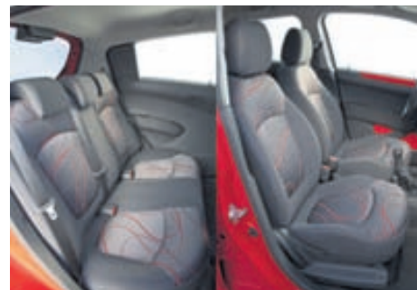
Í Spark eru framsætin það há að fólk sest inn í hann en ekki ofan í hann.