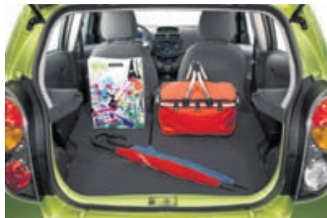
Nettur Spark er rúmbetri en flesta grunar og nýttist vel þegar verslunarferðirnar eða ferðalögin eru annars vegar.