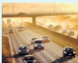
Notkun Toyo-harðskeljadekkjanna minnkar svifryksmengun.

Hið virta Tire Review Magazine gerir árlega skoðanakönnun meðal sjálfstætt starfandi hjólabarðasala í Norður-Ameríku og Toyo-dekkin hafa borið sigur úr býtum í þeirri könnun síðustu sjö ár af átta. Árið 2007 voru dekkinn valin besta alhliða vörumerkið. Bílabúð Benna er umboðsaðili Toyo Tires á Íslandi.