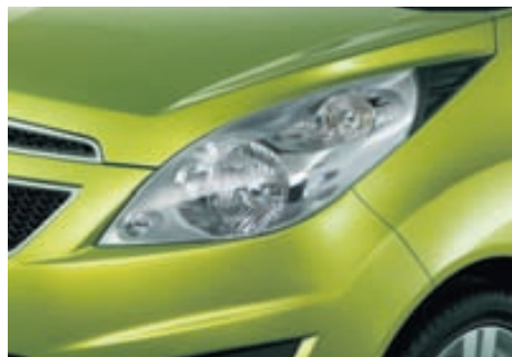
Snilldarlega stílfærð aðalljósin gefa Spark sportlegt og áberandi viðmót á veginum.