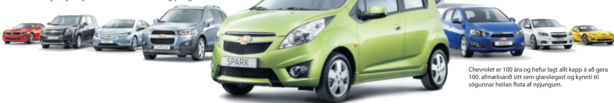
Chevrolet er 100 ára og hefur lagt allt kapp á að gera 100. afmælisárið sitt sem glæsilegast og kynnti til sögunnar heilan flota af nýjungum.