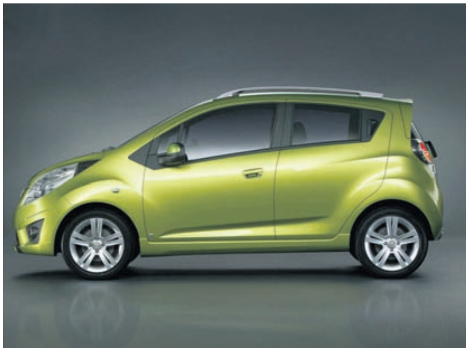
Háreist hjólabrettin einkenna sportútlitið á Spark. Form bílsins og útlit gegna því hlutverki að gera hann notadrygrí, þægilegri og flottari.