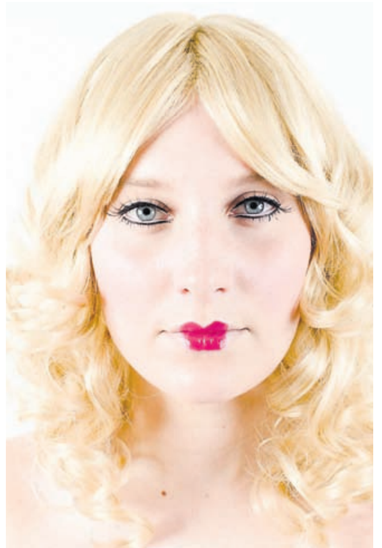
Sýningin Dúkka verður opnuð í Listasafni Reykjanesbæjar í dag.