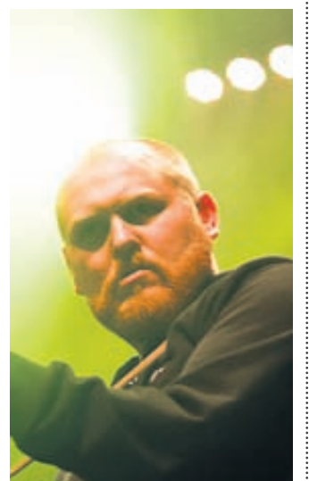
Tónlistarþæringin stendur undir nafni.

Óhætt er að lofa góðri stemningu á stóra sviðinu bæði föstudags- og laugardagskvöld á Ljósanótt. Fjöldi flottra tónlistarmanna mun halda okkur glæsilega tónlistarveislu, bæði gestir og heimamenn, og enginn vafi á að tónlistarþæringin mun standa undir nafni. Þeir sem fram koma á föstudeginum eru Lifun, Hellvar, Who Knew, Of Monsters and Men og Blaz Roca og á laugardeginum Friðrik Dór, Magnús og Jóhann, Baggalútur, Helgi Björns og Reiðmenn vindanna og síðast en ekki síst hljómsveitin Valdimar sem mun ljúka kvöldinu eftir glæsilega flugeldasýningu.