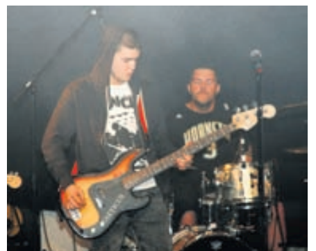
Nýjar hljómsveitir fá tækifæri til að spreyta sig.

Í tengslum við Ljósanótt hafa í mörg ár verið haldnir sérstakir tónleikar fyrir yngri kynslóðina í Frumleikhúsinu. Þarna hefur gefist tækifæri fyrir nýjar hljómsveitir að reyna sig og margir af okkar bestu tónlistarmönnum stígu sín fyrstu spor við þetta tækifæri. Menningarhúsið ungs fólks í Reykjanesbæ, 88 húsíð, stendur að tónleikunum og að venju kemur fjöldi hljómsveita fram, nöfn þeirra má sjá á vefnum ljosanott.is. Tónleikarnir eru að sjálfsgöðu vímuefnalausir og eru fimmtudagskvöldið 1. september og hefjast kl. 20.