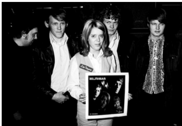
Söngvarar af Suðurnesjum flytja lög Hljóma, Villa Vill, Flowers og Trúbrots.