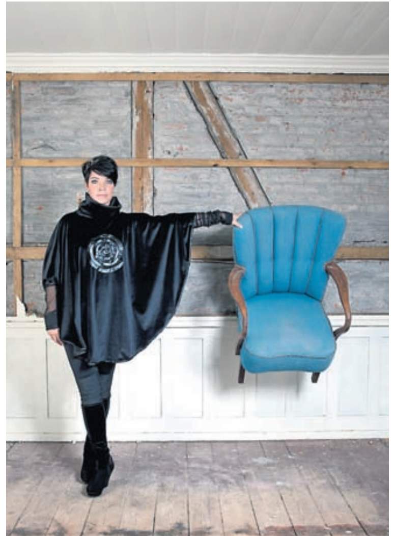
Klæðnaður frá Spiral hönnun verður sýndur í Víkingaheimum á viðburðinum Klikkaður kærleik.