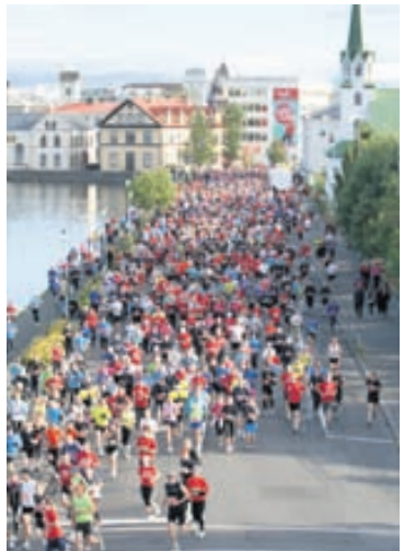
Reykjavíkurmaraþon verður á sínum stað.

10-22 LJÓSMYNDIR ÚR ÍSLANDSHEIMSÓKN 1955 Ljósmyndir ljósmyndarans og myndlistarmannsins Kurt Dejmo frá Íslandsheimsókn hans 1955. Þjóðminjasafn Íslands, Suðurgötu 41