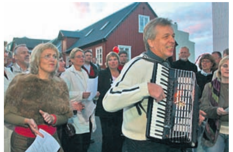
Harmonikkutónar hljóma um alla borg.

12-23 YFIRHÖFUD 2011 Hattasýning briggja ungra hattagerðarmanna. Eggert feldskerí, Skólavörðustíg 38