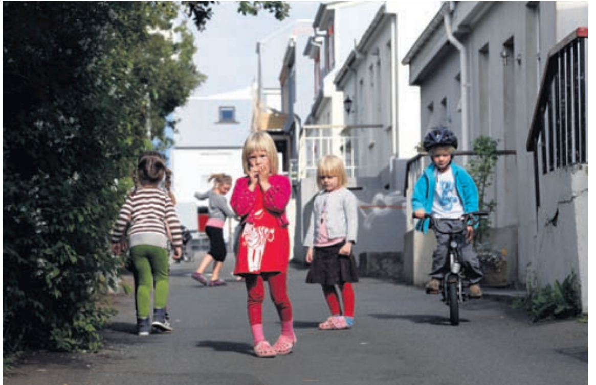
Íbúar Haðarstígs berjast nú fyrir því að leyfa einungis bílaumferð íbúa um götuna.