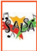
Salsa frá Baðhúsinu