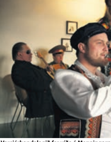
Varsjárbandalagið fer víða á Menningarnótt.