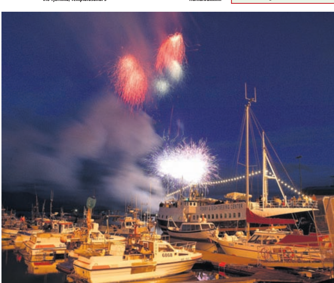
Flugeldasýning í boði Vodafone verður klukkan 23.