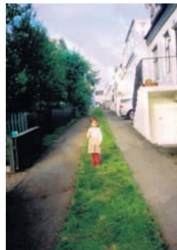
Íbúarnir lögðu túnpökur á götuna á Menningarnótt fyrir tveimur árum og vildu með því þrýsta á ósk sína um lægri ökuhraða um götuna

aftur þátt og þá sem skipulagður dagskrárliður Menningarnætur. Íbúar gáfu heimabakstur og kaffi og héldu kompusölu í götunni ásamt því að frumsýna heimildarmynd í Litla garði. Í ár verður dagskráin ekki síðri.