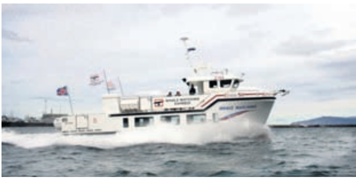
Sérferðir bjóða upp á siglingu milli Sundahafnar og Hörpunnar.

● SJÓFERÐIR OG FRÍTT Í STRÆTÓ Miðborgin verður meira og minna lokuð fyrir bílaumferð á Menningarnótt. Fjöldmörg bílastæði eru í jaðri hátíðarsvæðisins og fjöldmörg bílastæðahús opin. Sektað verður fyrir stöðubrot eins og gert hefur verið á fjölmönnum viðburðum í sumar.