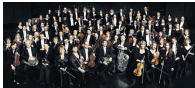
Sinfóníuhljómsveitin býður upp á tvenna tónleika í Eldborgarsal Hörpu.