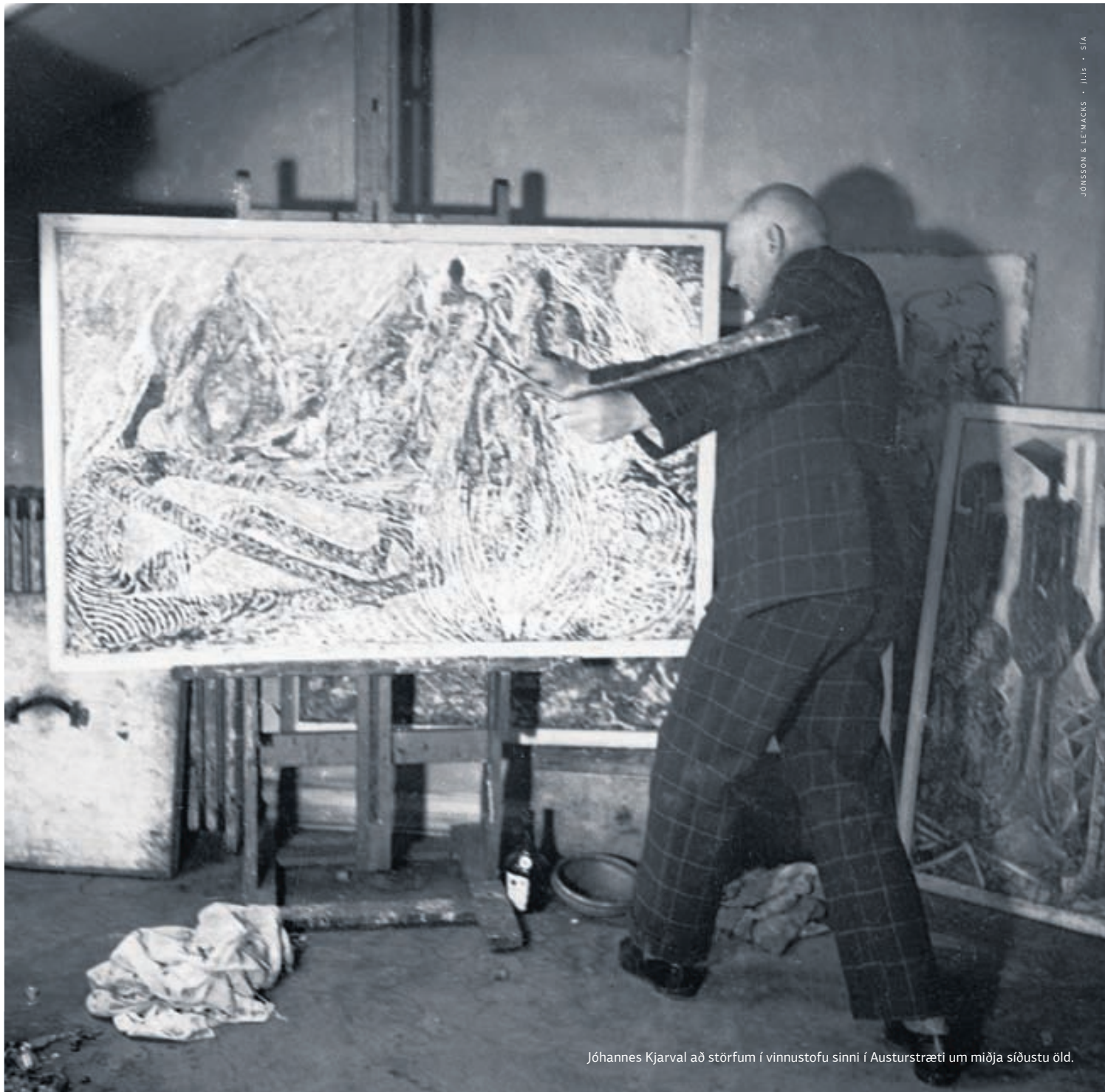
Jóhannes Kjarval að störfum í vinnustofu sinni í Austurstræti um miðja síðustu öld.