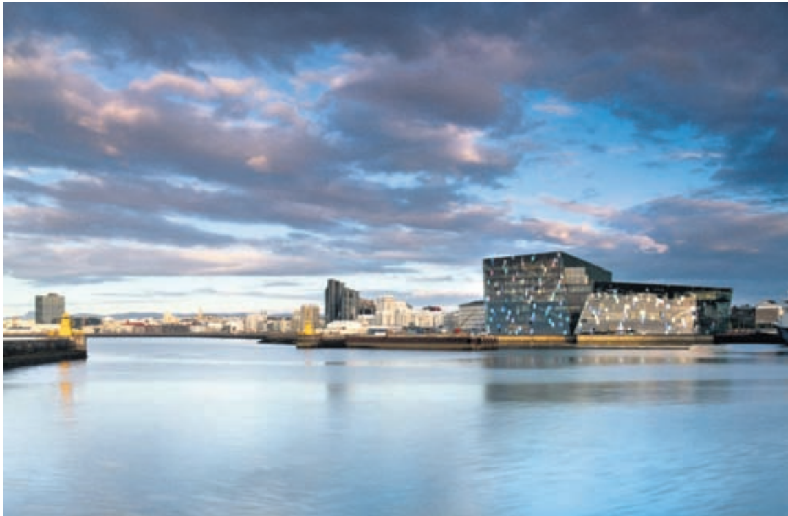
Harpa mun skína í sinni fegurstu mynd á Menningarnótt þegar ljós kvikna loks í glerhjúp hennar.