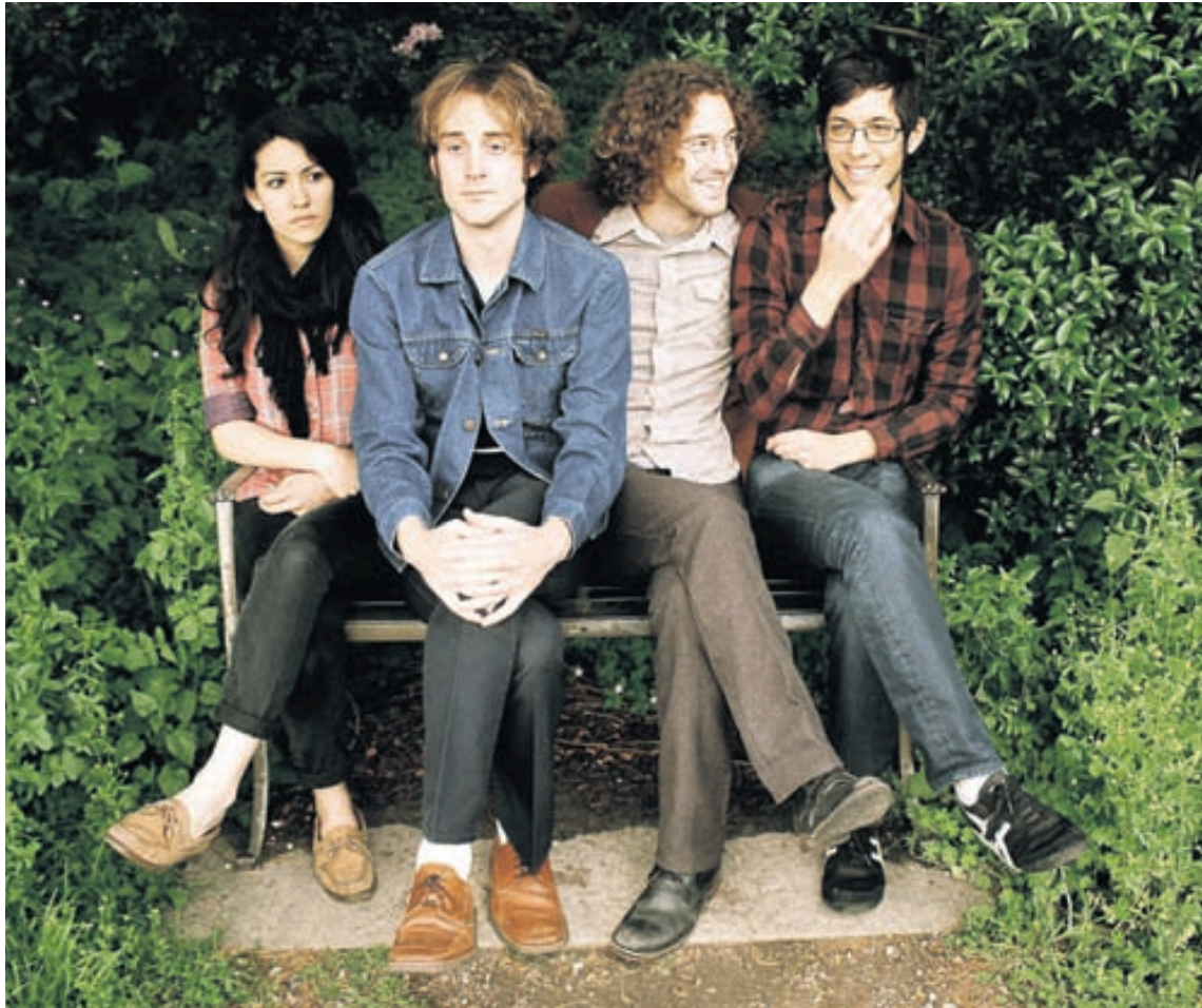
Hin unga og efnilega rokkhljómsveit Tomten frá Seattle spilar í Ráðhúsi Reykjavíkur klukkan 18 og 21.

20-23:30 GAKKTU UM BORD Í HVALASETUR ELDINGAR Lífandi tónlist og skemmtilegt andrúmsloft í Hvalasetrinu við Ægisgarð. Hvalasetur Eldingar, Ægisgarði