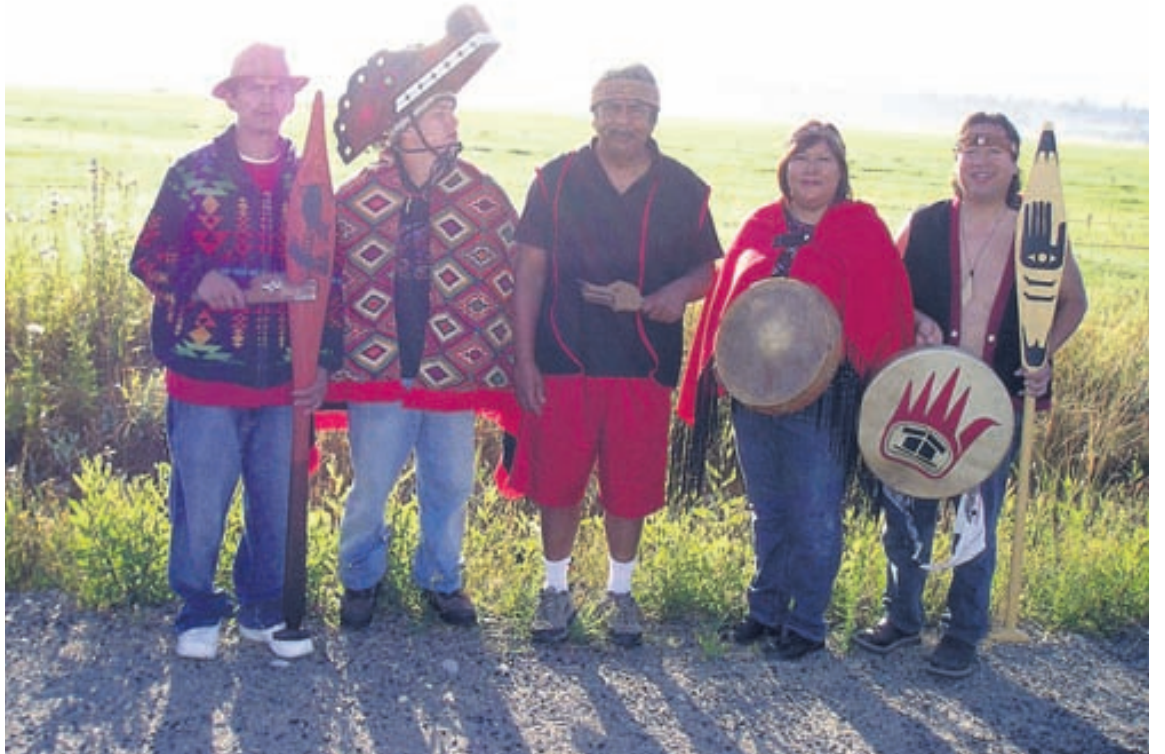
Sex fulltrúar indíánaflokksins Quileute munu segja sögur og stíga frumbyggja- og trúardansa.

Stíll - Laugavegi 58, 101 Reykjavík sími: 551 4884 - www.stillfashion.is