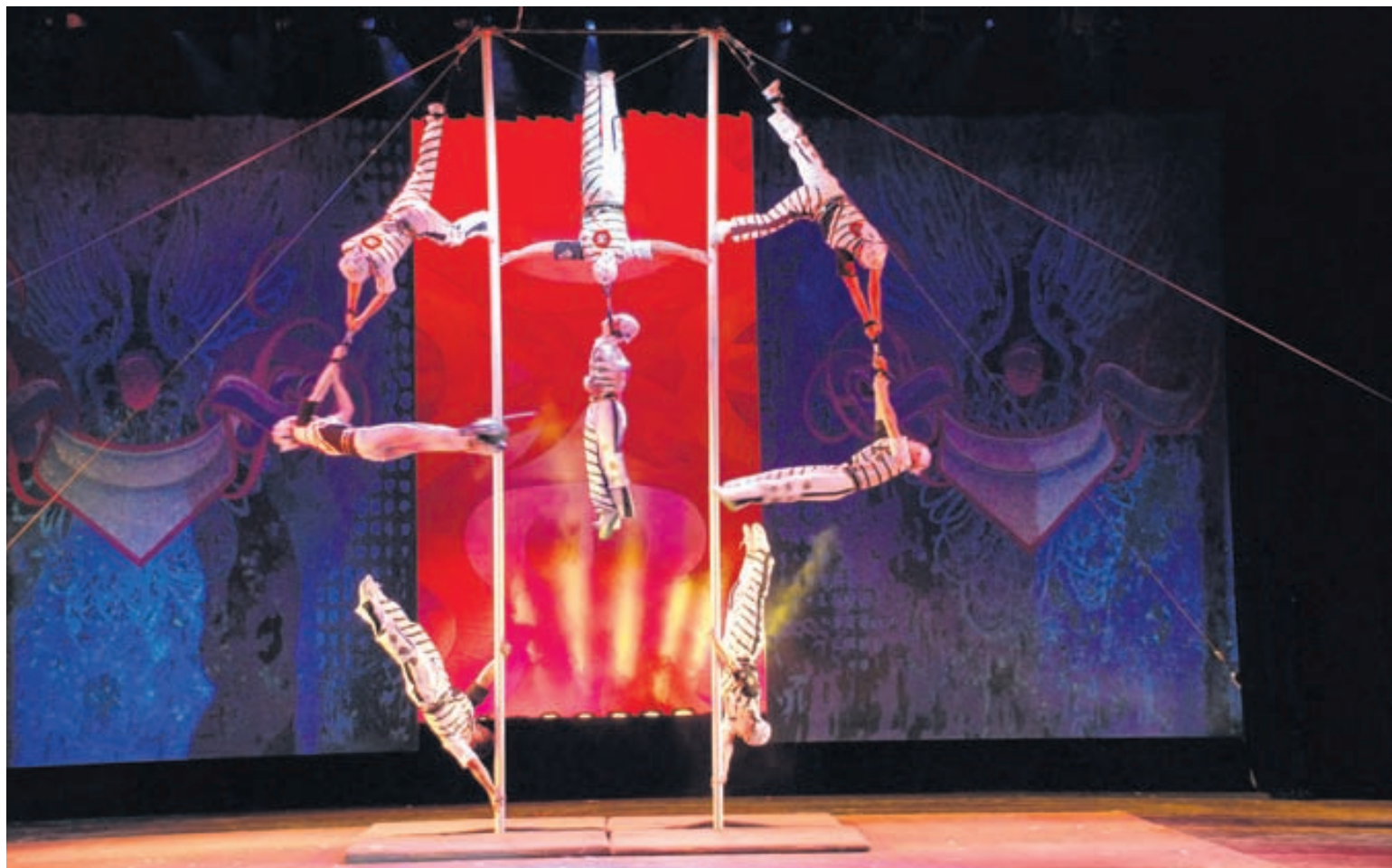
Kínverskir loftfimeikamenn munu leika listir sínar í Hörpu á laugardaginn.

14-16 PARTNER YOGA Jógar para sig saman og sýna partner-yoga æfingar. Samvinna, traust og einbeiting. Austurvöllur