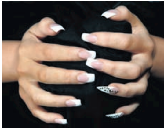
Nemendur við Naglaskóla Professionalnails læra um allt sem viðkemur nöglum.

Engin inntökuskilyrði eru í Naglaskólann önnur en sextán ára lágmarksaldur og hafsjór af þolin-