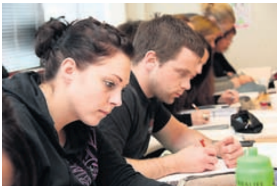
Námsmarkmið Menntastoða er meðal annars að stuðla að jákvæðu viðhorfi námsmanna til áframhaldandi náms.