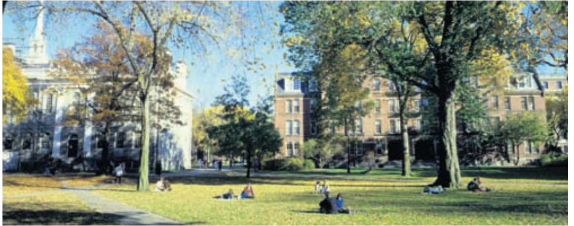
Harvard-háskóli ber af öðrum skólum á sviði félagsvísinda ef marka má nýja úttekt QS World University Rankings.