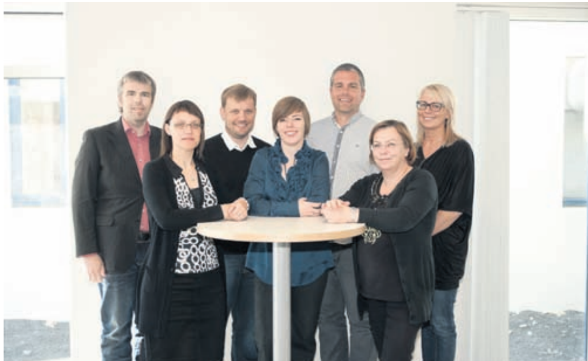
SÍMEY stuðlar að því að einstaklingar á Eyjafjarðarsvæðinu hafi aðgang að hagnýtri þekkingu á öllum skólastigum.