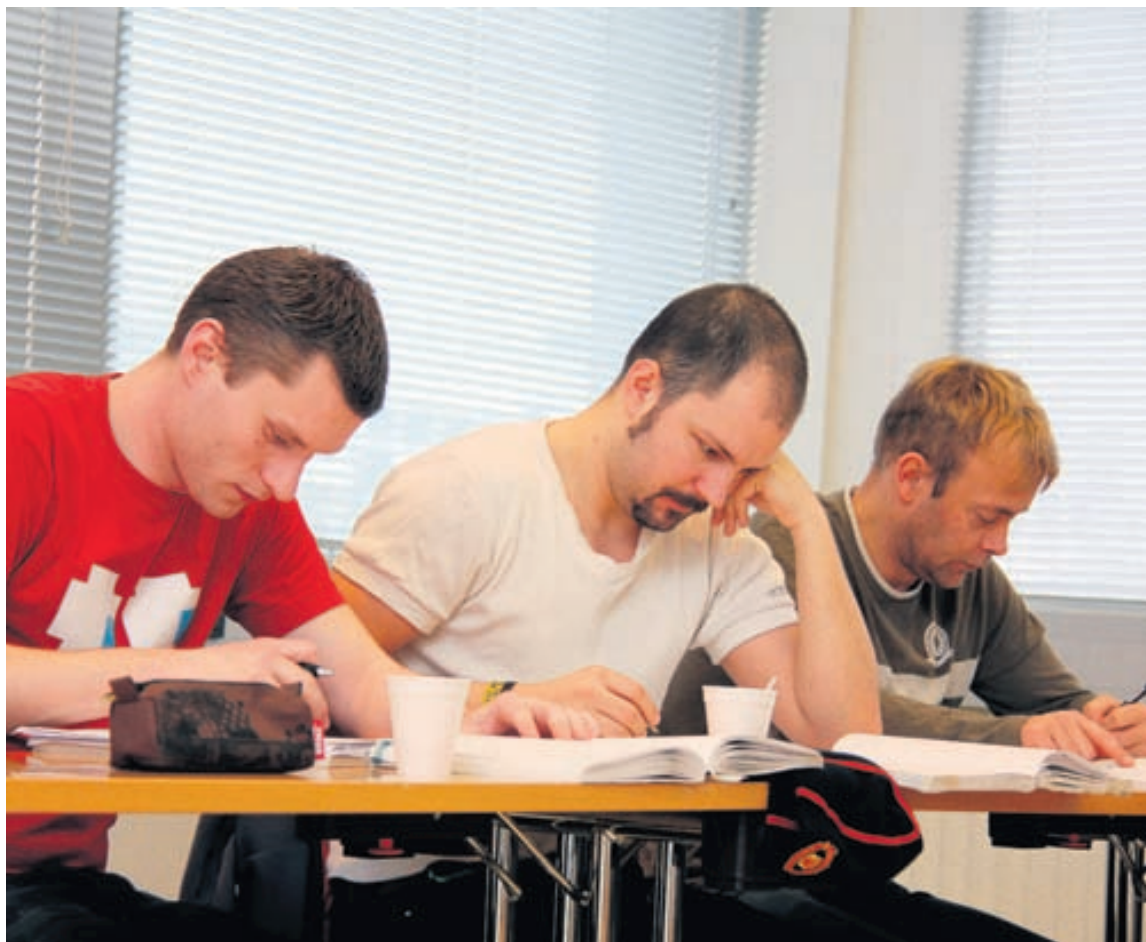
Anney segir að námsleiðirnar Aftur í nám og Grunnmenntaskólinn hafi verið vinsælar hvor í sínu lagi.