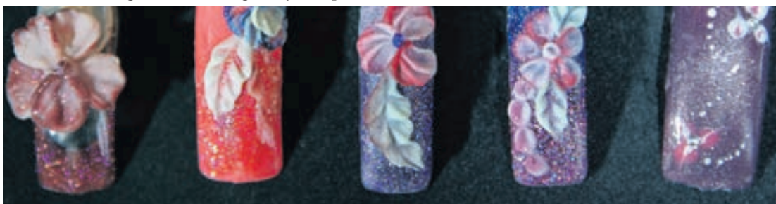
Ímyndunaraflinu gefinn laus taumur.