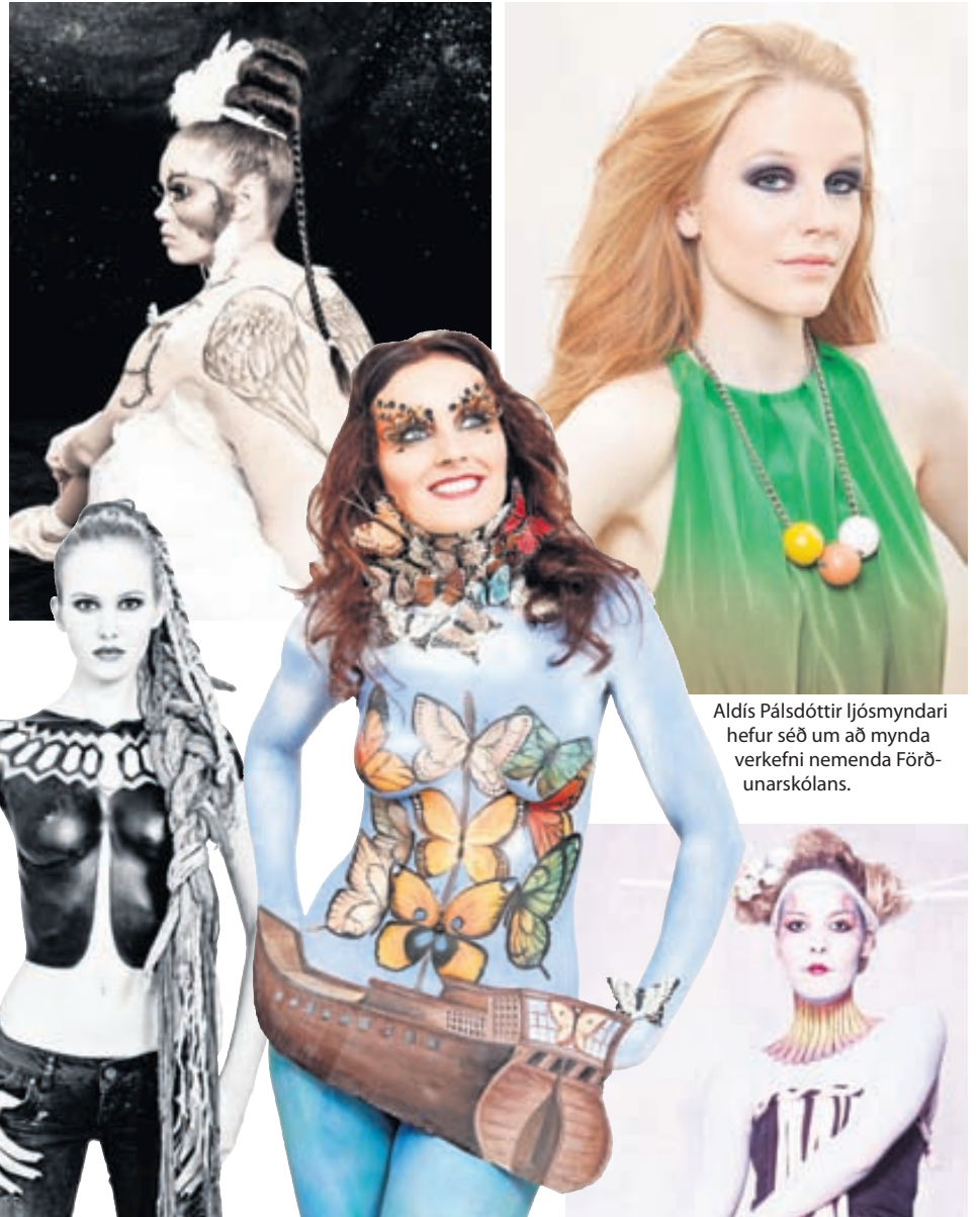
Aldís Pálsdóttir ljósmyndari hefur séð um að mynda verkefni nemenda Föðunarskólans.

Kennsla Föðunarskóla Snyrtiakademiunnar fer fram að Hjallabrekku 1 í Kópavogi. Frekari upplýsingar um námið er að finna á vefsíðunni www.snyrtiakademian.is og á Facebook undir Föðunarskóli snyrtiakademiunnar. Þá má senda póst á skoli@snyrtiakademian.is eða hafa samband í síma 553 7900.