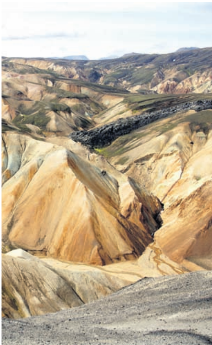
Fjölbreytt landslag, sérstakt en viðkvæmt lífríki, öræfaauðn og kyrrð eru megineinkenni Friðlands að Fjallabaki, en þangað leita árlega þúsundir manna til að njóta þessara náttúrugæða.