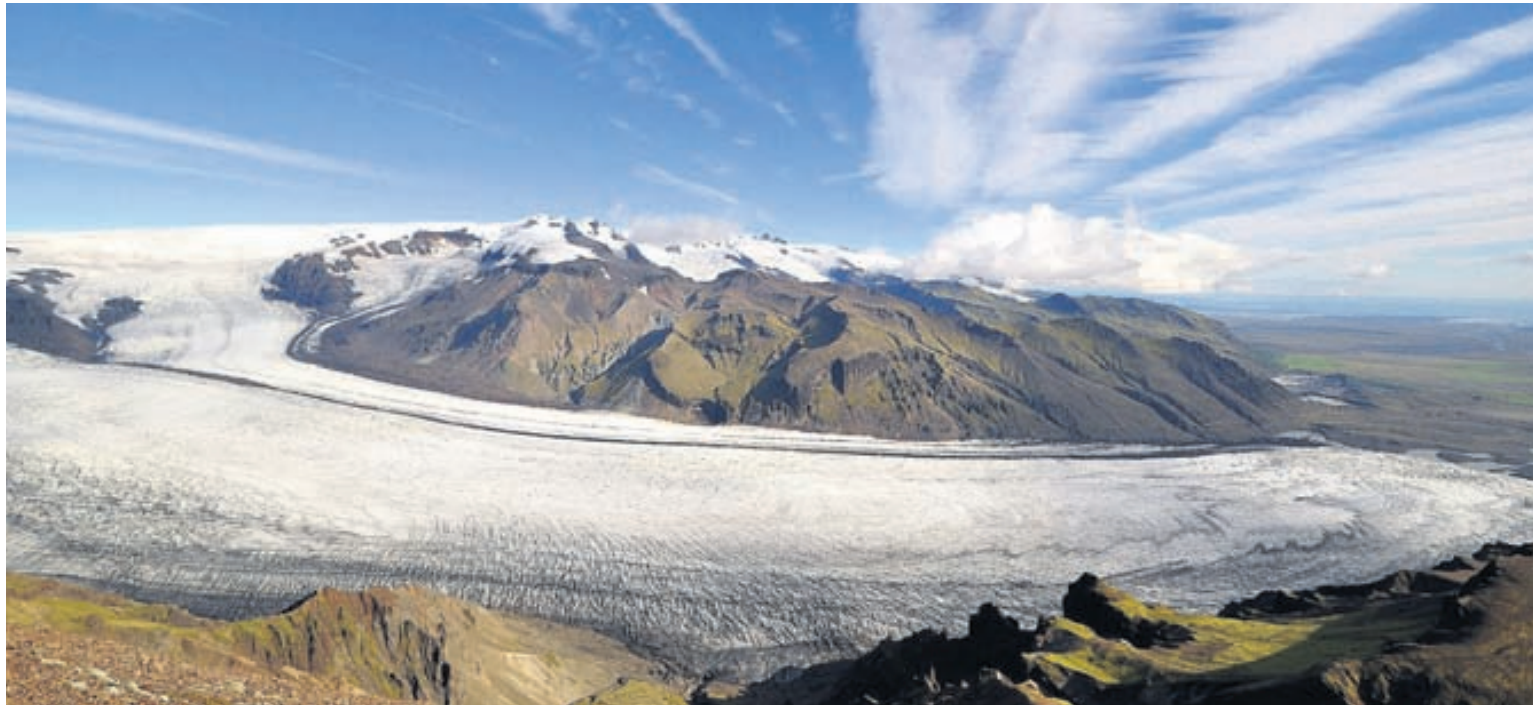
Innan Vatnajökulsþjóðgarðs er að finna rjómann af íslenskri náttúru. Horft yfir Skaftafellsjökul af Kristínartindum.