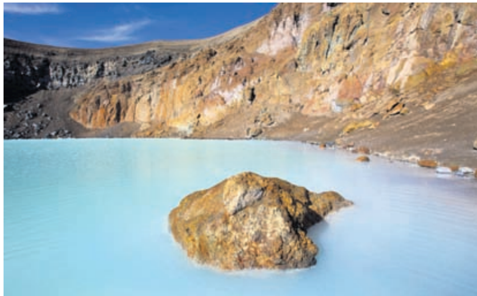
Mörgum þykir gott að svamla um í Viti.

Loks bendir hann á að á sumrin fari landverðir í Öskju og Herðubreiðarlindum í fræðslugöngur sem gestum er frjálst að taka þátt í. Nánari upplýsingar á www.vjp.is .