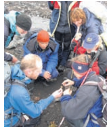
Agnes segir margt skemmtilegt að sjá á austursvæðinu.