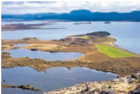
Mývatn varð til þegar Laxárhraun eldra stíflaði farveg Laxár fyrir um 3.800 árum.