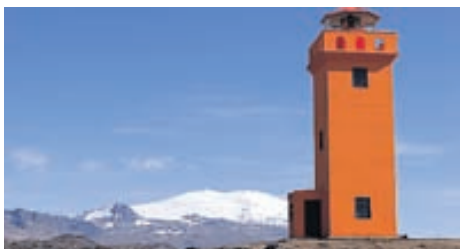
Snæfellsjökull er virk eldkeila sem hefur hlaðið upp í mörgum hraun- og sprengigosum á síðustu 800 þúsund árum.

Lífriki Mývatns er einstakt og er nafn vatnsins dregið af þeim aragrúa af mýi sem þar er. Þar er að finna fleiri andartegundir en á nokkrum öðrum stað á jörðinni. Í Mývatnssveit er náttúrufrá fjölbreytt og landslag sérstætt, enda mótað af miklum elds-umbrotum. Mývatn er á flekamótum jarðskorpufleka Norður-Ameríku og Evrasíu. Þá rekur í sundur um tvo sentimetra á ári en á samskeytunum kemur upp hraunkvika sem fyllir í skarðið og er eldvirkni þarna mikil. Dimmuborgir og Hverfjall eru meðal þeirra náttúrugersema sem eru á svæðinu og verða friðlýst í dag, hinn 22. júní. Umhverfisstofnun er með gestastofu, sem var nýlega endurnýjuð, við Mývatn og er hægt að fræðast þar nánar um svæðið.