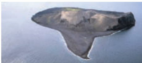
Loftmyndir hafa verið teknar reglulega af Surtsey síðan í febrúar 1964.

Þjóðgarðurinn Snæfellsjökull er á utanverðu Snæfellsnesi á Vesturlandi. Hann er um 170 km 2 að stærð og eini þjóðgarður landsins sem nær að sjó. Snæfellsjökull er 1.446 metra hár og hefur oft verið kallaður konungur íslenskra fjalla. Hann var lengi talinn hæsta fjall landsins. Gestastofa þjóðgarðsins er á Hellnum. Hún er opin frá 20. maí til 10. september frá klukkan 10-17. Þar er upplýsingamiðstöð þjóðgarðsins og áhugaverð náttúru- og verminjasýning.