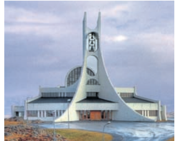
Hin nútímalega kirkja í Stykkishólmi.