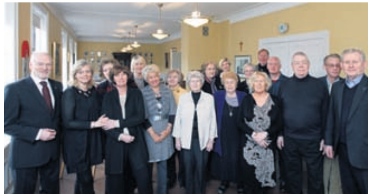
Í Dómkirkjunni er vel tekið á móti öllum. Hér er samankominn hópur sem hittist í hádegisverði að lokinni bænastund í vikunni.