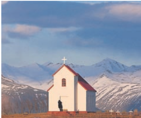
Brunnhólskirkja á Mýrum í Skaftafellsprófastsdæmi.

Á vefsíðunni kirkjukort.net má finna upplýsingar um allar kirkjur á landinu.