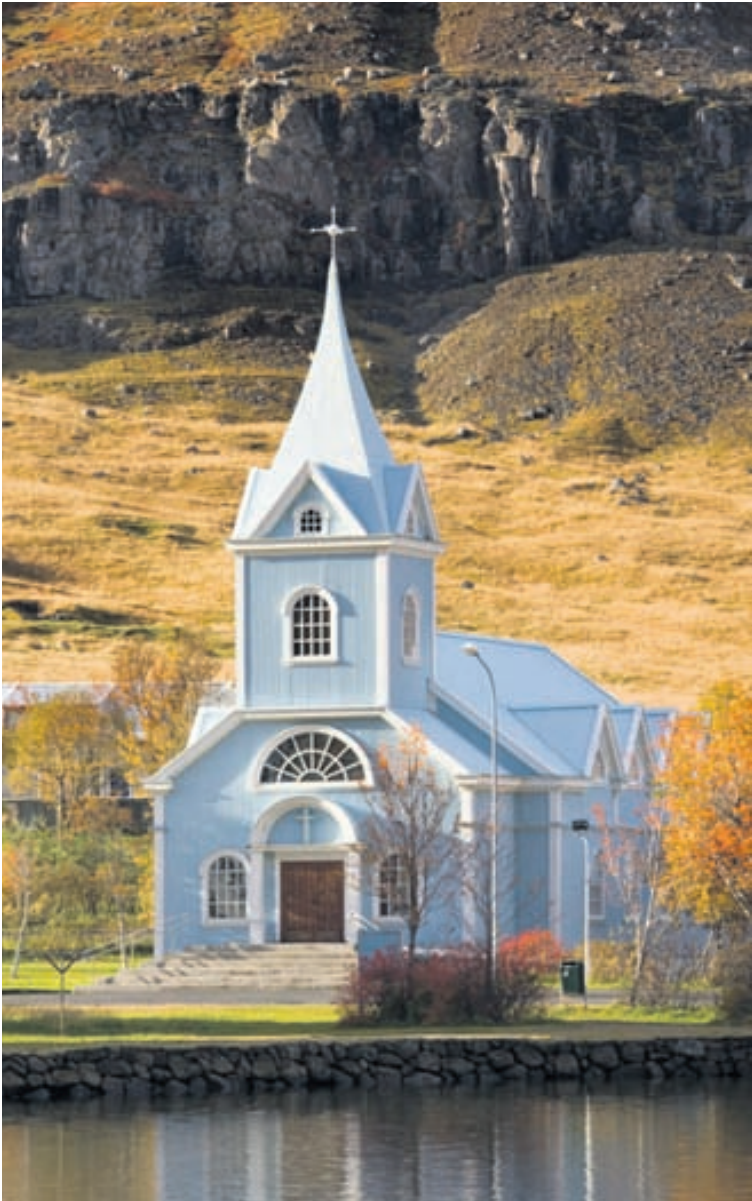
Hin fagra kirkja á Seyðisfirði.