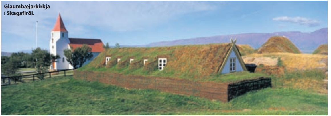
Glaumbæjarkirkja í Skagafirði.