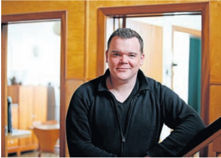
Hallarekstur hefur verið á félaginu undanfarin ár en reksturinn er nú kominn í betra horf.