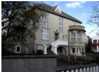
Geðhjálp er með aðsetur á Túngötu 7.

geðheilbrigðisþjónustu og þann grundvöll sem hún hvílir á.