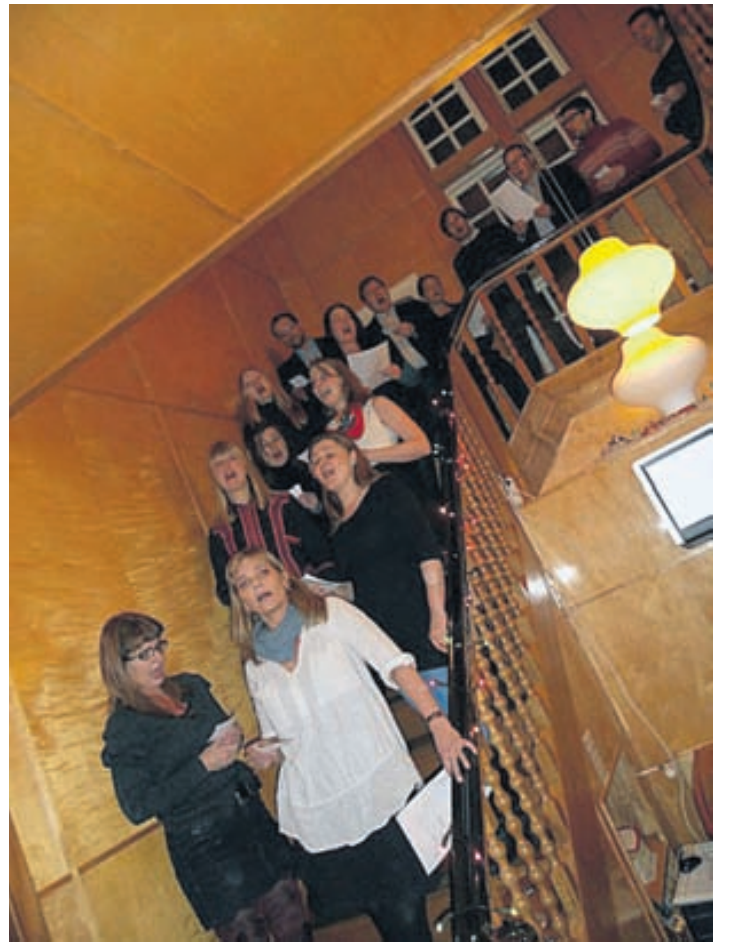
Ljóti kórinn söng ansi fallega.

● SVIGNANDI BORÐ FYRIR JÓLIN Geðhjálp hélt sitt árlega jólahlaðborð um miðjan desember og að venju var það stjórn félagsins sem útbjó matinn og bauð hinum fjölmörgum gestum til borðs. Maturinn var auðvitað ekki af verri endanum: hamborgarhryggur með öllu tilheyrandi. Ljóti kórinn skemmti gestum með fögrum söng og allir héldu mettir út í kuldann sem akkúrat þá réði ríkjum.