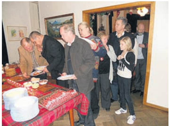
Glaðir gestir ganga eftirvæntingarfyllir að borðinu.

● AUGLÝST EFTIR FÉLÖGUM Geðhjálp eru félagsamtök sem eru algjörlega háð velvilja almennings, bæði fjárhagslega og félagslega. Félagið er að mestu rekið fyrir félagsgjöldin og skilvísar greiðslur þeirra eru mikilvægar. Rödd hvers einasta félagsmanns skiptir máli því sjónarmið okkar og reynsla geta verið mismunandi. Við hvetjum þá sem áhuga hafa á að styrkja og styðja félagið að gerast félagsmenn. Það kostar aðeins 2.000 krónur á ári og má til dæmis gera með því að hringja í síma 570 1700 eða á heimasíðu félagsins: www.geðhjalp.is .