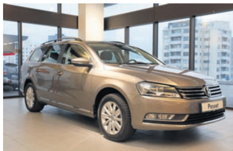
Hér má sjá glænýjan Passat skutbíl sem gengur einnig fyrir metangasi. Fjölmargir metanknúir bílar eru á leið til landsins enda landsmenn að verða æ meðvitaðri um hagkvæmni þess að eiga metanbíl.