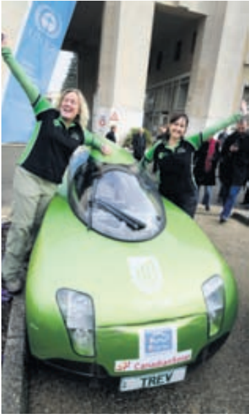
Liðið á ástralska bílnum sem kallaður er Trev var kátt þegar það kom í mark í Genf í síðastliðinni viku.