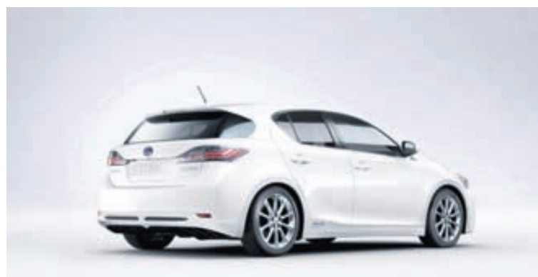
Lexus CT 200h verður kynntur hér á landi 12. mars.