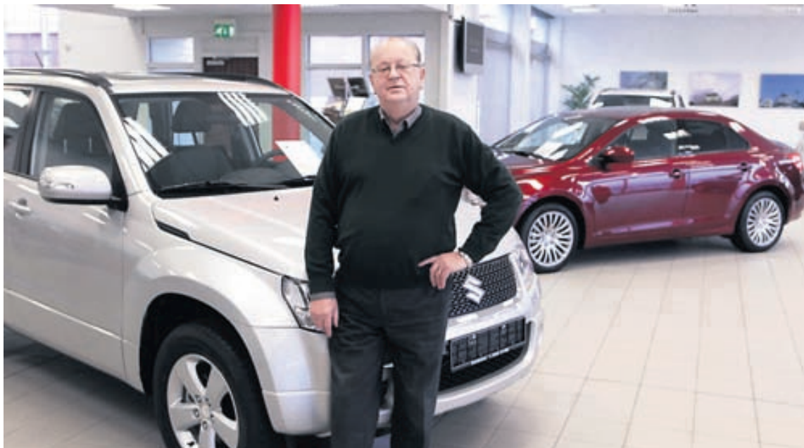
Þorbergur segir von á Grand Vitara með stærri vél og lengri og sparneytnari Suzuki Swift.