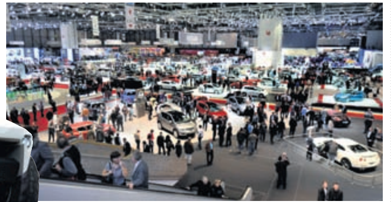
Frá bílasýningunni í Genf í fyrra.