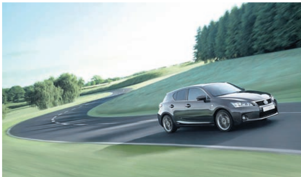
Lexus CT 200h er fyrsti lúxustvinnbíllinn í sínum stærðarflokki.

hægt að kaupa allar gerðir Toyota bæði sem bensínbíl og tvinnbíl.