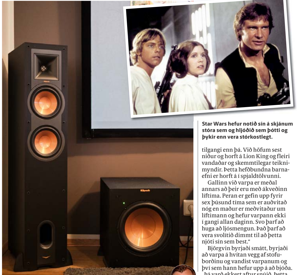
Hátalararnir eru frá bandaríska framleiðandanum Klipsch.

er gaman að horfa á. Christopher Nolan er góður í því. Það er alltaf gaman að horfa á myndir eftir hann í þessum græjum. Stórar sjónarspilsmyndir – það er ekkert hægt að bera þetta saman. Ég hef gaman af Marvel, Star Wars og ævintýramyndum yfirhöfuð. Þær njóta sín vell hérna heima í stofu.“