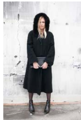
Stillinn hennar Önnu er undir frónskum og breskum áhrifum.