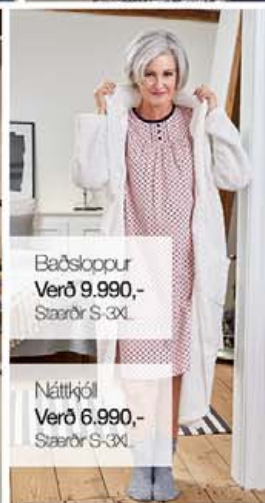
Baðslóppur Verð 9.990,- Stærðir S-3XL