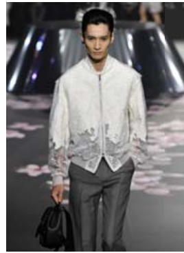
Sparijakki með fallegu japönsku blúndumynstri. Finlegur og smart.