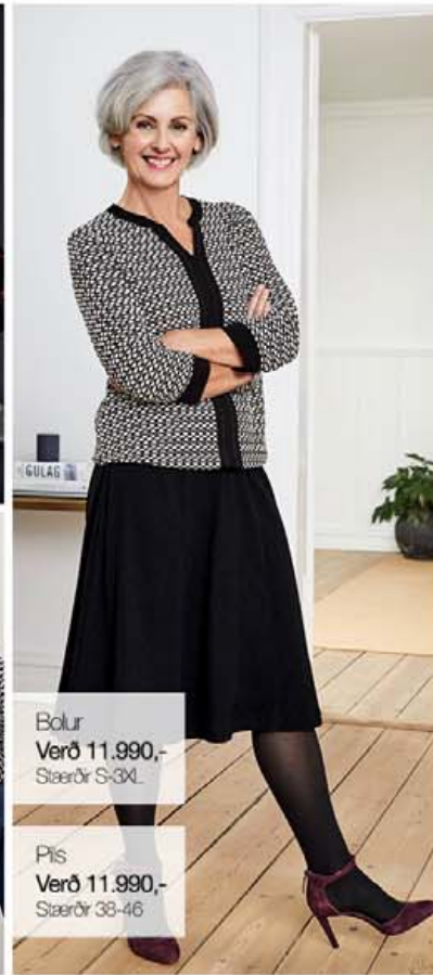
Bolur Verð 11.990,- Stærðir S-3XL