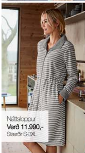
Náttslóppur Verð 11.990,- Stærðir S-3XL