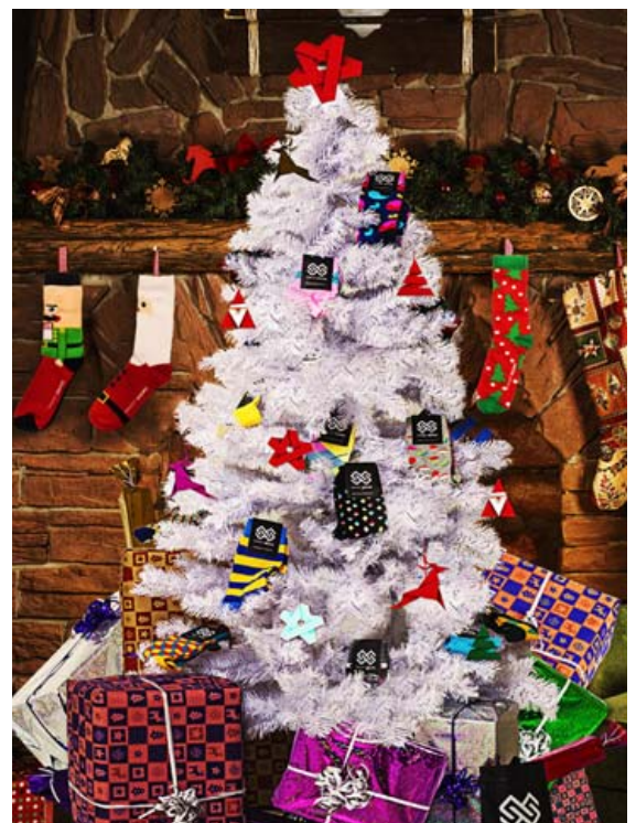
Gjafaáskrift frá Smart Socks er jólagjöf sem heldur áfram að gefa. Það er hægt að gefa fólki áskrift í 3, 6 eða 12 mánuði.

Hjá Smart Socks er mikið úrval af litríkum jólasokkum og þar er hægt að fá sokka fyrir alla sem hafa náð skótaskærð 34.