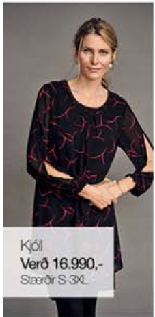
Kjól Verð 16.990,- Stærðir S-3XL