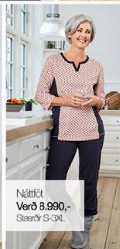
Náttföt Verð 8.990,- Stærðir S-3XL