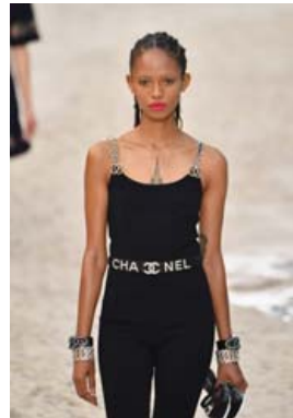
Þessi er merkt Chanel í bak og fyrir.

Chanel kynnti vor- og sumarlinu sína í október síðastliðnum. Léttleikinn var allsráðandi og mikið gert úr Chanel-merkinu í skarti og fylgihlutum.