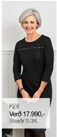
Kjól Verð 17.990,- Stærðir S-3XL