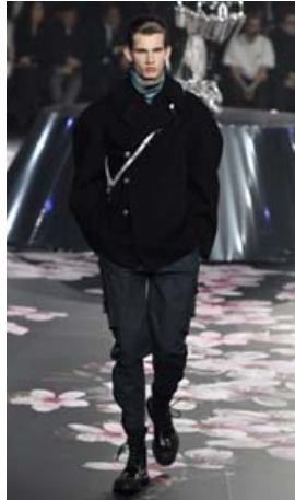
Vetrarlegur herrafatnaður frá Dior fyrir haustið 2019. Glæsilegur jakki.

Kim Jones hefur starfað hjá Dior frá því í mars síðastliðnum en hann kom frá tiskuhúsi Louis Vuitton. Kim Jones vakti strax athygli þegar David Beckham mætti í brúðkaup Harrys og Meghan í hönnun hans í maí síðastliðnum. Fyrsta tiskulínan var sýnd í júní á tiskuvíkunni í París. Á myndunum má sjá hluta af herralínu Dior sem sýnd var í Tókýó.