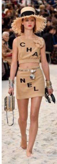
Það fer ekki á milli mála hverju þessi kona klæðist.

Chanel mun vera fyrsta lúxusmerkið sem tekur ákvörðun um að snúa baki við notkun fágætra skinna og fylgir þar með í fótspor fyrirtækja á borð við Asos, Nike, H&M og Puma. Aðrir lúxusmerkjaframleiðendur eins og Armani, Coach, Versace, Michael Kors, Gucci, Burberry og John Galliano hafa gefið út yfirlýsingar um að þeir hyggist draga úr notkun loðýraskinns en hafa ekki gengið svo langt að hætta notkun þess eða annarra fágætra skinna. Chanel mun nýta þær birgðir af skinni sem eru til á lager og má ætla að vörur úr því verði enn eftirsóttari fyrir vikið. Fyrirtækið hyggst svo í framhaldinu þróa aðra valkosti.