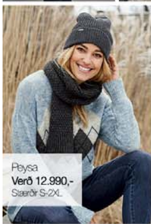
Plýsa Verð 12.990,- Stærðir S-2XL