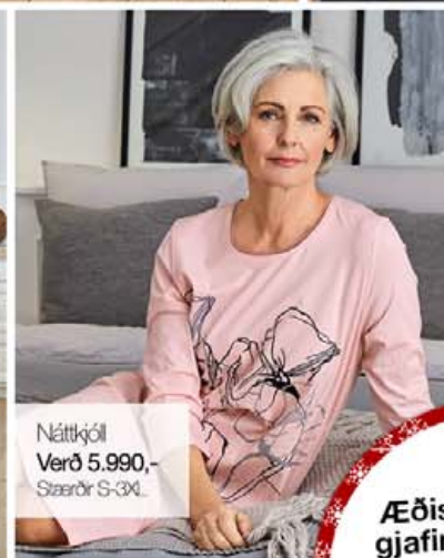
Náttkjól Verð 5.990,- Stærðir S-3XL