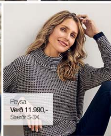
Plýsa Verð 11.990,- Stærðir S-3XL