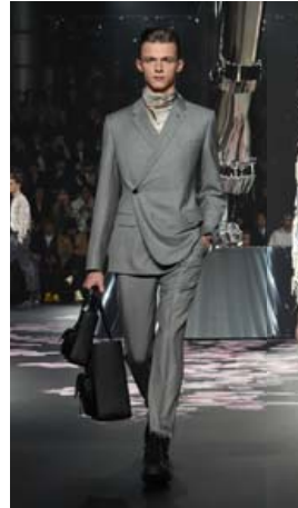
Jakkasniðið á að minna á japanskan herrakimónó. Gæti hentað mörgum.

Í herralínunni frá Dior eru hugmyndir sóttar til Japan.