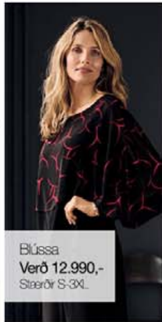
Blússa Verð 12.990,- Stærðir S-3XL