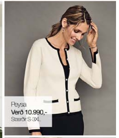
Plýsa Verð 10.990,- Stærðir S-3XL