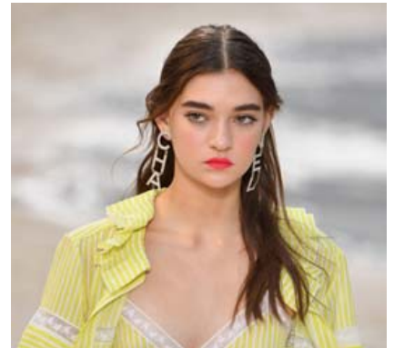
Chanel-eyrnalokkar af stærri gerðinni.