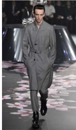
Ullarfrakki sem bundinn er í mitti eins og margir japanskir búningar.