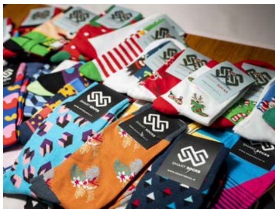
Það sparar tíma að fá senda til sín nýja sokka á hverjum mánuði og mörgum finnst stemning í því að vita ekki hvaða sokka þeir fá.