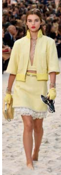
Ljósugli liturinn var áberandi í vorlinunni.