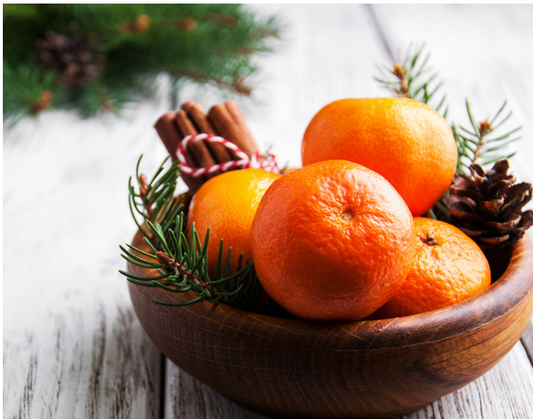
Klementínur eru fallegar á borði og ekki síður jólalegar.

Ef þú borðar þrjár klementínur á dag færðu í þig 130% af dagsþörf