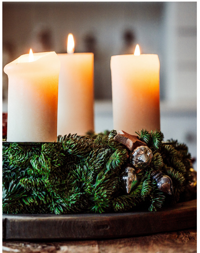
Aðventukransar prýða nær öll heimili fyrir jólin.

Miðasala á tix.is og við innganginn | Miðaverð 2500.-