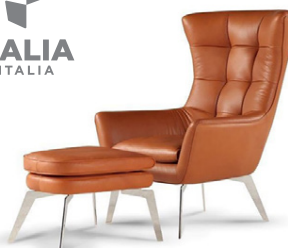
JACOB stóll frá Calia Italia