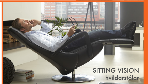
SITTING VISION hvíldarstólar