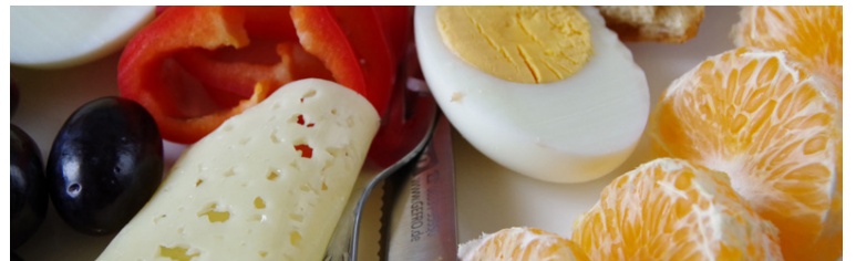
Klementínur passa með kjöti, sérstaklega reyktu kjöti en ekki síður ostum.

Fyrir jólin í fyrra voru flutt um 620 tonn af klementínunum til Íslands. Stærstur hluti kemur frá Spáni.