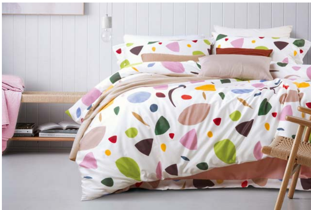
Í Rúmföt.is má finna rúmföt í ýmsum verðflokkum en öll í miklum gæðum.