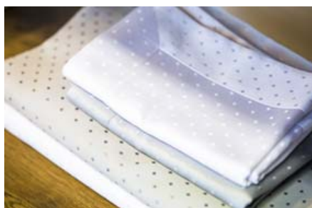
Ítölsku Quagliotti-rúmfötin eru ávana-bindandi, segja þeir sem reynt hafa.