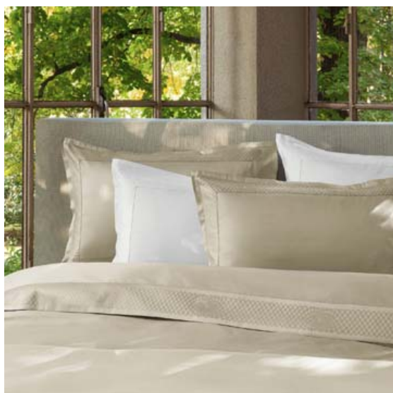
Rúmföt.is býður einstök gæðarúmföt á verði sem kemur á óvart.