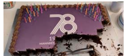
Samtökin '78 fagna fjórutíu ára afmæli sínu í ár með fjölbreyttum hætti en á morgun verður afmælishátíð samtakanna haldin í lönó.