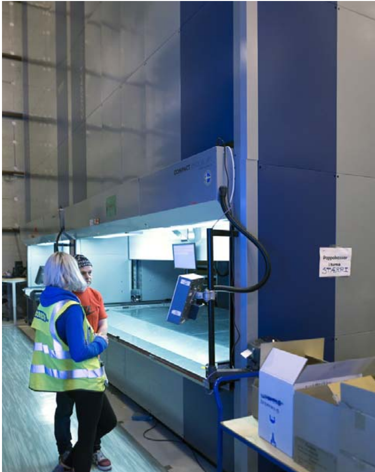
Eitt til tvö op eru fyrir afgreiðslu, allt eftir því hversu stór vöruturninn er.