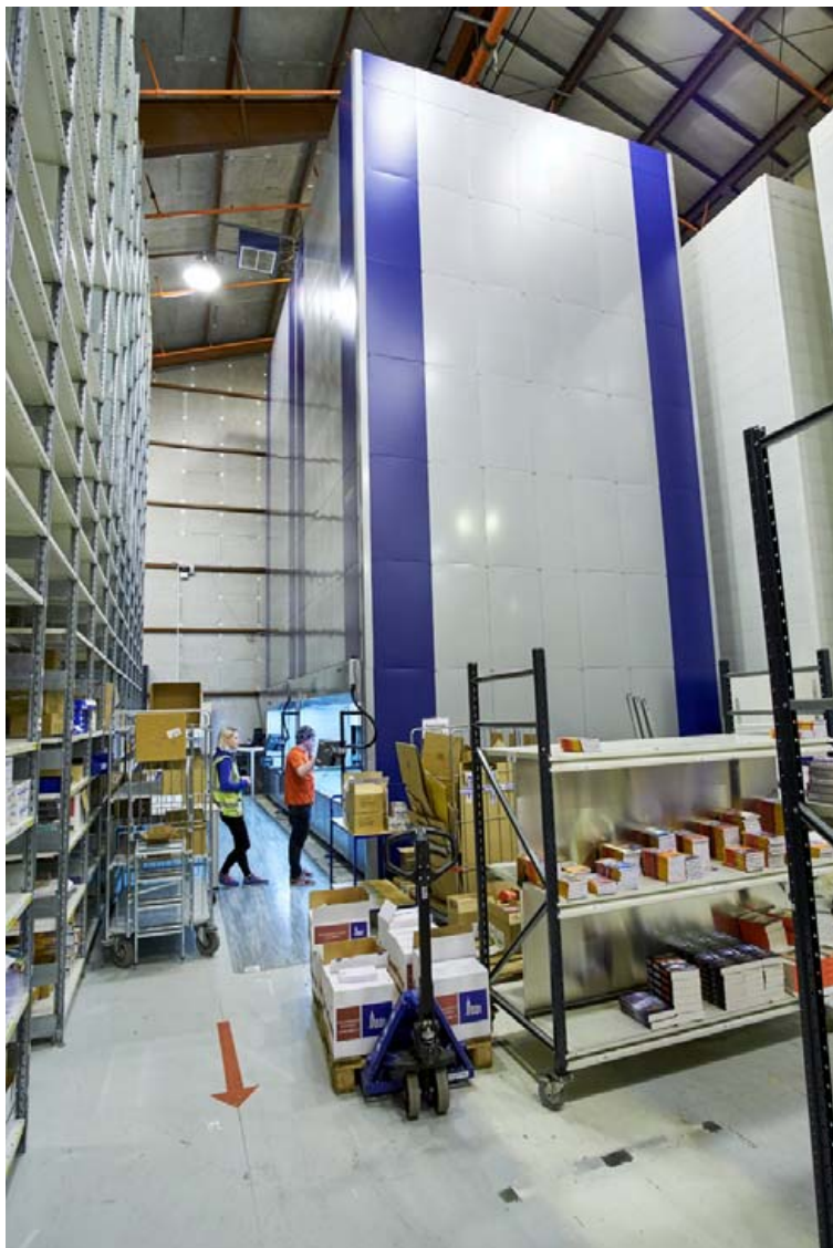
Með því að nota vöruþurn sparast 70-90 prósent af því gólfplássi sem áður fór undir lager.