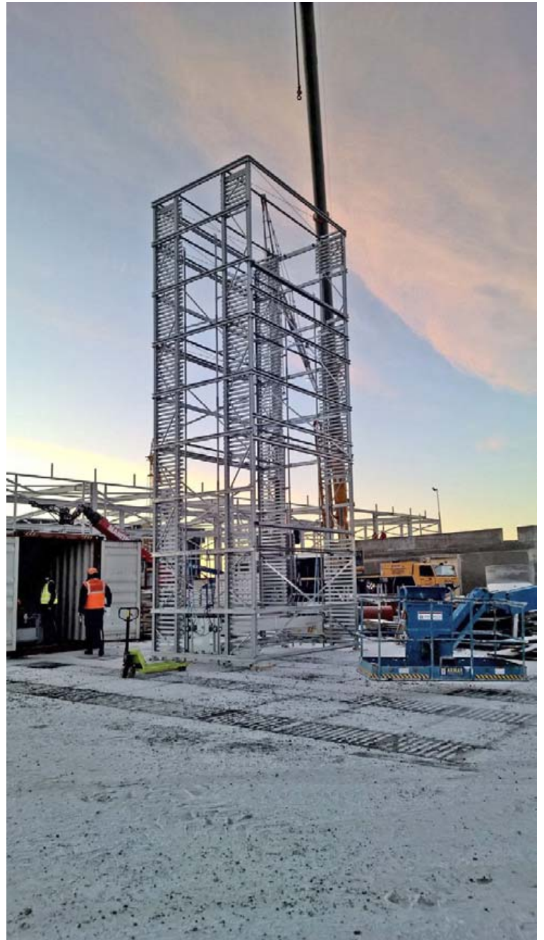
Brimborg hefur þegar fjárfest í lagerturni sem verður tekinn í notkun í næsta mánuði.