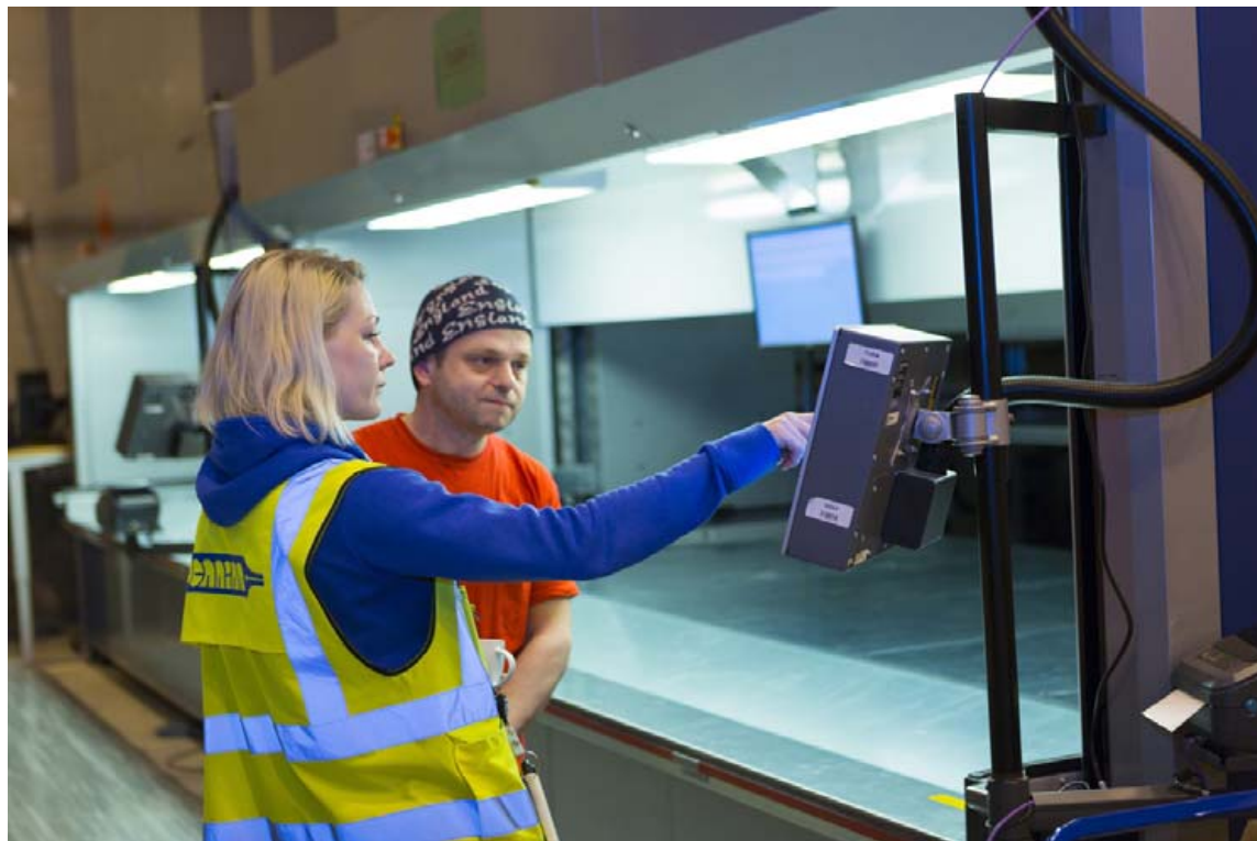
Turninn er tölvustýrður.

Á lager Pennans eru geymdar vörur sem síðan er dreift um allt land. „Við erum með þjónustumiðstöð að Krókhálsi 5 og á hverjum degi dreifum við vörur til meira en 100 mismunandi aðila, bæði á höfuðborgarsvæðinu og úti á landi.