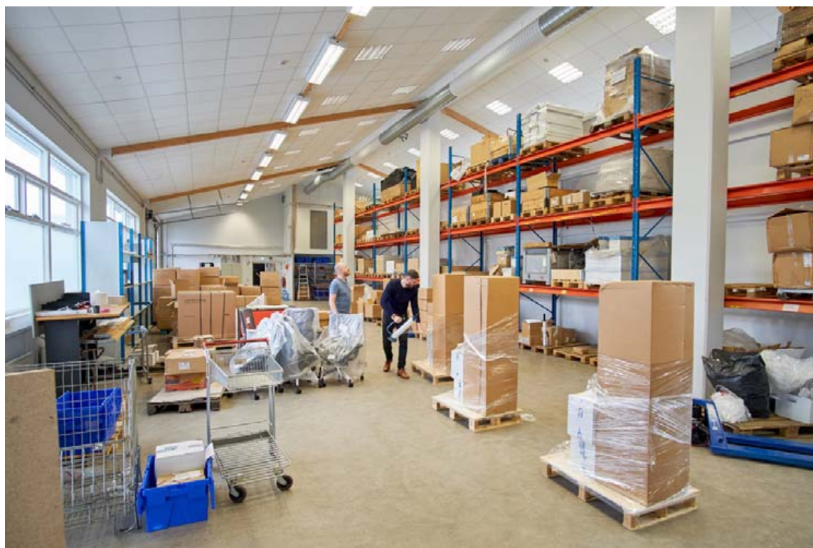
Mikið rými skapaðist þegar turnarnir voru teknir í notkun.