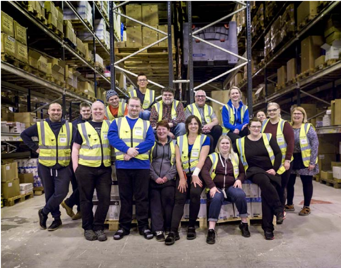
Starfsfólk Pennans er ánæggt með betri vinnuáðstöðu og þarf ekki lengur að ganga langar vegalengdir eftir vörum.