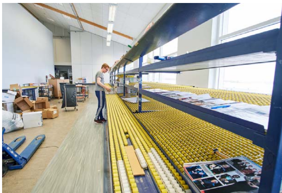
Á Krókhálsi fer fram dreifing á erlendum blöðum um allt land.