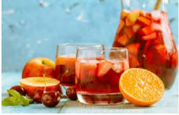
Sangría er sól í könnu og þá gildir einu hvort hún er áfeng eður ei.