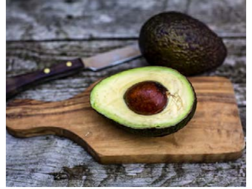
Lárpera getur verið varasöm þegar steinninn er fjarlægður en góð er hún.

Margir matreiðslumenn hafa sömuleiðis lent í alvarlegum handarslysum vegna lárperunnar sem lýtalæknar kalla „avocado hand“. Jamie Oliver hefur sett myndband á Youtube þar sem hann kennir fólki að taka steininn úr með hnífi. Aðrir benda á að skera lárperuna fyrst til helminga og síðan aftur niður í fjóra parta. Þá er hægt að fjarlægja steininn með skeið eða höndunum.