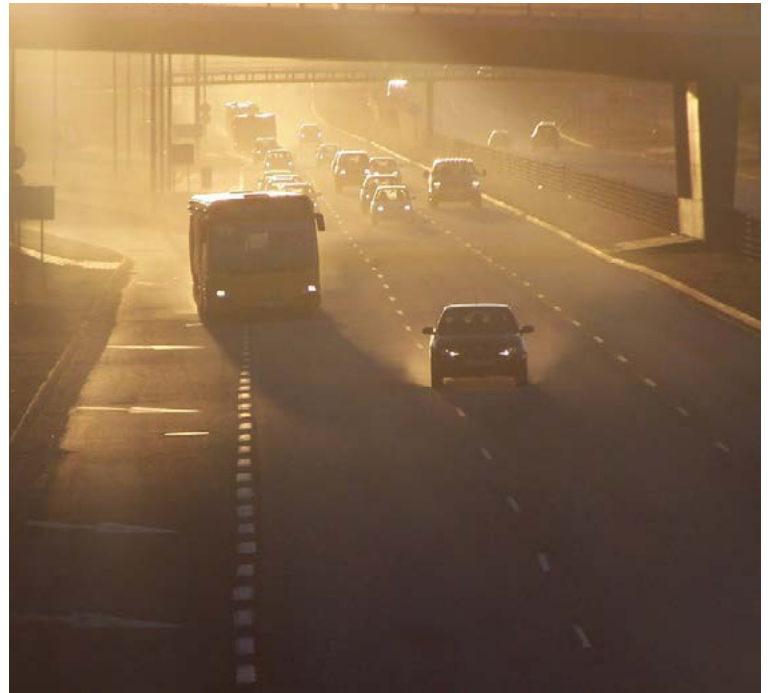
Suma daga getur myndast mikið svifryk við aðalumferðaræðar borgarinnar.