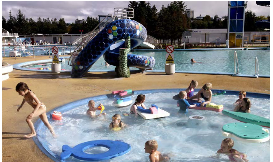
Það verður mikið opið í sundlaugunum í páskafríinu.

Síðast en alls ekki síst er spáin góð, þannig að það stefnir í að það verði hægt að nýta fríið í alls kyns útivist.