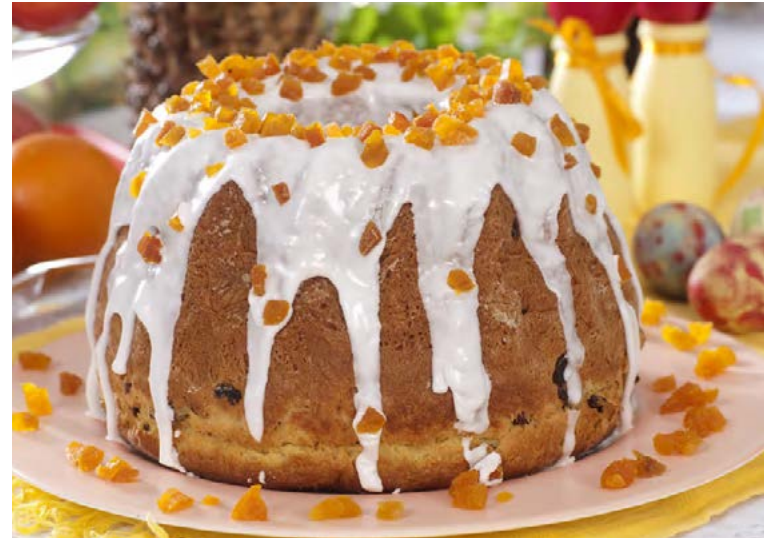
Appelsínuformkaka með glassúr.

Hitið ofninn í 175°C. Þeytið saman smjör og sykur þar til blandan verður létt og ljós. Setjið þá eggin saman við, eitt í einu. Þá er rifnum appelsínuberki og -safa bætt út í. Blandið þá hveiti og lyftidufti saman við. Setjið deigið í vel smurt kringlótt formkókuform og bakið í um það bil 50 mínútur. Þegar kakan er tilbúin eru stungin í hana nokkur göt með grillteini og appelsínusafanum er hellt yfir. Kælið. Búið til glassúr með flórsykri og appelsínusafa. Smyrjið yfir kökuna og skreytið með rifnum appelsínuberki.