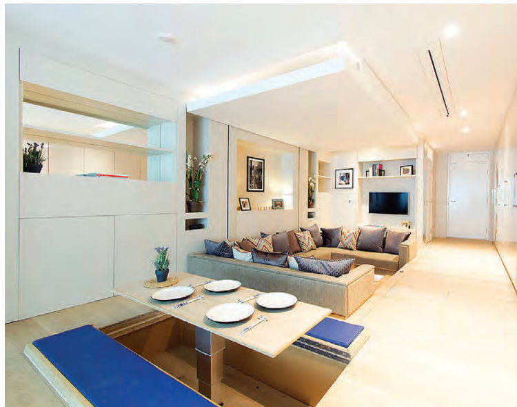
Á örheimilum er plássíð nýtt betur en við erum vön.

Í New York var gengið skrefi lengra. Árið 2012 hélt þáverandi borgarstjóri, Michael Bloomberg, samkeppni þar sem arkitektar voru beðnir að hanna fyrstu húsaröðina af örheimilum á Manhattan. My Micro NY, frá fyrirtækinu Narchitects vann og það er biðlisti í allar 55 íbúðirnar.