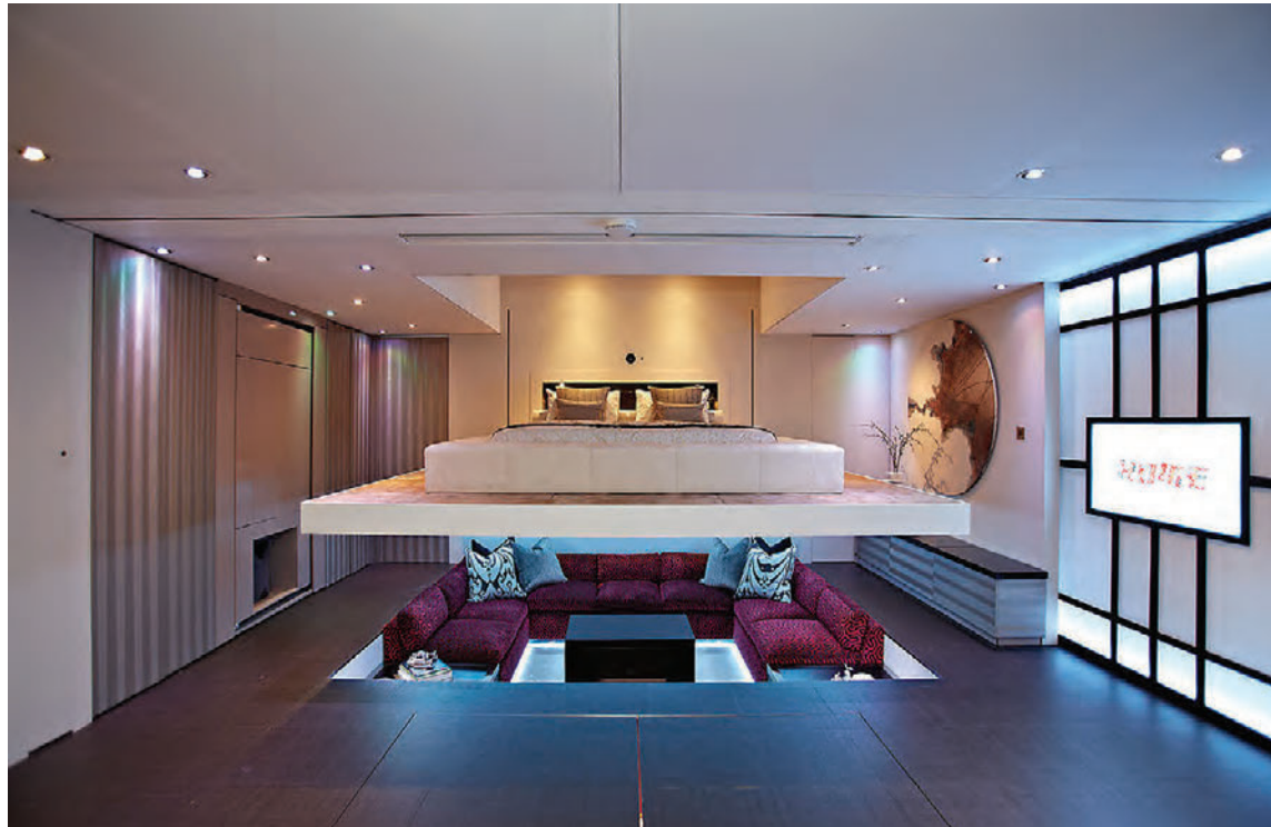
Á örheimili skipta herbergi um hlutverk þegar ýtt er á takka.

Sumir sjá örheimili sem vopn í baráttunni gegn myndun fátækra-herverfa af því að með þeim þéttist