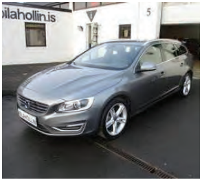
VOLVO V60 d4 summum leður/191 hö. Árg. 2017, ek. 25 Þ.KM, dísel, leður, sjálfskiptur 8 girar. Verð 4.980.000. Rnr.152081.

Bílahöllin Bíldshöfða 5, 112 Rvk Sími: 567 4949 www.bilahollin.is