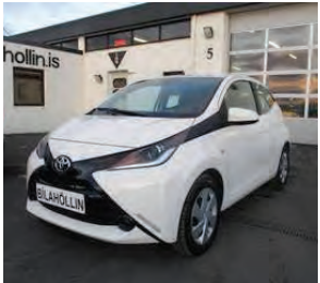
TOYOTA Aygo h/b x-play touch. Árg. 2017, ek. 30 Þ.KM, bensín, 5 girar. Verð 1.490.000. Rnr.152093.