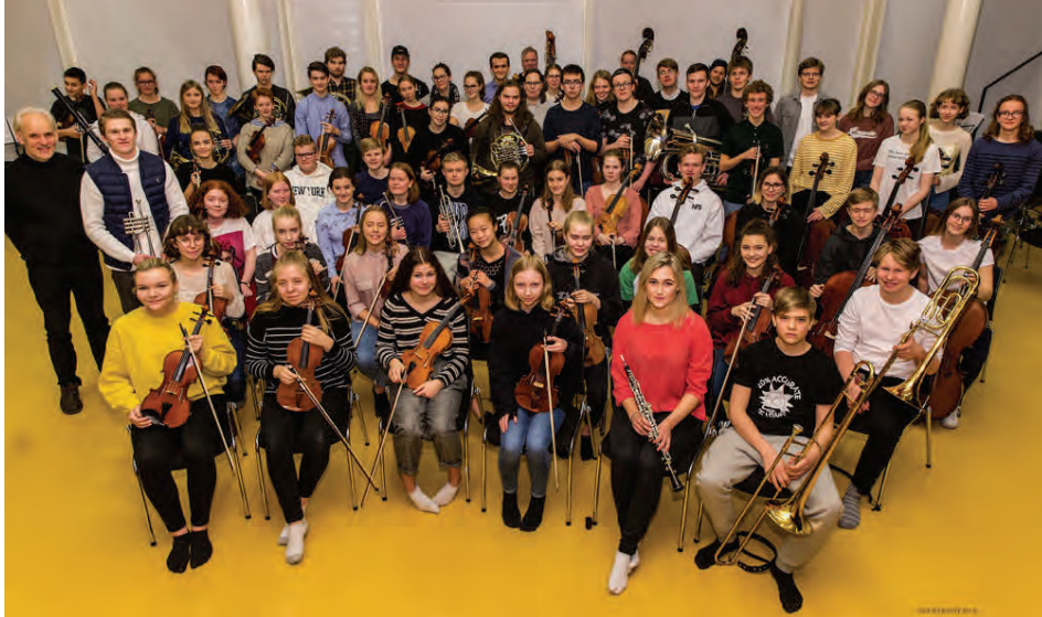
Sinfóníuhljóm-sveit tónlistarskólanna hefur æft tónleika-dagskrána frá áramótum.