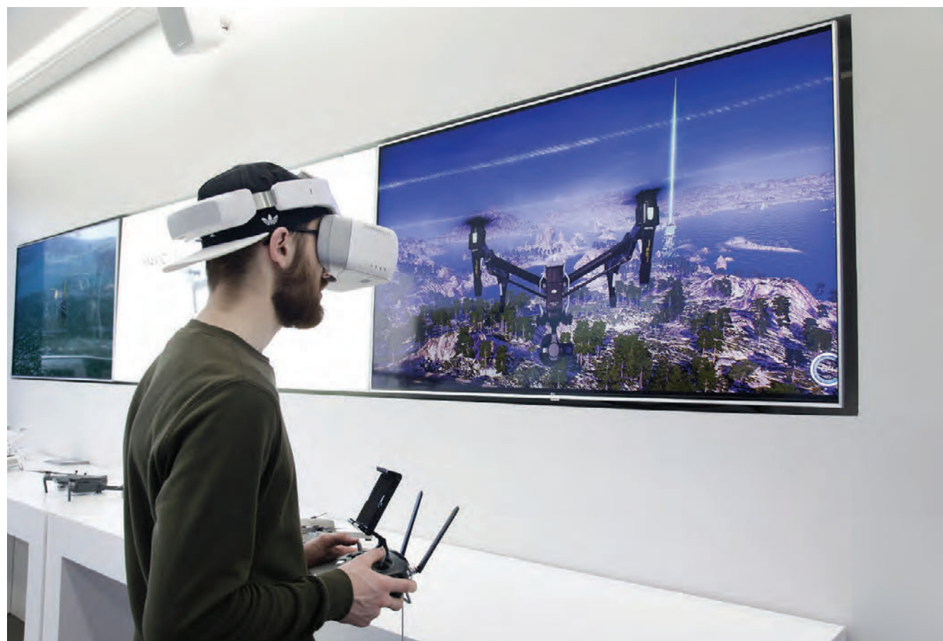
Verslunin er hönnuð eftir kröfum frá DJI.