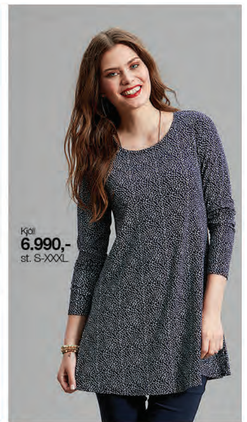
Kjöll 6.990,- st. S-XXXL