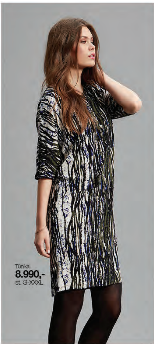
Túnika 8.990,- st. S-XXXL