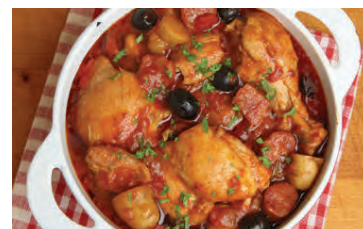
Kjúklingur með chorizo og ólífum.

Kryddið bringurnar með salti og pipar. Setjið ferskt kóríander undir skinnið ef það er til staðar. Steikið á heitri pönnu á báðum hliðum en leggið bringurnar síðan í eldfast mót. Blandið öllu saman sem upp er talið í uppskriftinni fyrir utan bringurnar. Setjið yfir bringurnar og bakið í ofni við 200°C í um það bil 30 mínútur. Skreytið réttinn gjarnan með smátt