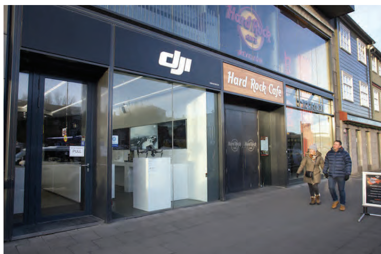
DJI verslunin er við hliðina á Hard Rock í Lækjargötu.

sem væri annars ógerlegt. Við fáum fjölda ferðamanna til okkar í búðina sem eru að leita að góðum drónum fyrir ferðalag sitt um Ísland. Drónarnir hjá okkur eru á sambærilegu verði og í öðrum evrópskum löndum. Það borgar sig ekki að kaupa þá erlendis. Litli dróninn er á mjög góðu verði