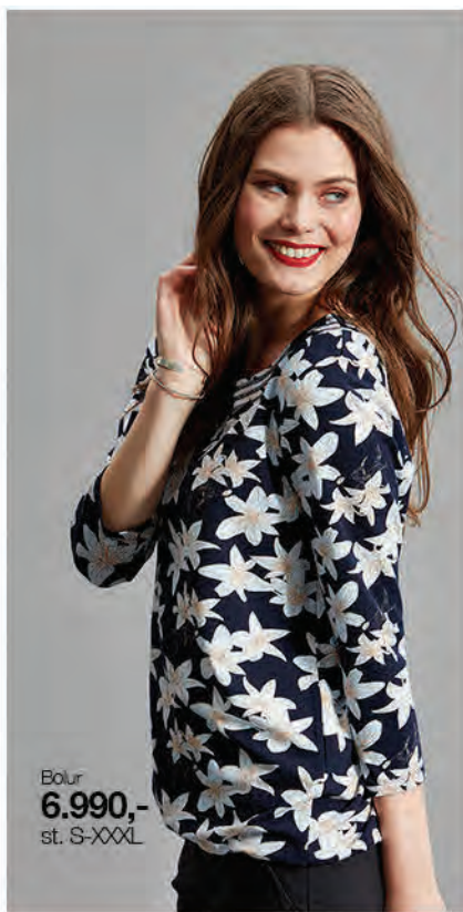
Bolur 6.990,- st. S-XXXL