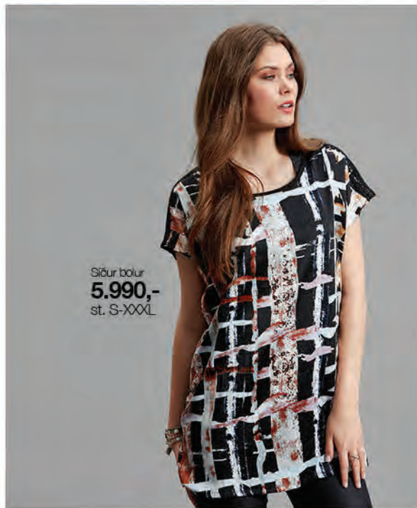
Stóur bolur 5.990,- st. S-XXXL