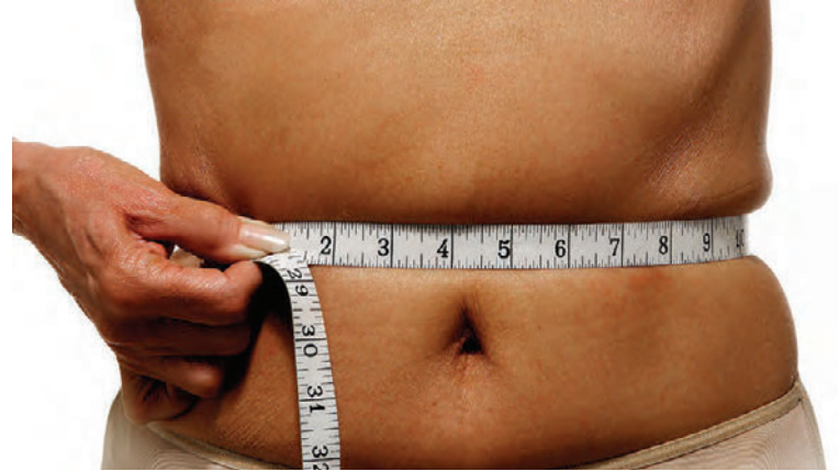
Steinaldarhópurinn léttist að meðaltali um níu kíló en hinn um sex.

Norræni kúrinn samanstóð af trefjarikum mat, kjöti, fiski, grænmeti, ávöxtum og mjólkurvörum. 15% innihéldu prótín, 30% fitu og 55% kolvetni.