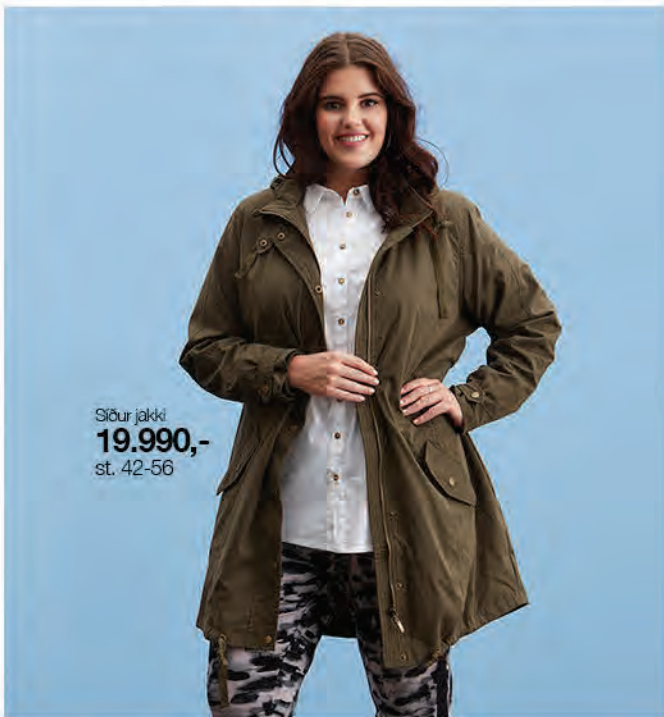
Stóur jakki 19.990,- st. 42-56