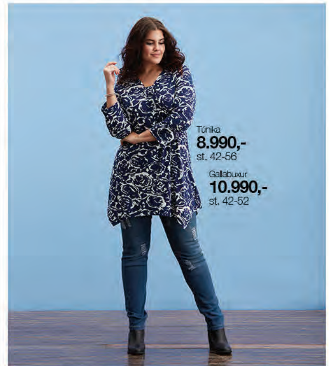
Túnika 8.990,- st. 42-56 Gallabuxur 10.990,- st. 42-52