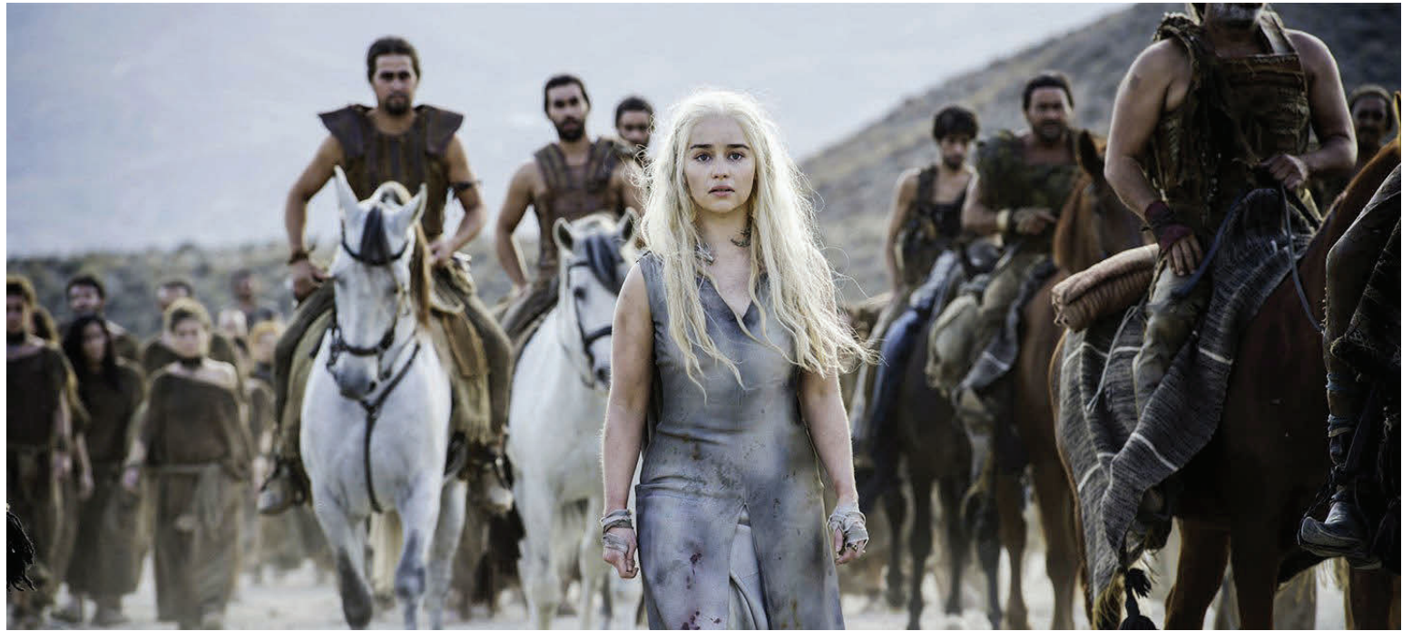
Lokasería þáttanna verður sýnd á næsta ári.

Númer eitt á listanum er Tresteno í Króatíu. Glæsilegur grásargarður sem er stutt frá Dubrovnik. Það er hægt að taka rútu eða leigubíl til Tresteno. Garðurinn