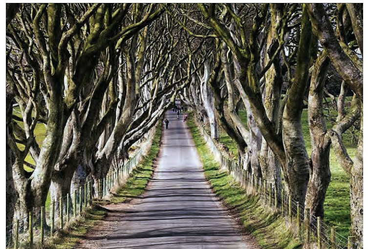
The Dark Hedges á Írlandi koma við sögu í Game of Thrones.

kemur mikið við sögu í þriðju seríu af Game of Thrones.