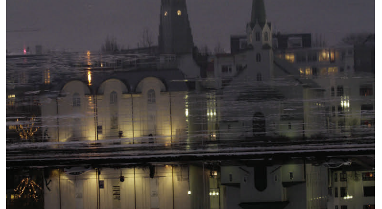
Myrkir músíkdagar fara meðal annars fram á Listasafni Íslands.

Nánari dagskrá má sjá á vefsíðunni darkmusicdays.is en hátíðinni lýkur með eftirpartíi á Húrra annað kvöld klukkan ellefu þar sem DJ Sigrún þeytir skífum.