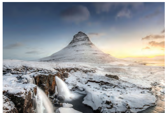
Kirkjufell kemur við sögu í Game of Thrones.