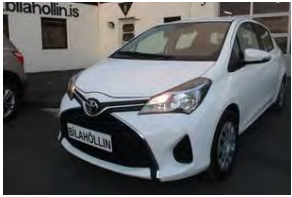
TOYOTA Yaris h/b active. Árgæð 2017, ekinn 31 Þ.KM, bensín, 6 girar. Verð 1.940.000. Rnr.152092.