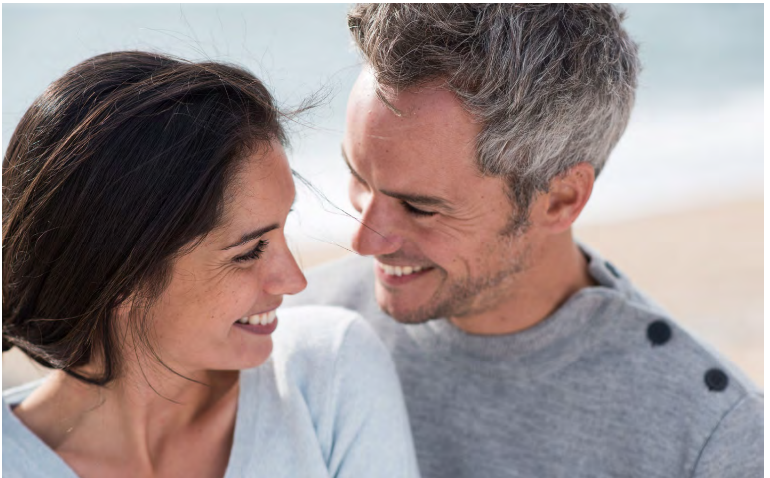
Flestir karlmenn finna fyrir einhverjum einkennum testósterónskorts einhvern tíma á lífsleiðinni.