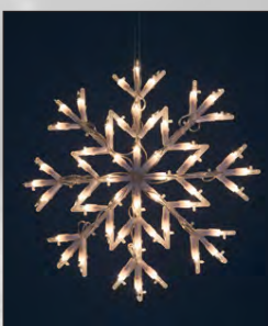
Frostrós kr. 1.590,-