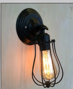
Retro ljós m.peru kr. 4.990,-