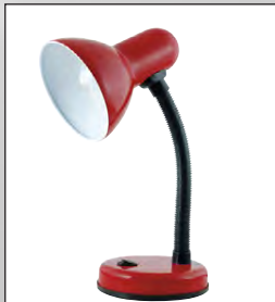
Skrifborðslampi kr. 3.495,-