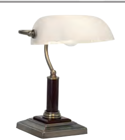
Bankalampi kr. 16.990,-