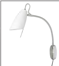
Veggjós kr. 7.450,-