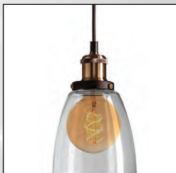
Lofljós gler m.peru kr. 19.900,-