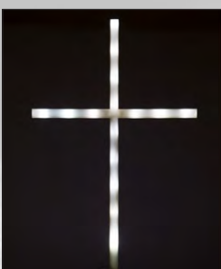
leiðiskross kr. 3.700,-