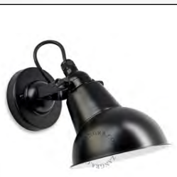
Veggjós svart eða hvítt kr. 7.990,-