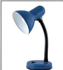
Skrifborðslampi kr. 3.495,-