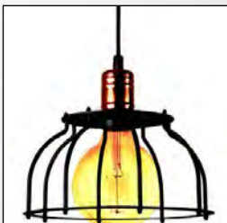
Lofljós grind m.peru kr. 18.900,-