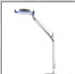
Skrifborðslampi kr. 11.900,-