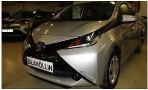
TOYOTA Aygo h/b x-play touch. Árgæð 2017, ekinn 30 Þ.KM, bensín, 5 girar. Verð 1.550.000. Rnr.152094.

Bílahöllin Bíldshöfða 5, 112 Rvk Sími: 567 4949 www.bilahollin.is