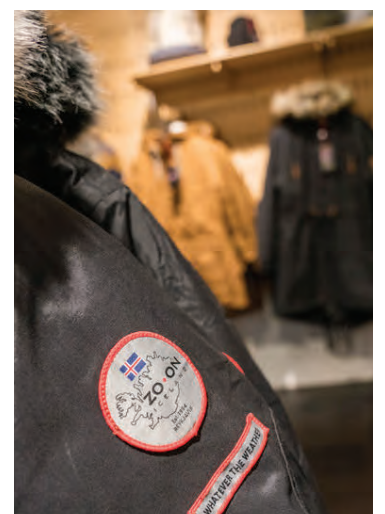
Vönduð efni eru í fatnaði ZO•ON.

ZO•ON rekur þrjár verslanir í Reykjavík; í Bankastræti, Kringlunni og á Nýbýlavegi. ZO•ON vörurnar er einnig að finna á www.zo-on.is og í verslunum um allt land.