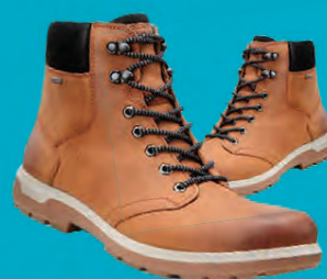
ECCO WHISTLER STÆRDIR 40-47 / HERRA VERÐ NÚNA 20.796.- ÁÐUR 25.995.-