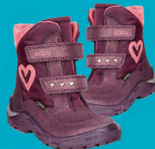
ECCO SNOWRIDE BARNAKULDASKÓR STÆRDIR 23-30 VERÐ NÚNA 8.796.- ÁÐUR 10.995.-