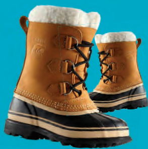
SOREL CARIBOU KULDASKÓR STÆRDIR 33-39 VERÐ NÚNA 13.596.- ÁÐUR 16.995.-

20% AFSLÁTTUR SKÓDAGAR ELLINGSEN FRÁ 19 – 29. OKTÓBER