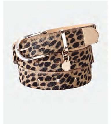
Belti, 6.490 krónur.