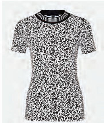
Toppur, 6.490 krónur.