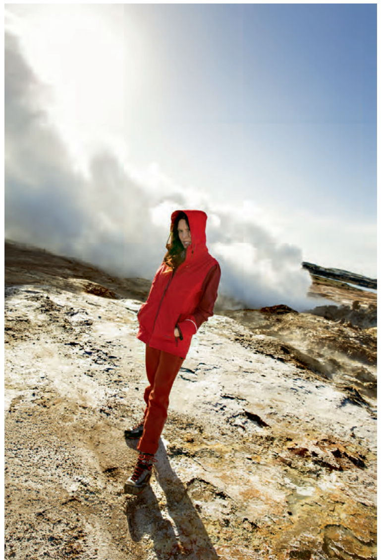
Nanna er þriggja laga úlpa sem kostar 19.990 kr.