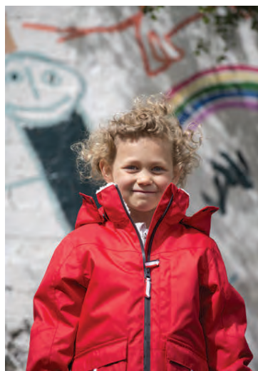
Snjógallinn Keilir er frábær fyrir veturinn. Hann kostar 14.990 kr.