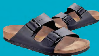
BIRKENSTOCK ARIZONA STÆRDIR 36-43 / DÖMU VERÐ NÚNA 9.596.- ÁÐUR 11.995.-