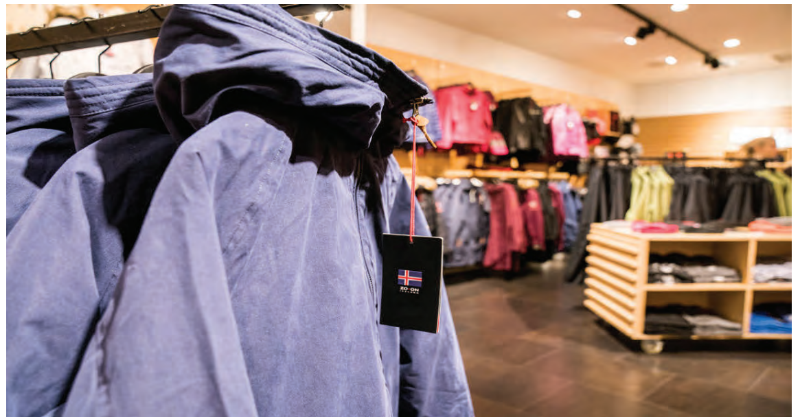
Áhersla er lögð á fjölbætta notkun. úlpa er ekki bara úlpa heldur tvær flíkur í einni eða þrjár.

„Í barnalínu ZO•ON er áhersla lögð á gæðaeftni, slitsterk og vatnsheld svo krakkarnir geti leikið sér og velt sér um í öllum aðstæðum. Við viljum að börnin geti nýtt fötin vel, ermarnar má til dæmis lengja um eina stærð svo nota megi flíkina lengur. Með gæðaeftnum er líftími flíkurinnar langur og súrt að þurfa að leggja úlpunni bara vegna þess að hún er orðin of litil. Með því að stækka hana um eina stærð þarf ekki að endurnýja á hverju ári.“