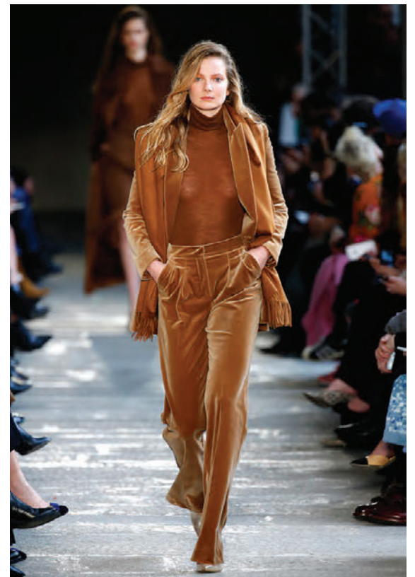
Buxnadragt úr flaueli frá Armani.