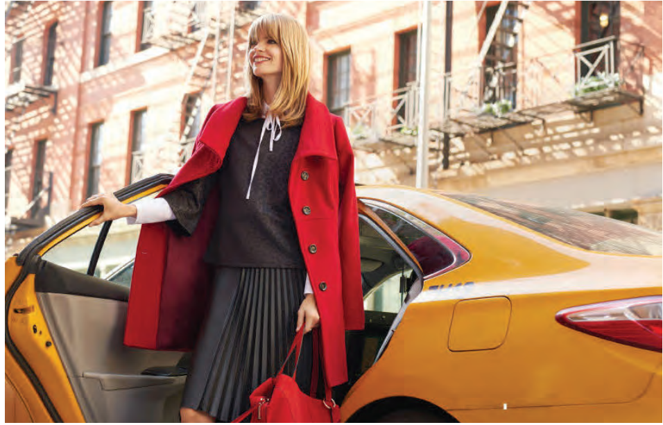
Lína þessa mánaðar heitir LEO love og einkennist af leðri, LEO-prenti og röndóttu í bland.

Þar sem Comma sendir frá sér tólf línur á ári er alltaf eitthvað nýtt að finna og hægt að ganga að nýjustu tiskustrámunum vísum. „Þá hefur reynslan sýnt að sniðin, sem eru þýsk, henta íslenskum konum einstaklega vel. Eins koma fötin í breiðu stærðarúrvali, eða frá 34 til 46, og því ættu flestar konur að geta klæðst samkvæmt nýjustu tisku í vetur.