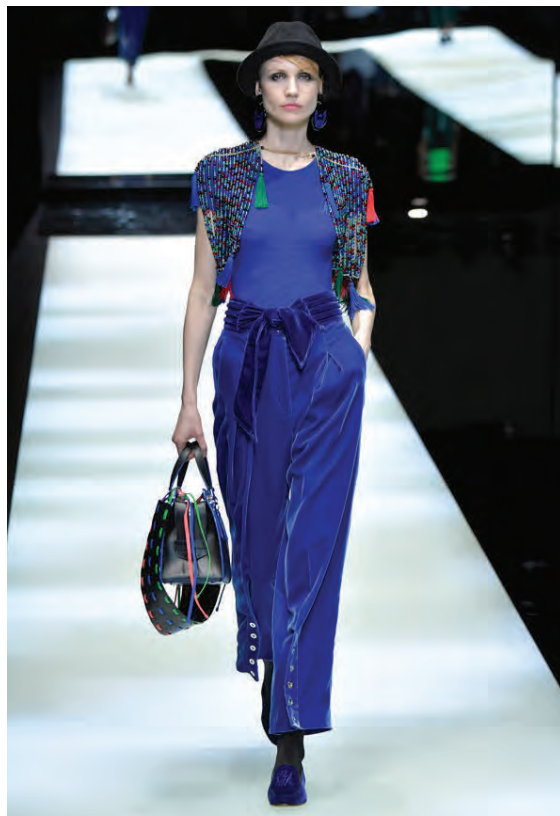
Flauelsbuxur frá Giorgio Armani sem hann sýndi á tiskuvíkunni í Milanó fyrir veturinn 2017-2018. Flauel er mjög vinsælt um þessar mundir.

fatnað sem passar með. Ég var þínu hrædd um, þegar H&M opnaði hér, að allar konur yrðu eins klæddar en svo er alls ekki. Það er ekki hægt annað en að fagna auknu vöruúrvali hér á landi. Við þurfum ekki allar að vera eins.“