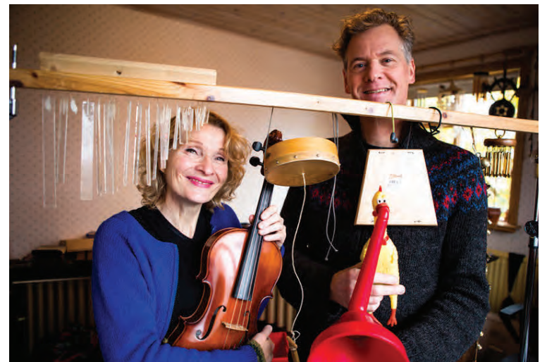
„Ullin er svo frábær og í algjöru uppáhaldi. Hún heldur svo vel hita á manni. Við erum sauðkindinni mjög þakklát fyrir ullina.“