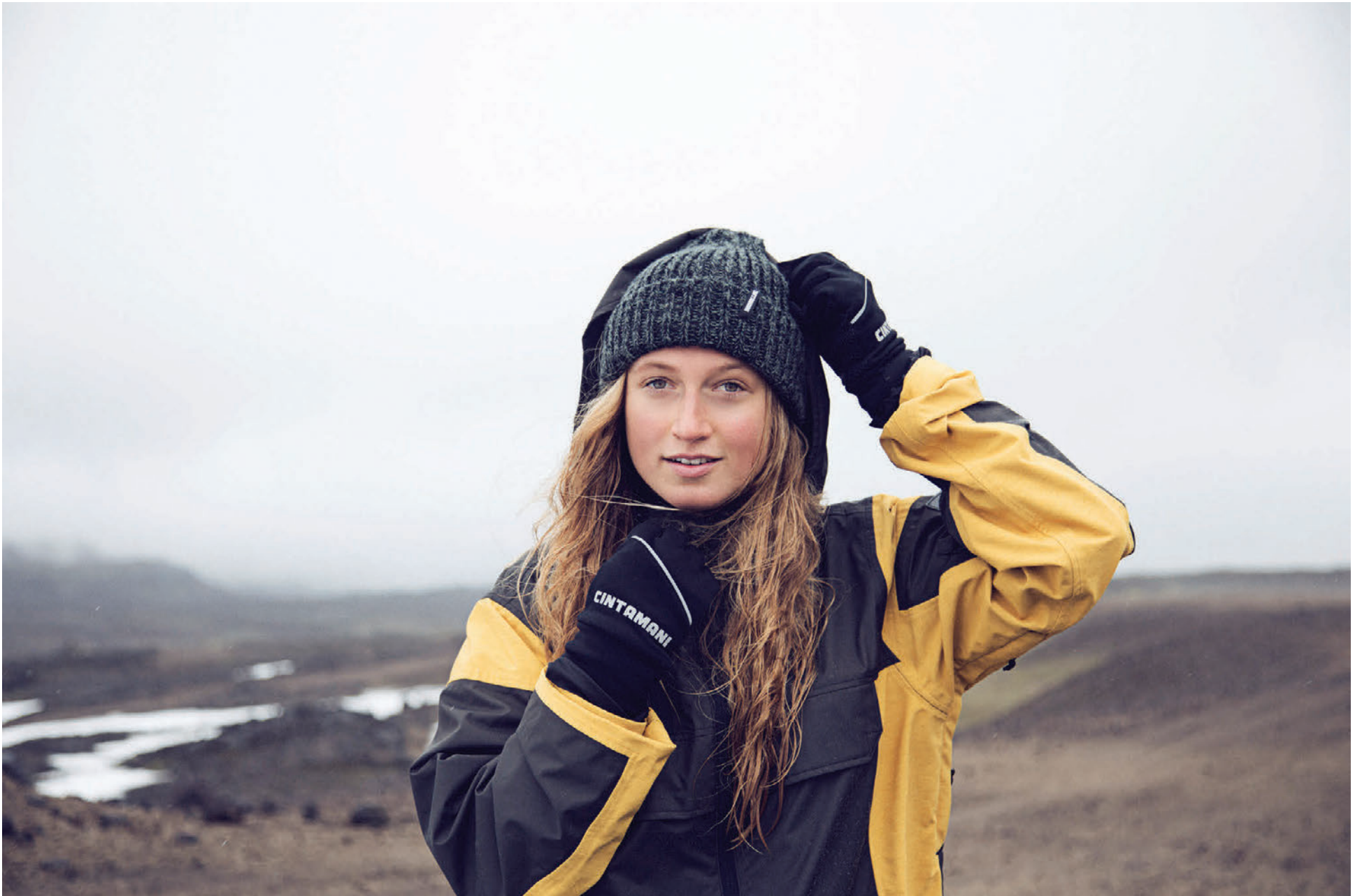
Þessi jakki passar vel fyrir bæði kynin og hentar vel á fjöllum.