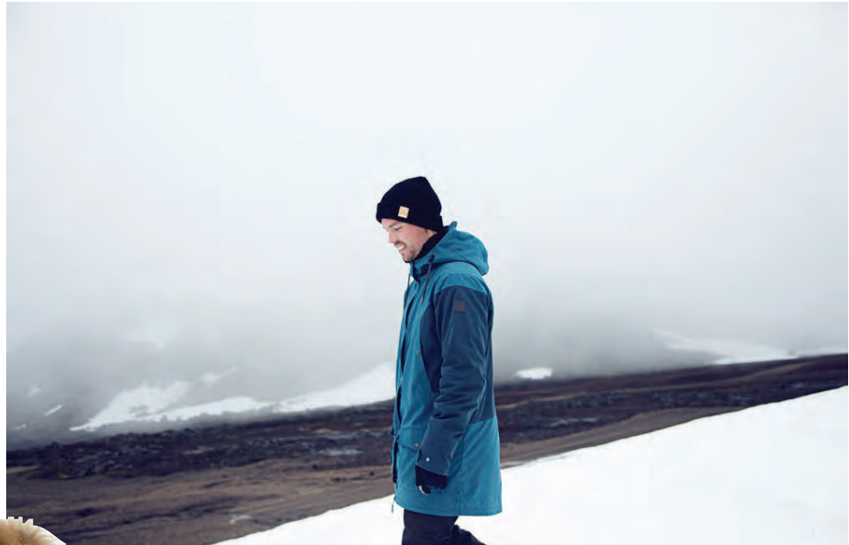
Þessi hlýi, síði herrajakki er úr mjúku efni sem hrindir frá sér bleytu og er aðallega hannaður til daglegra nota.