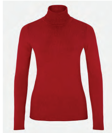
Peysa, 8.490 krónur.