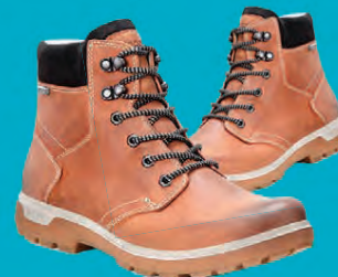
ECCO GORA STÆRDIR 36-41 / DÖMU VERÐ NÚNA 20.796.- ÁÐUR 25.995.-