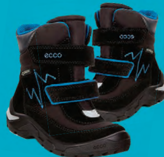
ECCO SNOWRIDE BARNAKULDASKÓR STÆRDIR 23-30 VERÐ NÚNA 8.796.- ÁÐUR 10.995.-