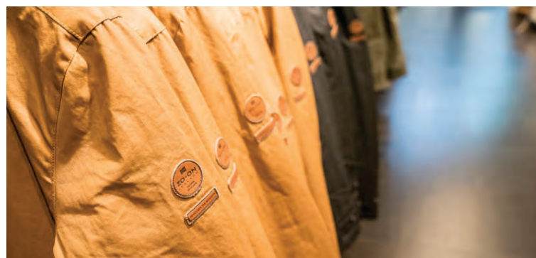
Jarðlitir einkenna nýju vetrarlínu ZO•ON.