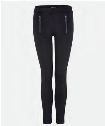
Buxur, 14.990 krónur.