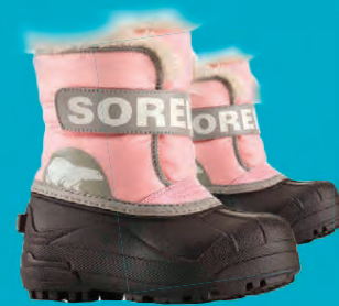
SOREL COMMANDER BARNAKULDASKÓR STÆRDIR 22-35 VERÐ NÚNA 6.396.- ÁÐUR 7.995.-

20% AFSLÁTTUR SKÓDAGAR ELLINGSEN FRÁ 19 – 29. OKTÓBER