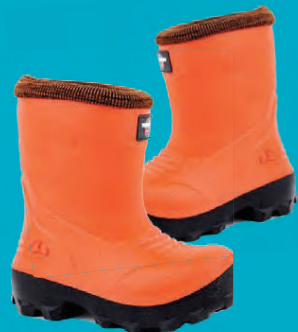
VIKING FROST FIGHTER BARNASTÍGVÉL STÆRDIR 21-35 VERÐ NÚNA 5.996.- ÁÐUR 7.495.-