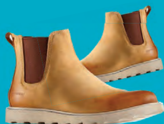
SOREL CHELSEA STÆRDIR 41-45 / HERRA VERÐ NÚNA 19.996.- ÁÐUR 24.995.-