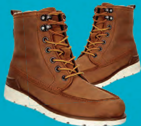
BARNA ECCO AYDEN STÆRDIR 33-40 / BARNA VERÐ NÚNA 12.796.- ÁÐUR 15.995.-