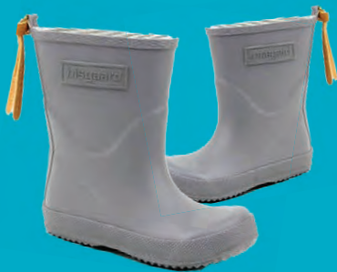
BISGAARD BARNASTÍGVÉL STÆRDIR 21-35 VERÐ NÚNA 4.796.- ÁÐUR 5.995.-