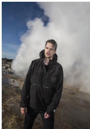
Anorakkurinn Njáll kostar aðeins 19.990 kr.

Vörur ICEWEAR má nú kaupa í ellefu verslunum hér á landi, átta þeirra eru á höfuðborgarsvæðinu og þrjár á landsbyggðinni. Einnig er rekin öflug netverslun á vefnum www.icewear.is .