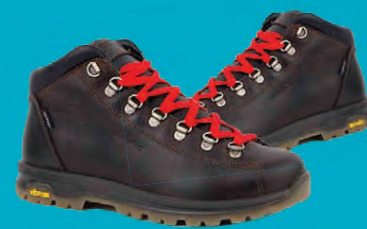
GRISPORT STÆRDIR 36-47 / HERRA VERÐ NÚNA 15.996.- ÁÐUR 19.995.-