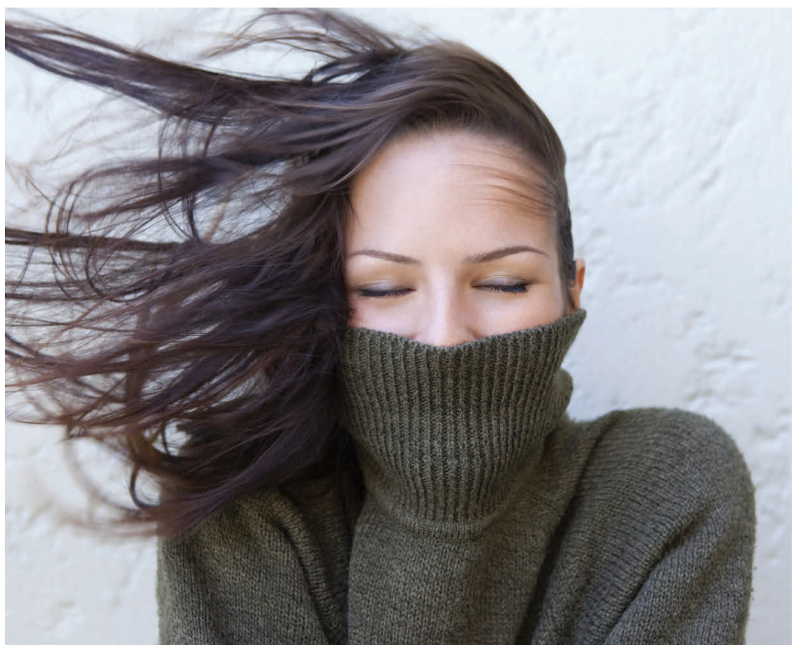
Þurrtrasturtur hefur hvorki góð áhrif á húð né hár.

Hárið þarf líka sérstaka umhirðu yfir veturna. Betra er að þvo það annan hvern dag svo náttúruleg fitan nái að næra hárið alveg út í enda. Gott er að bera sérstakar olíur í hárendana svo þeir verði ekki tætingslegir. Slíkar olíur fást á öllum betri hárgreiðslustofum. Ekki ætti að blása hárið þurr með of miklum hita á hárblásaranum því það skaðar hárið. Svo er um að gera að setja af og til djúpnæringu í hárið og vefja þá handklæði utan um það svo næringin nái fullri virkni, skola hana svo úr. Það má svo enda á að úða rakaspreyi yfir hárið.