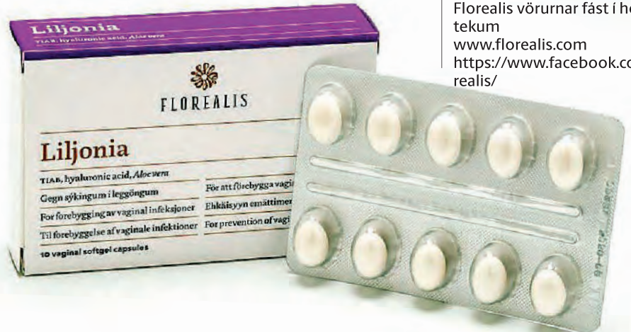
Liljonia, mjúk hylki í leggöng.

Fólk er kynningarblað sem býður auglýsendum að kynna vörur og þjónustu í formi viðtala og umfjallana. Í blaðinu er einnig hefðbundin ritstjórnar-efni. Blaðið fylgir fréttablaðinu daglega.