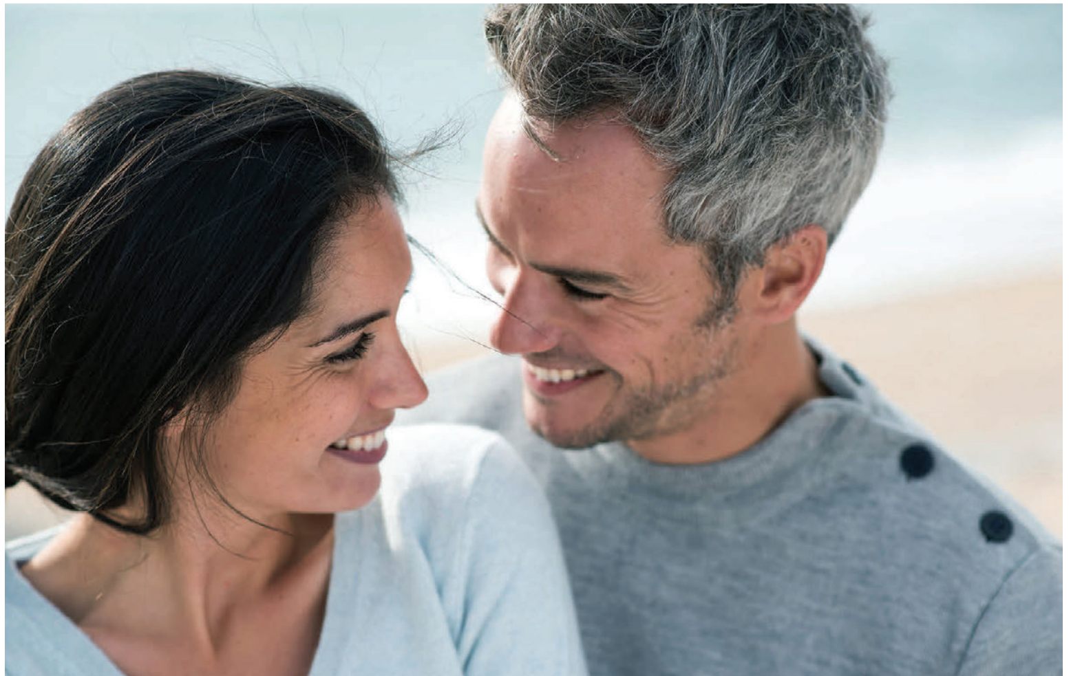
Flestir karlmenn finna fyrir einhverjum einkennum testósterónskorts einhvern tíma á lífsleiðinni.