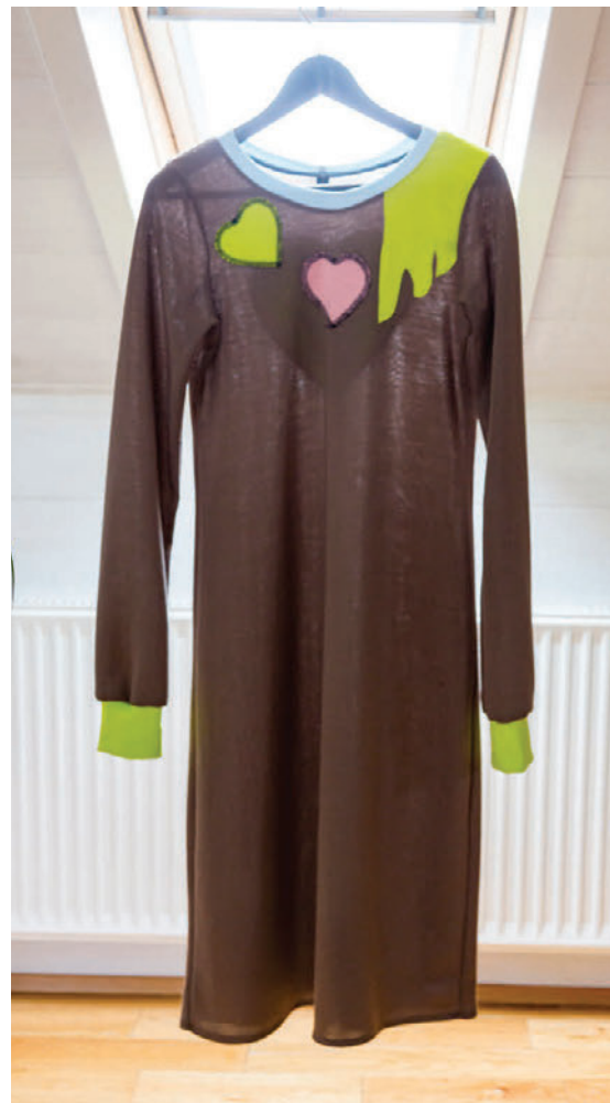
Þessi kjóll er hannaður af hönnunarteyminu Death Flower og fékkst í Leynibúðinni.

Skeifunni 8 • 108 Reykjavík • Sími: 517 6460 • www.belladonna.is