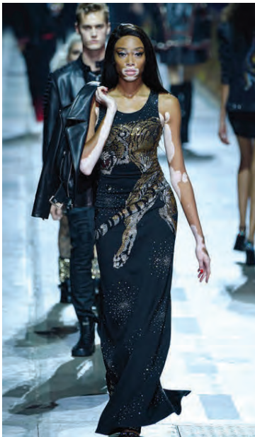
Glæsileg á tiskupöllumum.