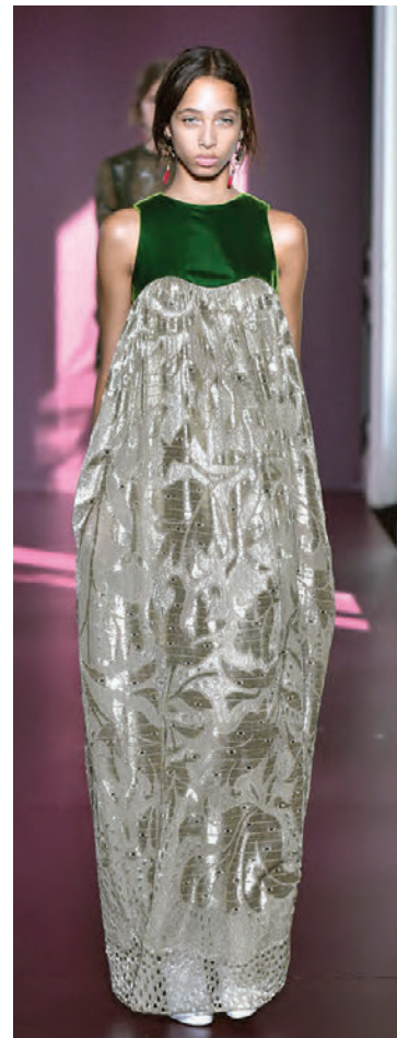
Valentino sá grængullinn bjarma yfir haustinu og deildi þeirri sýn með gestum á tiskusýningu sinni.