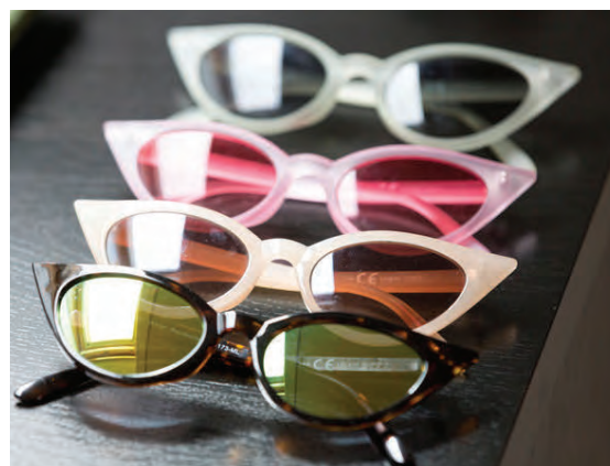
Dúfa elskar sólgleraugu og kaupir þau aðeins í Stellu í Bankastræti þar sem hún segir fást svölustu sixtis „cat eye“ sólgleraugu landsins.