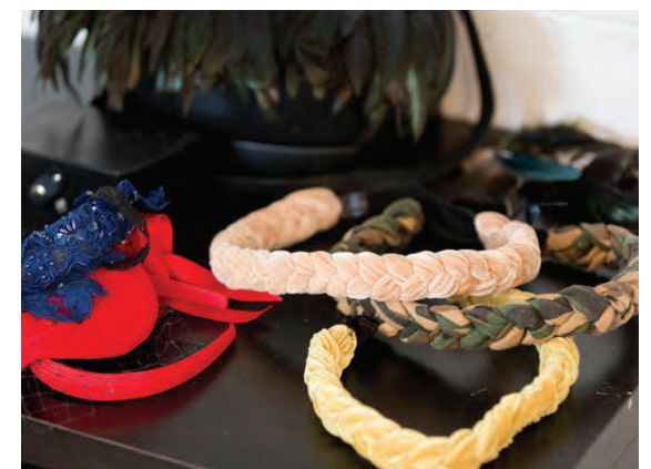
Fléttuhárbönd frá Death Flower og spangir frá Thelma Design eru í uppáhaldi.