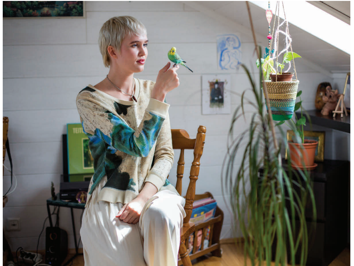
Bolurinn er frá Acne og buxurnar úr H&M. Páfagaukurinn er í eigu Dúfu og heitir Kirikou.

Hvað kaupirðu þó þú eigir nóg af því? Yfirhafnir þá helst vintage