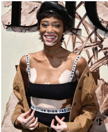
Uppgötvuð af Tyra Banks.