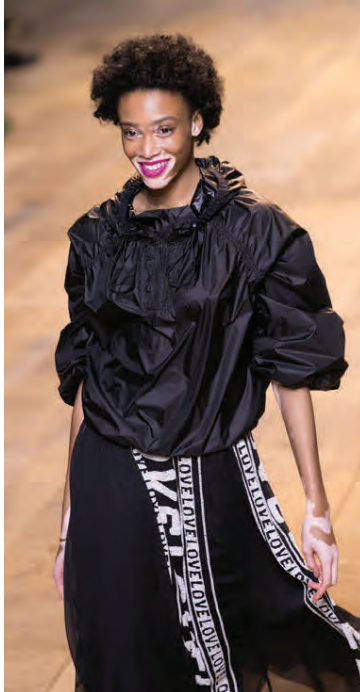
Vill að öllum líði vel í eigin skinni.