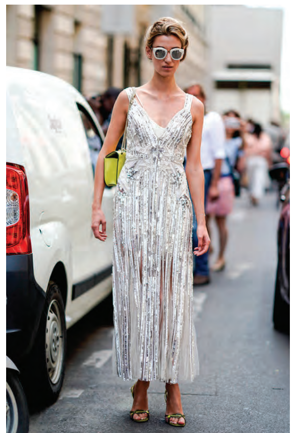
Gestir tiskuvikunnar í París voru fljóttir að taka við sér og hér er einn þeirra kominn í silfurdressið sitt og sólgleraugun.