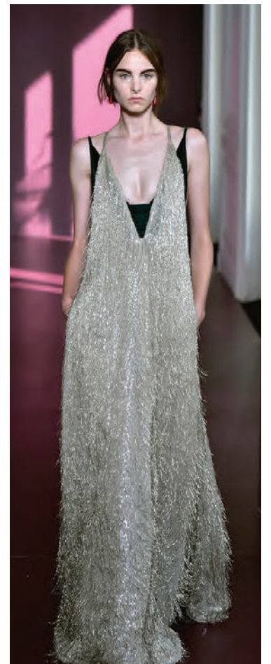
Áláferðin heillar flesta tiskuhönnuðinu um stundir og Valentino er þar engin undantekning.