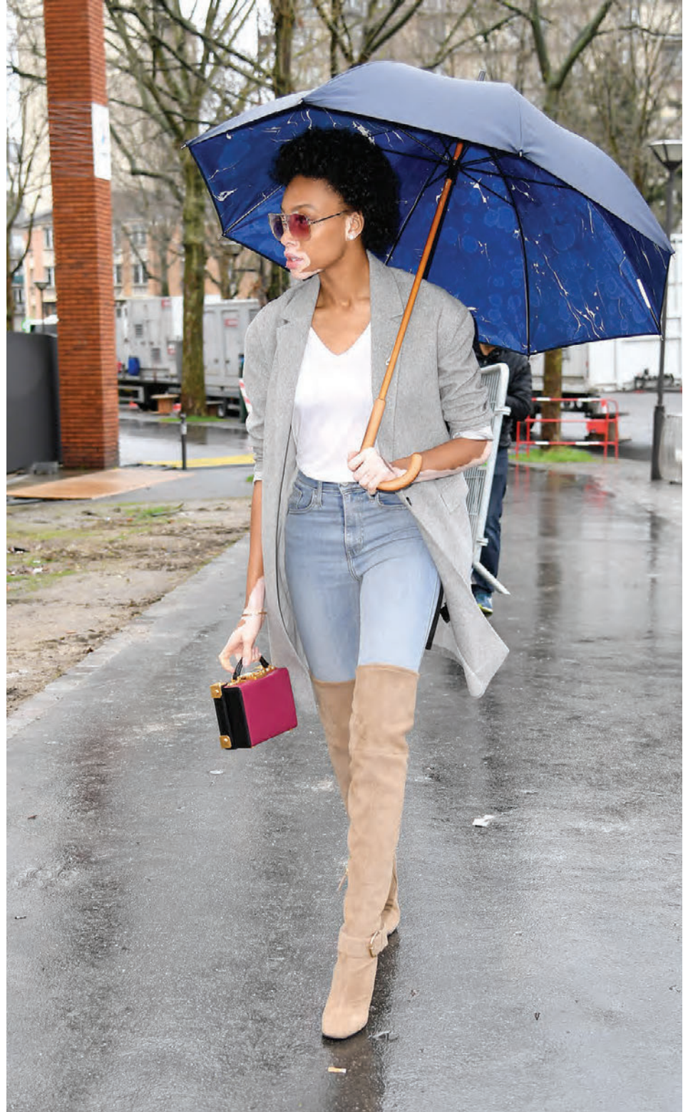
Fyrirsætan Winnie Harlow fagnar 23 ára afmæli í dag.