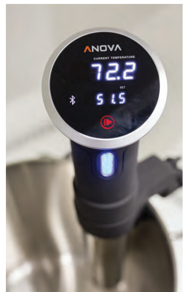
Tækjunum fylgir app en í því er að finna yfir 1.000 uppskriftir og kennslumyndbönd auk ítarlegra notkunarleiðbeininga

/iOS appi getur þú svo stjórnað skápnum og skoðað inn í hann þegar þú ert úti í búð að kaupa inn með aðstoð innbyggðar myndavéla. Neðra hólfíð hægra megin er svo með fjögur forstillt hitastig og hægt að nota það sem kæli, frysti eða sem 0-2 gráðu ferskvörusvæði, allt eftir því sem hentar hverju sinni,“ útskýrir Þorvaldur. Einfaldi skápurinn er 350 lítra. Hann er líka búinn 21,5" spjaldtölvu með sömu möguleikum og á þeim tvöfalda. Hann er með Chef Zone-hillu, Twin Cooling Plus aðskilin kælikerfi, Metal Cooling og handvirka klakavél í frystinum. Báðir eru skáparnir með kolauslan mótör sem er með tíu ára ábyrgð.