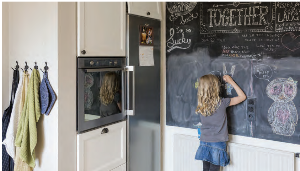
Kritarveggurinn er vinsæll hjá öllum fjölskyldumeðlimum. Málninguna fengu þau í Bauhaus.