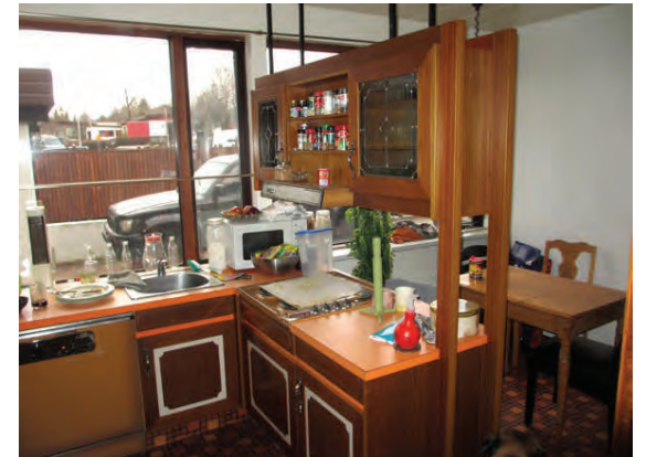
Áttundi áratugurinn í öllu sínu veldi, brúnum og appelsínugulum tönnum.