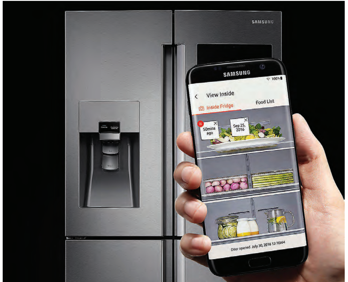
Með Android /iOS appi er hægt að stjórna skápnum og skoða inn í hann til dæmis úti í búð en til þess eru notaðar innbyggðar myndavélar.