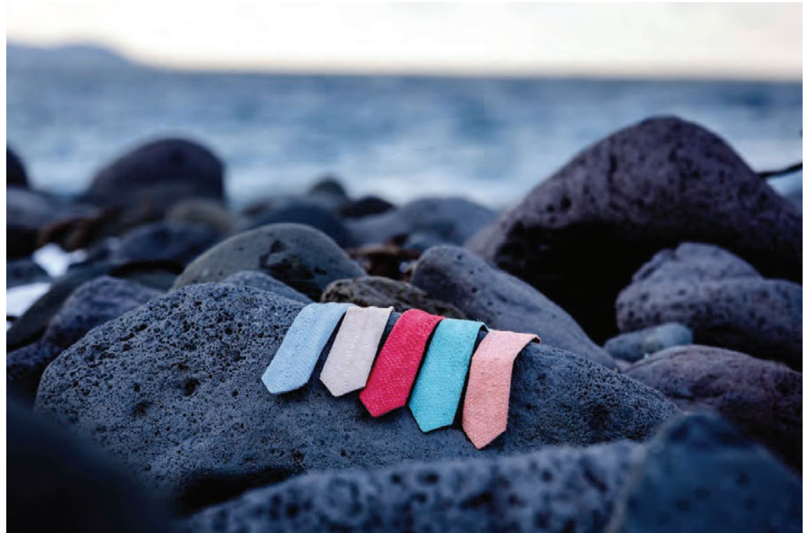
Bindin, sem eru unnin úr laxaleðri og fóðruð með hrásilki, eru falleg og litrík.