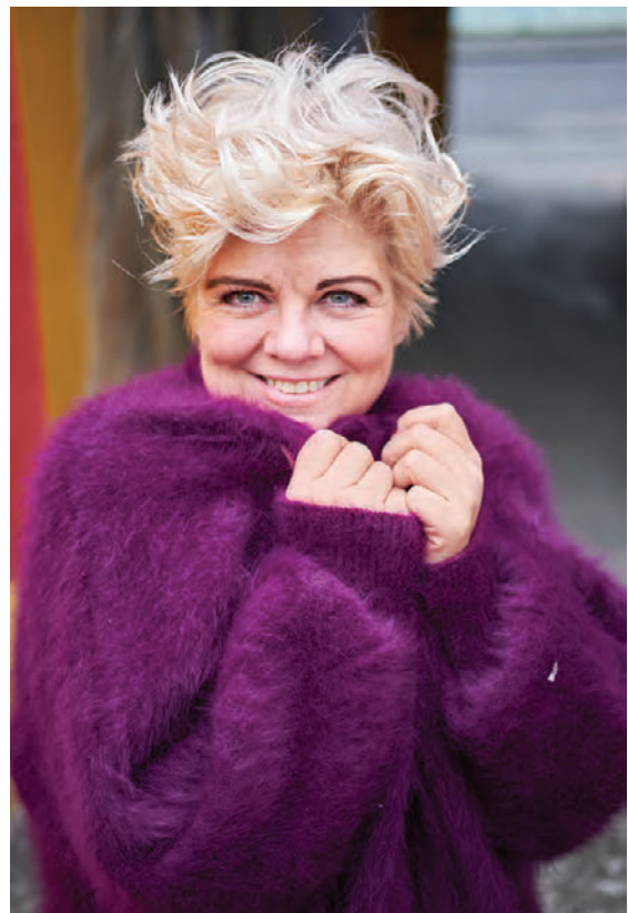
Fjólublái jakkinn er í miklu uppáhaldi. Hann er frá ROSE surk young co.

Hvaða flík er í mestu uppáhaldi hjá þér? „Nýi, fjólublái lodjakinn minn sem ég keypti mér á fyrstu vaktinni minni í Rauðakrossbúðinni. Hann er í miklu uppáhaldi. Fyrst þegar ég byrjaði að vinna í búðinni freistaðist ég oft til að kaupa eitthvað sem mér fannst fallegt en með tímanum verðum við