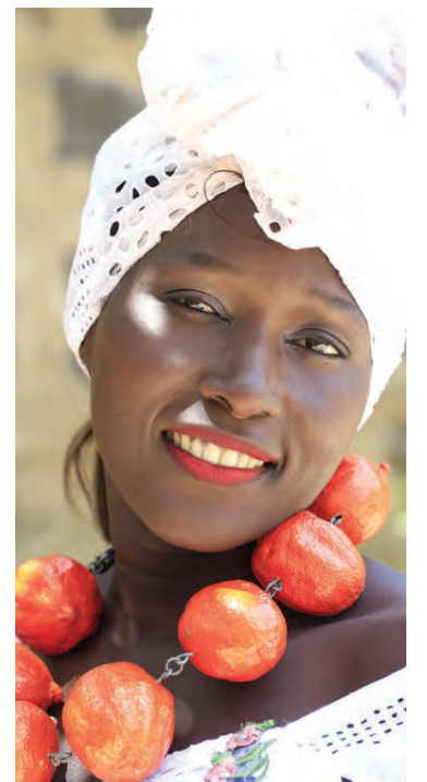
Skartgripir Huldu Ágústsdóttur freistuðu fegurðardísa í Senegal enda einstaklega klæðilegir og fagrir.