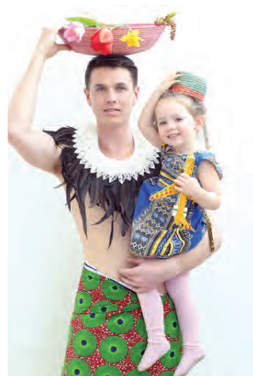
Litrik Senegal-klæði sem gleða og kæta bæði augu og anda.

Pop up-markaður Áslaugar verður í Mengi, Óðinsgötu 2, frá klukkan 13 til 15 á laugardag. Allir velkomnir!