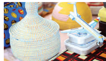
Kórfur sem láta drauma rætast sönnuðu sig svo um munaði í Senegal.

Pop up-markaður Áslaugar verður í Mengi, Óðinsgötu 2, frá klukkan 13 til 15 á laugardag. Allir velkomnir!