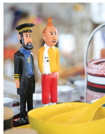
Tinni og Kolbeinn kaffeinn eru dæmi um handgerð leikföng frá Senegal.