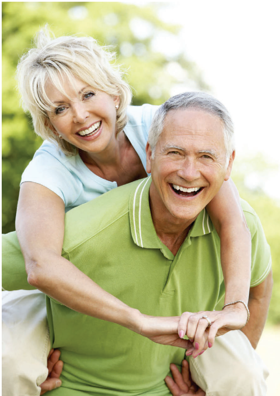
Macajurtin getur gagnast bæði körlum og konum.

Er fyrir konur eftir fimmtugt eða þær sem hafa ekki haft blæðingar síðustu 12 mánuði og fyrir konur sem hafa, vegna aðgerða eins og brottnáms á eggjastokkum, farið á breytingaskeiðið. Einkennin geta verið þau sömu og hjá konum sem