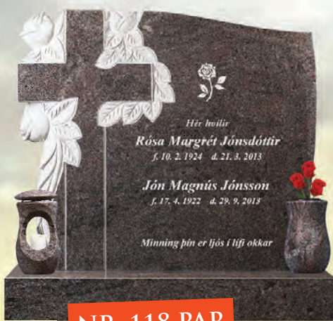
NR. 118 PAR