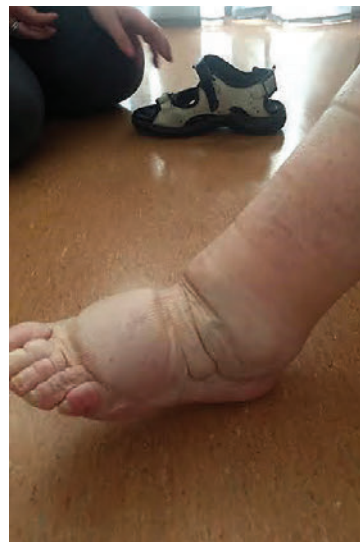
Kona sem er 87 ára og þjáðist af miklum bjúg á fæti kom í meðferð hjá Heilsu og útliti.