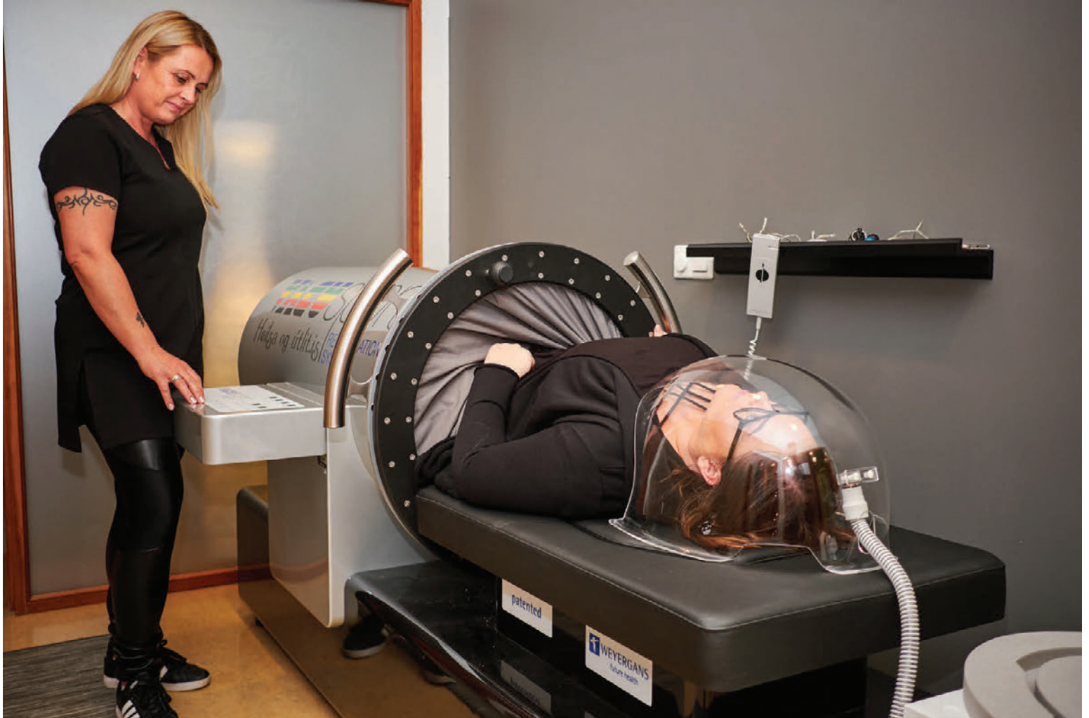
Neðri hluti líkamans í Vacu Sport tækinu.