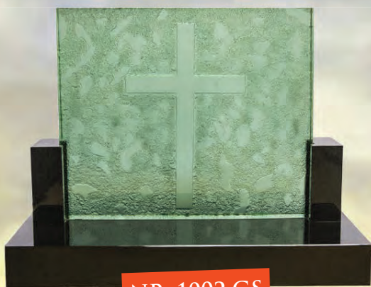
NR. 1002 GS