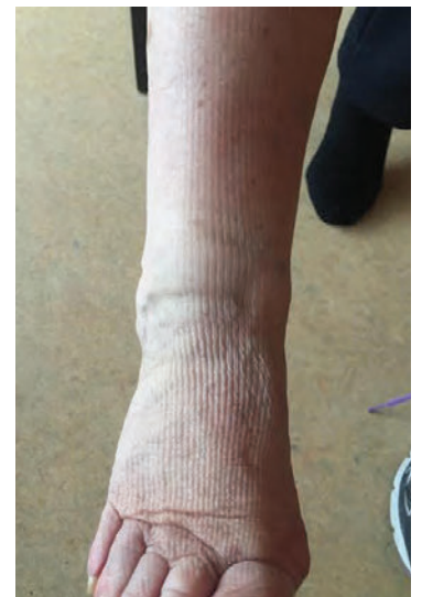
Eftir sex skipti í tækinu var bjúgurinn að mestu horfinn.

“Ég get mælt hundrað prósent með þessari meðferð hjá Heilsu og útliti. Þetta getur hentað öllum sem lenda í einhvers konar meiðslum, jafnt íþróttamönnum sem öðrum. Einnig er þetta mjög gott fyrir þá sem þjást af bjúg.