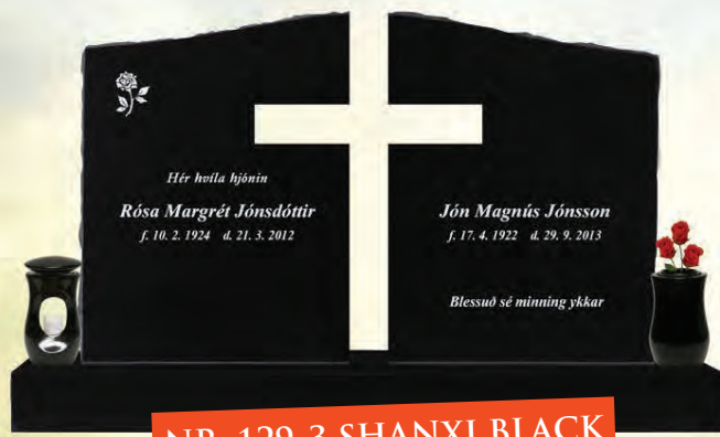
NR. 129-3 SHANXI BLACK

FYLGIHLOTIR FYLGJA EKKI MEÐ AKSTURSGJALD BÆTIST VIÐ UTAN HÖFUÐBORGARSVÆÐISINS