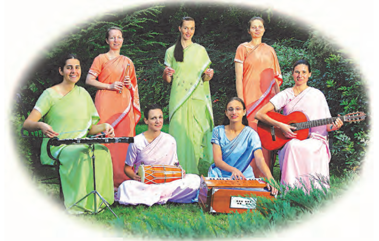
Kvennahljómssveitin Blue Flower hefur leikið hugleiðslutónlist um allan heim síðastliðna tvo áratugi.